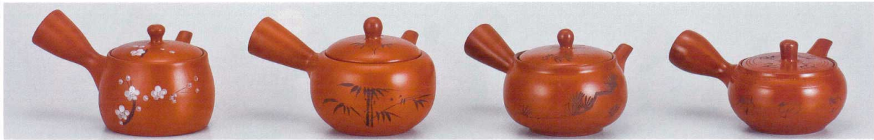
356-601-52 1,300円 朱泥白梅彫急須Uアミ付 (9.5×9.5-340cc) 535450352