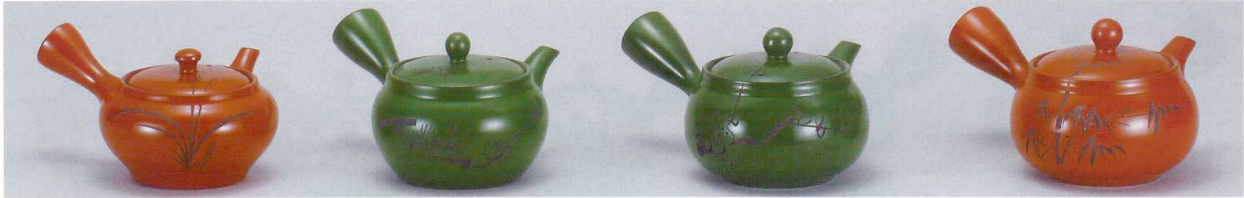
356-101-Y 1,850円 ぐるりアミ急須2.1号朱泥 (B2G) (380cc) 53541010Y