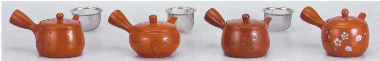
356-501-52 1,300円 朱泥細字彫急須カゴアミ付 (350cc) 535460152