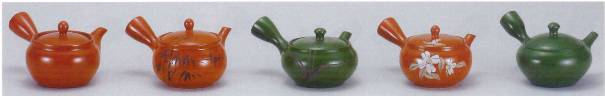
356-301-Y 1,650円 ぐるりアミ急須1.9号朱泥 (A8GN) (340cc) 53543010Y