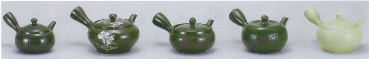
356-401-Y 1,400円 ぐるりアミ急須1.3号緑泥 (K13G) (240cc) 53544010Y