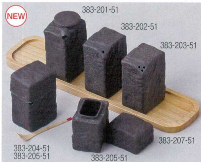
383-201-51 1,500円 石目黒伊賀汁次 (5.3×9-100cc) 538320151 383-202-51 900円 石目黒伊賀一穴塩入 (5.3×7.5) 538320351 383-203-51 900円 石目黒伊賀三穴胡椒入 (5.3×7.5) 538320251 383-204-51 1,100円 石目黒伊賀辛子入 (5.3×7.5) 538320451 383-205-51 160円 石目黒伊賀竹サジ (7.8) 538320551 383-206-51 1,000円 石目黒伊賀楊枝入 (5.3×7.5) 538320651 383-207-51 2,500円 クリアラッカ木台 (7×29×1) 538320751