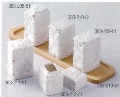
383-208-51 1,500円 石目白伊賀汁次 (5.3×9-100cc) 538320851 383-209-51 900円 石目白伊賀一穴塩入 (5.3×7.5) 538321051 383-210-51 900円 石目白伊賀三穴胡椒入 (5.3×7.5) 538320951 383-211-51 1,100円 石目白伊賀辛子入 (5.3×7.5) 538321151 383-212-51 1,000円 石目白伊賀楊枝入 (5.3×7.5) 538321251 383-213-51 2,500円 クリアラッカ木台 (7×29×1) 538321351