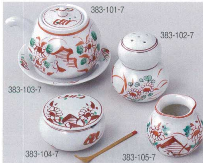
383-101-7 2,600円 花鳥汁次(皿付) (9.5×7×7 皿9.5×2-150cc) 538310107 383-102-7 1,500円 花鳥S&P (6×7.5) 538310207 383-103-7 1,500円 花鳥平カラシ入 (6×3.4) 538310307 383-104-7 210円 花鳥竹サジ (7.5) 538310507 383-105-7 1,000円 花鳥花鳥楊枝入 (5.5×5.5) 538310407