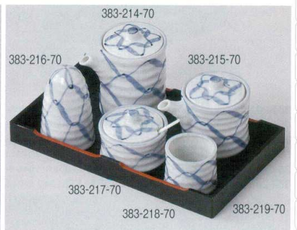
383-214-70 1,250円 手描アミ目汁次(大) (6.5×9.8-約180cc) 538321471 383-215-70 1,120円 手描アミ目汁次(小) (6.3×7.6-約120cc) 538321571 383-216-70 920円 手描アミ目一穴塩入 (5.2×8.3) 538321671 383-217-70 1,100円 手描アミ目辛子入 (ブラサジ付) (6.6×5.5) 538321771 383-218-70 530円 手描アミ目楊枝差 (4.7×4.2) 538321871 383-219-70 1,300円 手描アミ目黒塗盆 (22×13×2.3) 538321971