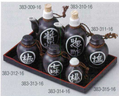
383-309-16 750円 民芸クロ醤油入 (6.5×13) 538330916 383-310-16 750円 民芸クロナース入 (6.5×13) 538331016 383-311-16 600円 民芸クロ塩入 (6×8.5) 538331116 383-312-16 600円 民芸クロ胡椒入 (6×8.5) 538331216 383-313-16 600円 民芸クロ七味入 (6×8.5) 538331316 383-314-16 420円 民芸クロ楊枝入 (5×7) 538331416 383-315-16 1,250円 カスター盆 (25.8×16×2.3) 538331516