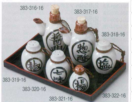
383-316-16 750円 民芸醤油入 (6.5×13) 538331616 383-317-16 750円 民芸ソース入 (6.5×13) 538331716 383-318-16 600円 民芸塩入 (6×8.5) 538331816 383-319-16 600円 民芸胡椒入 (6×8.5) 538331916 383-320-16 600円 民芸七味入 (6×8.5) 538332016 383-321-16 420円 民芸楊枝入 (5×7) 538332116 383-322-16 1,250円 民芸カスター盆 (25.8×16×2.3) 538332216