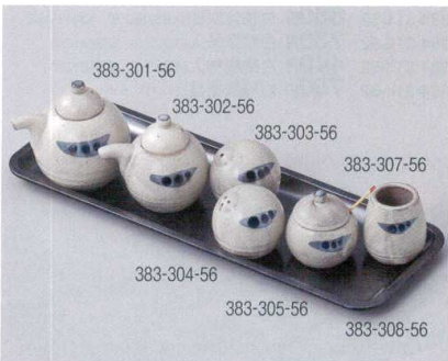
383-301-56 1,250円 Q-tai白呉須汁次(大) (9.5×8.0×9.2-200cc) 538330156 383-302-56 1,200円 Q-tai白呉須汁次(小) (8.8×7.0×8.2-130cc) 538330256 383-303-56 750円 Q-tai白呉須一穴塩入 (5.8×5.5) 538330356 383-304-56 750円 Q-tai白呉須三穴胡椒入 (5.8×5.5) 538330456 383-305-56 830円 Q-tai白呉須辛子入 (5.6×6.2) 538330556 383-306-56 190円 Q-tai白呉須竹サジ (8.0×0.9) 538330656 383-307-56 520円 Q-tai白呉須楊枝入 (5.0×5.5) 538330756 383-308-56 1,950円 Q-tai白呉須カスター盆(黒銀) (36.3×12.8×1.5) 638330856