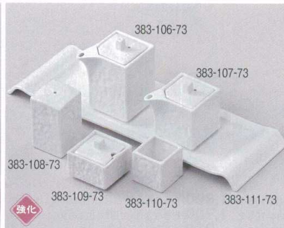
383-106-73 1,500円 白磁四角汁次(大) (5.5×5.5×9.3-200cc) 538310773 383-107-73 1,350円 白磁四角汁次(小) (5.5×5.5×7.5-140cc) 638310773 383-108-73 1,150円 白磁四角振掛 (4×4×7) 538310973 383-109-73 1,350円 白磁四角カラシ (サジ付) (5.4×5.4×5.3) 538310873 383-110-73 610円 白磁四角楊子入 (4.1×4.1×4) 538311073 383-111-73 2,050円 白磁11.0プレート (32.6×10.7×2.8) 538311173