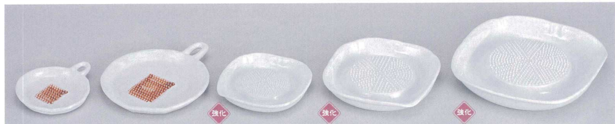
391-301-76 500円 白マット手付オロシ(小) (11×9×1.3) 639130176 391-302-76 750円 白マット手付オロシ(大) (16×13×1.6) 639130276 391-303-70 1,010円 ノンスリップおろし器小(白) (10.1×10.1×1.9) 539130471 391-304-70 1,660円 ノンスリップおろし器中(白) (13.5×13.5×2.2) 539130571 391-305-70 2,760円 ノンスリップおろし器大(白) (17.3×17.3×3.1) 539130671