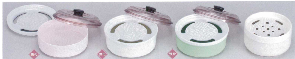
391-501-78 3,100円 オロシ鉢セット(ピンク) (14.3×4.7) 539150178 391-502-78 3,100円 オロシ鉢セット(クリーム) (14.3×4.7) 539150278 391-503-78 3,100円 オロシ鉢セット(グリーン) (14.3×4.7) 539150378 391-504-76 900円 オロシ付小鉢 (13×13×8) 539150476