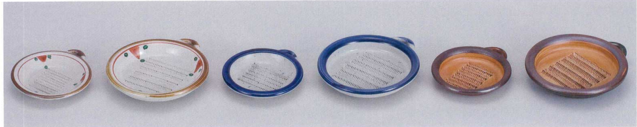
391-101-2 820円 赤絵ミニオロシ皿 (8.7) 539110102 391-102-2 880円 赤絵オロシ皿(小) (10.7) 539110202 391-103-2 630円 ルリゴマミニオロシ皿 (8.7) 539110502 391-104-2 710円 ルリゴマオロシ皿(小) (10.7) 539110602 391-105-16 630円 天目錆ミニオロシ皿 (10×8.8×1.9) 539120116 391-106-16 690円 天目錆3.8手付オロシ皿 (12.5×11×2.5) 539120216