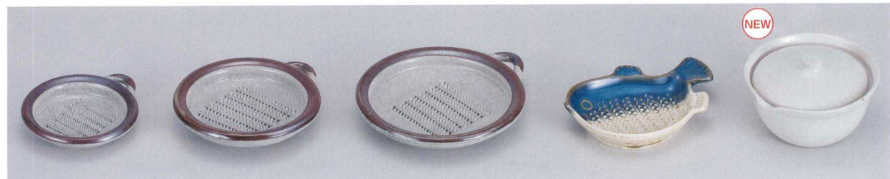
391-401-20 600円 梨地ミニオロシ皿 (10×1.9) 539120320 391-402-20 670円 梨地3.8オロシ皿 (12.4×2.5) 539120420 391-403-20 840円 梨地4.5オロシ皿 (14.3×2.5) 539120520 391-404-47 400円 ナマコふぐおろし小皿 (12×9×2.3) 639140447 391-405-2 1,500円 生姜越器 (10×5) 639140502