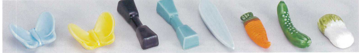
401-501-15 150円 蝶(青) 箸置 (5×4×2) 539950515 401-502-15 150円 蝶(黄) 箸置 (5×4×2) 539950615 401-503-10 180円 天目鼓 箸置 (6.7×1.6) 539950910 401-504-10 180円 トルコ鼓 箸置 (6.7×1.6) 539951010 401-505-5 135円 青磁笹 箸置 (8.5×2) 539961005 401-506-15 150円 人参 箸置 (1×6) 539970515 401-507-10 190円 きゅうり 箸置 (7×1.5) 539970210 401-508-15 150円 白菜 箸置 (1.5×5) 539970315