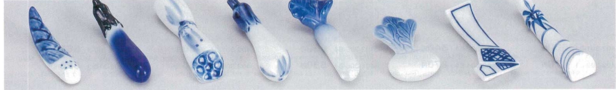
401-401-10 190円 竹の子 箸置 (6.5×1.5) 539940310 401-402-10 190円 なす 箸置 (6.8×1) 539940410 401-403-10 190円 染付レンコン 箸置 (7.6×2) 539940510 401-404-10 190円 染付ナス 箸置 (7.2×1.9) 539940610 401-405-10 190円 ダイコン 箸置 (7×2.8) 539940710 401-406-10 190円 カブ 箸置 (5.8×3.4) 539950210 401-407-10 170円 結 箸置 (6.8×2.8) 539950310 401-408-10 170円 竹節 箸置 (7.5×1.8) 539950410