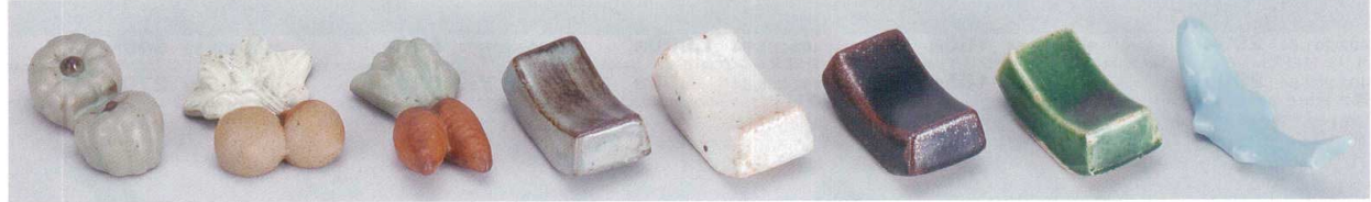
401-301-74 220円 カボチャ 箸置 (5.1×2.7) 539930574 401-302-74 220円 カブラ 箸置 (5.1×3.5) 539930474 401-303-74 220円 ニンジン 箸置 (6.2×2.8) 539930174 401-304-10 200円 唐津大舟 箸置 (5×2.5) 539930610 401-305-10 200円 志野大舟 箸置 (5×2.5) 539930910 401-306-10 200円 天目大舟 箸置 (5×2.5) 539931010 401-307-10 200円 オリベ大舟 箸置 (5×2.5) 539930710 401-308-10 260円 青磁アユ 箸置 (7×2.5) 539910910