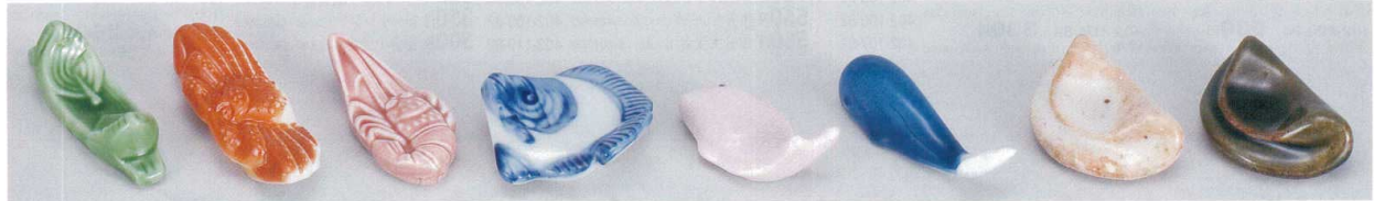
401-201-47 150円 笹舟グリーン箸置 (6.5×2×2) 539911047 401-202-10 190円 赤かに 箸置 (7×2.5) 539920510 401-203-10 190円 えび 箸置 (5.5×2) 539920610 401-204-10 170円 ヒラメ 箸置 (5×5) 539920810 401-205-10 200円 ピンクタイ 箸置 (4.6×2.7) 539920910 401-206-47 210円 クジラ箸置 (6×1.8×1.5) 539921047 401-207-10 200円 志野合せ箸置 (5.3×3.3×1.8) 539870710 401-208-10 200円 織部合せ箸置 (5.3×3.3×1.8) 539870810