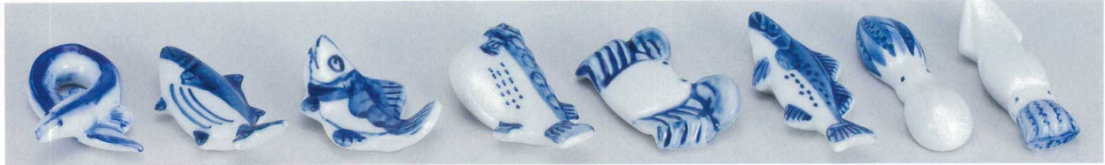
401-101-10 290円 うなぎ 箸置 (5.5×3.3) 539910110 401-102-10 200円 カツオ 箸置 (6.9×3.4) 539910310 401-103-10 200円 タイ 箸置 (6×3.8) 539910410 401-104-10 200円 フグ 箸置 (7.2×3.4) 539910510 401-105-10 200円 カニ 箸置 (6×3.5) 539910810 401-106-10 200円 サーモン 箸置 (7.6×3.2) 539910210 401-107-10 190円 タコ 箸置 (7.3×2.2) 539910610 401-108-10 190円 イカ 箸置 (7.5×2.3) 539910710