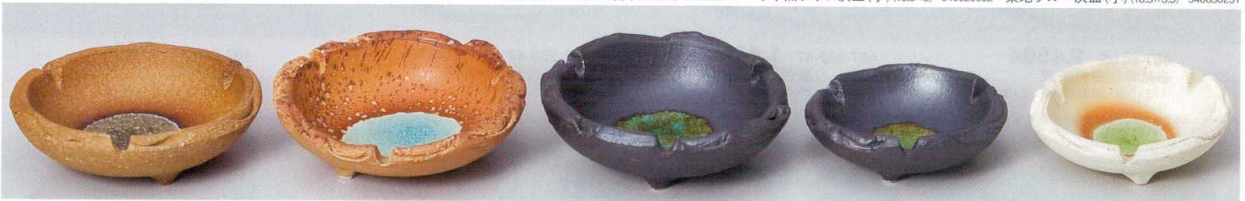
408-301-5 780円 白色ガラス灰皿(大) (14×5) 640830105 408-302-5 620円 白色ガラス灰皿(中) (11.5×4) 640830205 408-303-2 780円 湖水灰皿(大) (14×5) 540630702 408-304-15 620円 湖水灰皿(中) (11.5×3.5) 540630815 408-305-5 780円 黒釉灰皿(大) (14×5) 640830505 408-306-25 650円 黒釉ひねり灰皿(中) (11.0×3.5) 540630925 408-307-15 620円 無釉グリーン灰皿(中) (11.5×3.5) 540630615