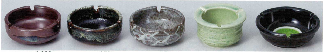
408-101-2 1,020円 鉄釉流し灰皿 (11.5×4.8) 540610102 408-102-2 950円 ゆず天目流し灰皿 (11.5×4.8) 540610202 408-103-2 950円 あみ灰皿 (11.5×4.8) 540610302 408-104-24 950円 グリーン朝顔灰皿 (10.8×6) 540610424 408-105-24 730円 天目グリーン玉洲灰皿(中) (13.7×4) 540630324 408-106-24 560円 天目グリーン玉洲灰皿(小) (10.5×3.7) 540630424