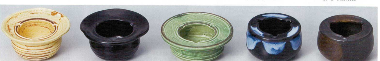
408-501-2 700円 伊良保帽子灰皿 (10.5×5) 540650102 408-502-2 700円 ゆず釉帽子灰皿 (10.5×5) 540650202 408-503-2 500円 ウグイス帽子灰皿 (11×3.7) 540650302 408-504-2 800円 天目白流し灰皿 (8.2×4.8) 540650402 408-505-2 800円 備前風灰皿 (8.2×4.8) 540650502