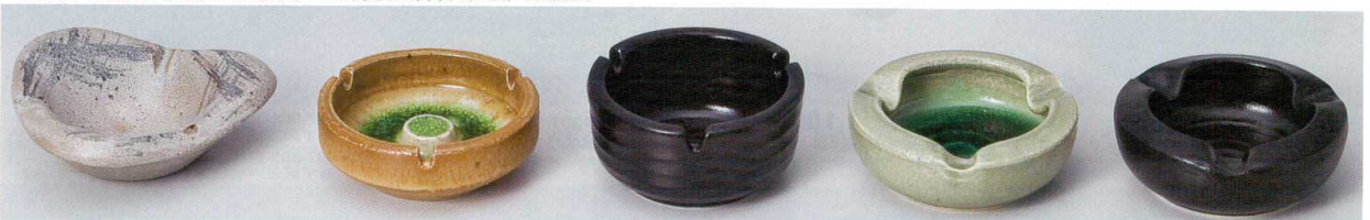
408-401-24 650円 おにぎり灰皿 (13×4.5) 540640124 408-402-24 600円 唐津小丸灰皿 (10.5×3.8) 540640224 408-403-47 650円 ゆず天目三っ切灰皿 (10×4.3) 540640347 408-404-51 600円 唐津丸型灰皿 (10.5×3.5) 540640451 408-405-2 550円 ゆず釉灰皿 (11×4) 540640502