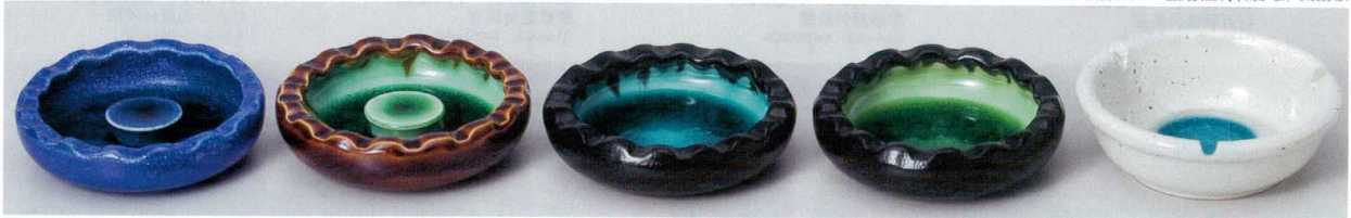
408-201-51 970円 八車へそ付ブルー灰皿 (12.5×3) 540620151 408-202-51 970円 八車へそ付アメ大灰皿 (12.5×3) 540620251 408-203-2 900円 ゆず黒ブルー灰皿(大) (13×3.5) 540620302 408-204-2 660円 ゆず黒ブルー灰皿(小) (10.5×3) 540620402 408-205-2 900円 ゆず黒グリーン灰皿(大) (13×3.5) 540620502 408-206-2 660円 ゆず黒グリーン灰皿(小) (10.5×3) 540620602 408-207-51 830円 梨地ブルー灰皿(大) (13.5×4) 540630151 408-208-51 630円 梨地ブルー灰皿(小) (10.5×3.5) 540630251