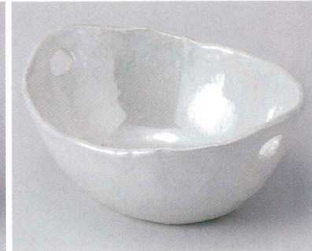
41-404-78 1,380円 真珠中鉢 (15.7×13.4×6.8) 504810378