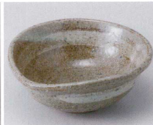
41-203-52 1,500円 土灰釉楕円鉢 (15.2×14×5.5) 504740452