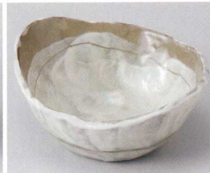
41-503-35 1,350円 化粧遊中鉢 (15.5×13.5×6.5) 504820135