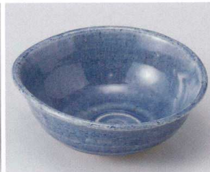
41-402-26 1,400円 藍染変型鉢 (15.5×14×5.8) 504750426