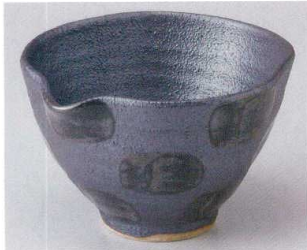
41-101-46 1,550円 黒市松片口鉢 (14×13×8.5) 504720146