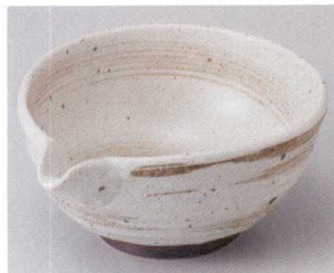
41-401-78 1,440円 梨地茶刷毛目5.0片口鉢 (16×13.5×7) 504810278