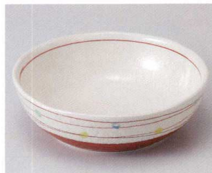
41-501-74 1,350円 点彩渦4.5浅ボール(赤) (13.8×4) 504830474