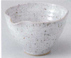
41-102-74 1,550円 樹水マルチボール (14×13.2×8.8) 504720274