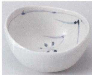
41-301-75 1,500円 草花変形マルチボール(中) (14×13×7.5) 504740275