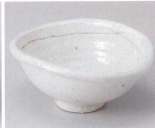
41-403-26 1,380円 粉引曲鉢 (15×12.8×6.5) 504820326