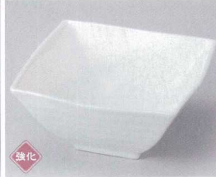
41-103-34 1,550円 NB13cm角鉢 (13×13×6.2) 504720434