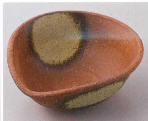
41-202-52 1,500円 伊賀火色楕円鉢 (15.2×14×5.5) 604120252