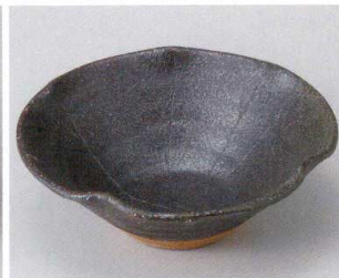
41-502-33 1,350円 鉄釉あさがお5.0鉢 (16.2×5.8) 504820433