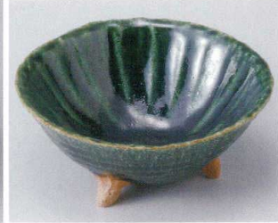
41-104-25 1,500円 織部小鉢 (16.3×6) 504750225