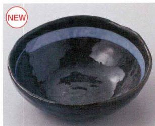
41-201-70 1,500円 黒化粧青帯5.0鉢 (14.7×14.3×5) 604120170