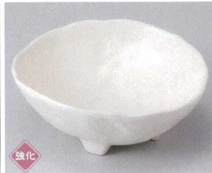
41-302-78 1,500円 クリーム三ツ足小鉢 (14.5×12.8×5.5) 504730378