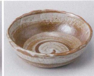
41-504-15 1,300円 灰粉引波型中鉢 (15×4.5) 504840115