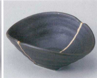
41-304-5 1,450円 黒伊賀金線小鉢 (14.8×11.3×6.4) 504750305