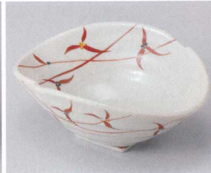
41-303-56 1,500円 風雅たわみ鉢 (15×11.3×6.3) 504730456