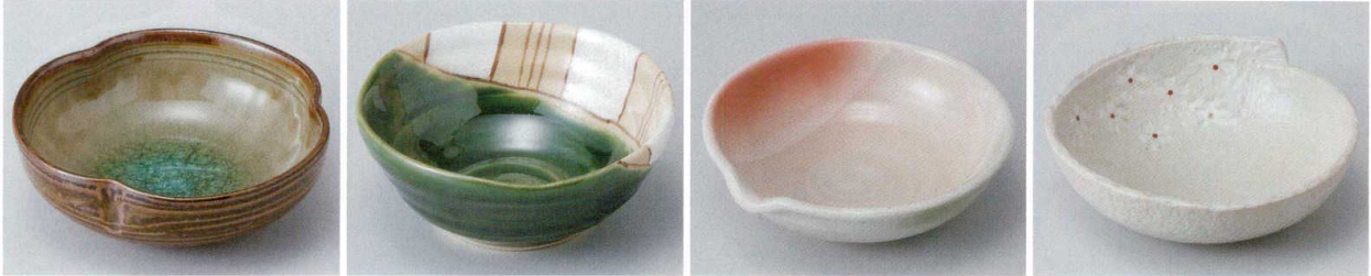
42-101-25 1,350円 灰釉ビードロ向付 (13.5×4.6) 504820225