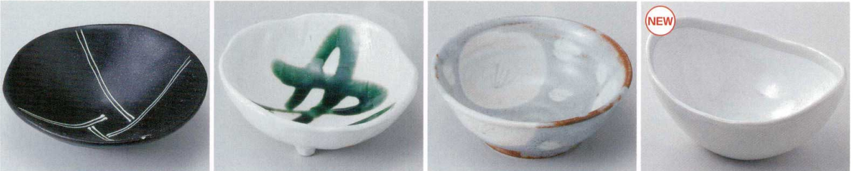
42-501-35 1,150円 いぶし黒円錐鉢 (17.2×6) 504930335

井 多用井 茶漬 飯碗 土瓶 ポット 急須 湯呑 千茶 車上小物 カスター 箸置 レンゲ スプーン 灰皿