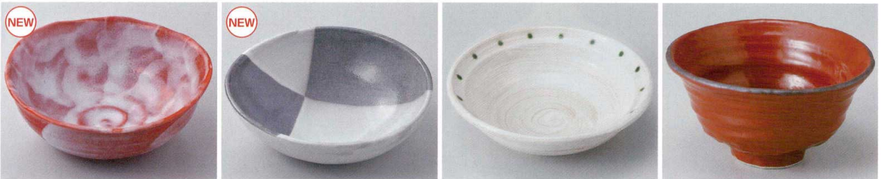
42-401-16 1,200円 赤彩手造鉢 (15.8×6.2) 604240116

多用皿 和風 バスタ 多用鉢 NEW 盛込鉢 盛込皿 酒器 フリー カップ そば 用品 めん 皿