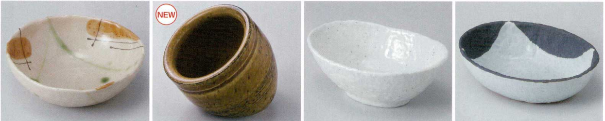
42-301-74 1,250円 線あそび5.0ボール (14.5×4.7) 504850474