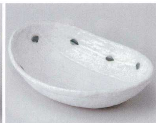
43-404-52 980円 白釉点織部舟型鉢 (18×11.8×4.5) 505020152