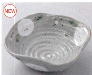
43-401-24 1,000円 白糖平鉢 (13.8×13.8×5) 604340124