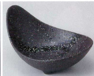
43-203-5 1,050円 慧星リップル片手三つ足鉢 (16.7×12×8.7) 504930105