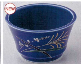
43-304-2 1,000円 化粧土饅頭野小鉢 (11.5×7) 604330402