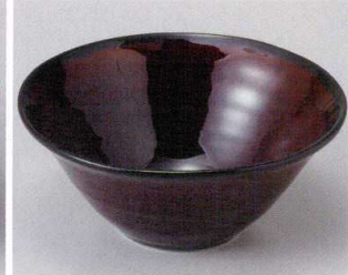
43-104-52 1,100円 うるし釉サラダ鉢 (14.8×6) 504940452