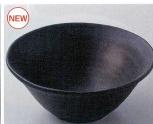
43-503-52 970円 備前風 サラダ鉢 (15×15×6.5) 604350352