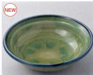
43-202-79 1,080円 灰釉流し4.5鉢 (15×4.2) 604320279