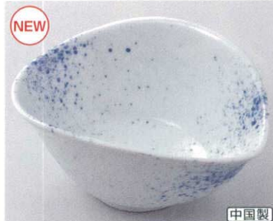
43-101-61 1,150円 吹墨笹形小鉢 大 (14×12.3×6.5) 604310161