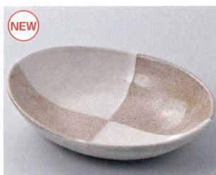
43-502-74 980円 唐津化粧楕円フルーツ鉢 (16.8×12.4×3.3) 604350274