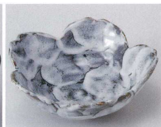
43-504-58 950円 サクラ鉢タタキ黒 (14.5×5) 505020458