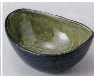
43-403-25 1,000円 窠変楕円鉢 (14.3×11.3×7) 505010325