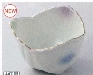
43-402-61 1,000円 三色吹三葉形小鉢 大 (10.8×7.5) 604340261