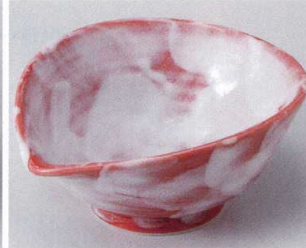
43-103-16 1,100円 赤彩ねじり鉢 大 (15.4×12.7×6.5) 504920416