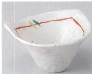
43-201-15 1,100円 赤絵短冊デザートカップ (13×12.5×7) 504920315