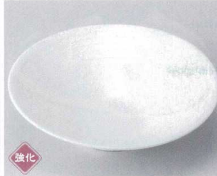
43-102-34 1,100円 N.Bウェーブ15cm平鉢 (15×3.3) 504810134