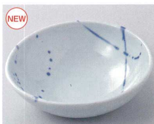
43-501-70 980円 コス散らしたまご4.5鉢 (13.7×12.8×4.3) 604350170