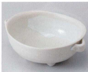
43-302-78 1,050円 黄志野サラダ鉢 (15.5×12×4.5) 504950278