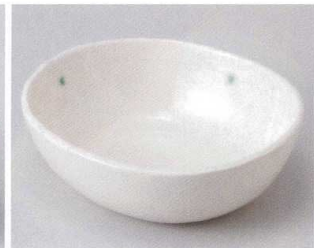
43-204-78 1,050円 グリーン点紋楕円鉢(大) (16.2×14×5.2) 504950178