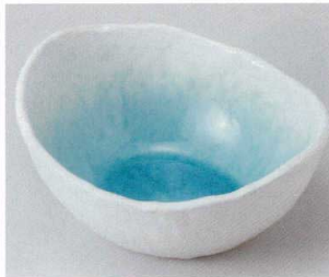
44-202-79 900円 白流水まゆ型小鉢(中) (15.5×13.2×6.7) 505020377