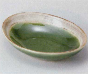
44-101-78 950円 オリベハケフルーツ鉢 (16.8×12.3×3.5) 505040278