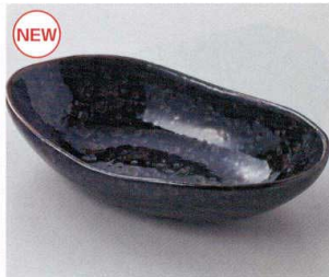
44-402-2 880円 油滴天目細長鉢 (17.8×9.5×7) 604440202