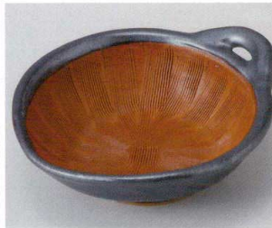
44-502-74 840円 黒釉三角すり鉢 (14.5×12.8×3.8) 505120377