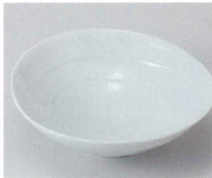
44-302-56 900円 青白美多用鉢 (17.5×16.4×5.7) 505110356