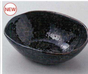
44-303-2 900円 油滴天目楕円鉢 (15×11.5×4.5) 604430302