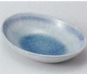
44-201-78 900円 オフケフルーツ鉢 (17×12.3×3.5) 505110478