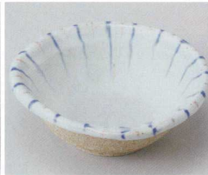
44-203-73 900円 志野二色十草4.5小鉢 (14×5) 505040473