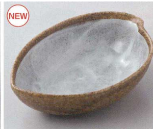
44-403-25 870円 伊賀化粧花型鉢(中) (16×11×4.5) 604440325