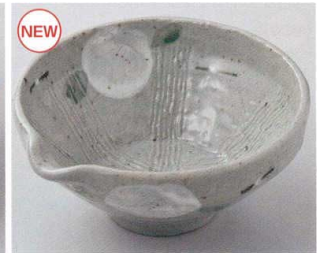
44-404-24 860円 白椿片口小鉢 (14.7×13.8×6) 604440424

めん皿 井 多用井 茶漬碗 飯碗 土瓶 ポット 魚須 湯呑 干茶 卓上小物 カスター 箸置