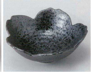
44-104-58 900円 サクラ鉢黒吹 (14.5×5) 505050158