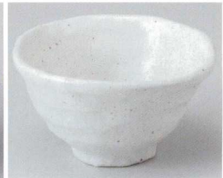
44-304-62 880円 白釉手作り風4.5小鉢 (13.5×13×7) 505050462