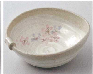
44-204-11 900円 刷毛花ちらし手付小鉢 (14×12.5×5) 604420411