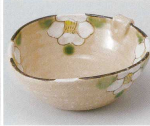
44-103-52 930円 織部椿耳付小鉢 (14×12.5×5) 505030352