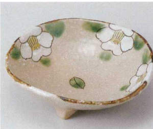
44-401-52 880円 織部椿三ツ足小鉢 (14×13.5×4.2) 505050352