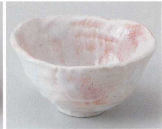
44-504-61 810円 桜志野小鉢 (12.5×13×6.6) 505130361