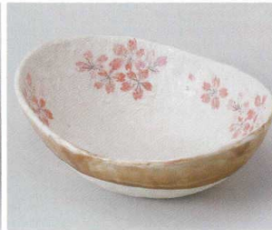
44-503-52 830円 平安桜楕円中鉢 (16×12.5×5.5) 505120452