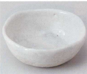
44-301-78 900円 志野茶刷毛小鉢 (13×4.5) 505120278