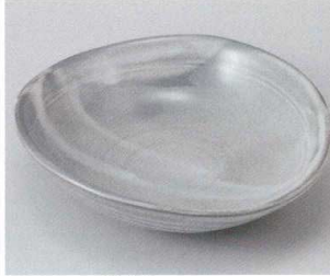
44-102-62 950円 粉引変形鉢 (16×4) 505030262