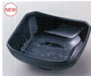
45-201-24 800円 不知火角4.5鉢 (13.8×13.8×5.4) 604520124