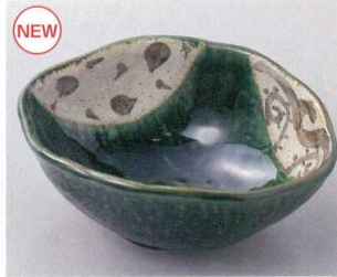
45-104-25 800円 織部トチリ変形小鉢 (15×11.5×16.5) 604510425