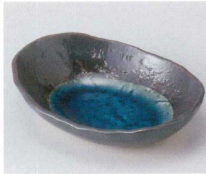
45-203-60 800円 海碧長円小鉢(手造り) (15.8×11.5×4.2) 505130460