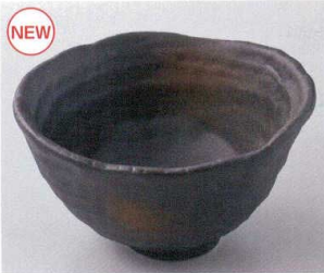
45-102-61 810円 備前風小鉢 (12.5×13×6.6) 604510261