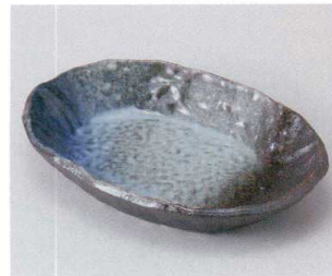
45-501-78 750円 均窯ブルーフルーツ皿 (18.3×13.5×3) 505150378