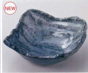
45-404-15 750円 深海 荒削り4.5小鉢 (14.3×14×5.5) 604540415