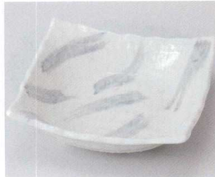
45-101-28 820円 さざなみ四つ足煮物鉢 (15.5×15.5×5.5) 505130128