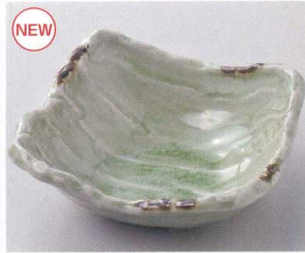
45-204-35 760円 笹みどり荒ソギ14cm小鉢 (14×14×5) 604520435