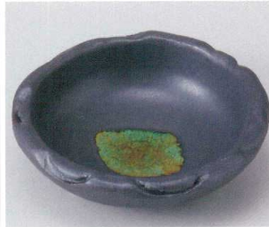
45-303-25 760円 サビひねり5.0鉢 (14.5×5.5) 505140225