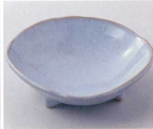
45-403-11 750円 均窯三ッ足小鉢 (14.5×14×4.5) 604540311