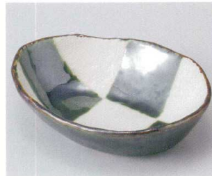
45-301-35 760円 石目楕円鉢織部格子 (15×12.5×4.5) 505140335