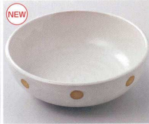
45-304-11 750円 ドロップ4.5鉢 (14×5) 604530411