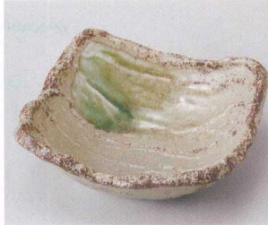
45-103-62 810円 荒ソギ緑彩14cm小鉢 (14×14×5) 505130262