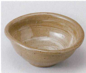
45-502-78 750円 黄彩刷毛目楕円小鉢 (15.5×3.5×6.3) 505210178