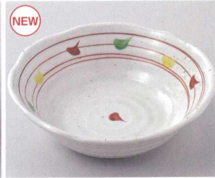
45-504-47 720円 粉引赤絵千鳥5.5鉢 (16.5×5) 604550447