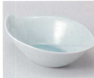
45-401-1 750円 青白磁しずく中鉢 (17.2×11.5×5) 505150101