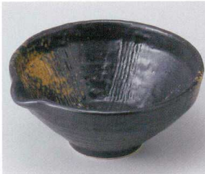
45-402-24 750円 結晶吹片口中鉢 (14.5×13.7×6.2) 505150424