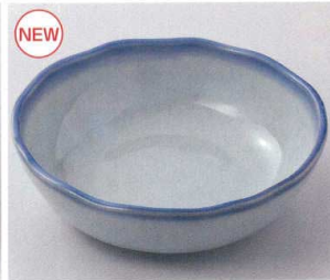
45-503-52 730円 うのふ青洲波瀾小鉢 (14×4) 604550352