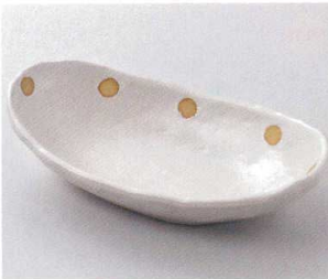
45-202-11 800円 ドロップ舟型小鉢 (19×10×4.5) 604520211