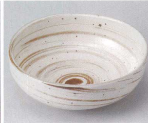
47-403-16 380円 サビ粉引40鉢 (13.2×4.7) 505340316