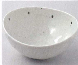
47-302-11 450円 粉引ドット楕円4.0鉢 (13.5×13×6.5) 604730211