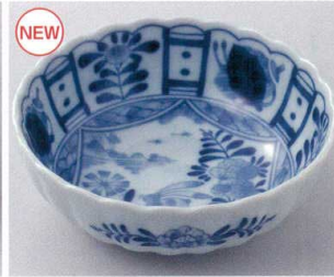
NEW 47-304-31 420円 間取草紋4.5鉢 (13.8×5) 604730431