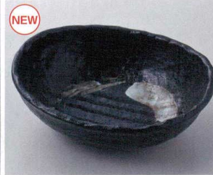
NEW 47-103-40 560円 うず湖 盛鉢 中 (15.2×12.8×5) 604710340