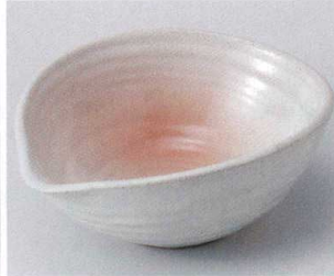
47-102-60 560円 萩釉変形小鉢 (14.5×12.2×5.5) 505320160