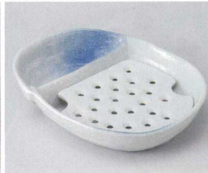
47-502-16 900円 やっこ鉢ブルー吹 (17×13×3.2) 505350316