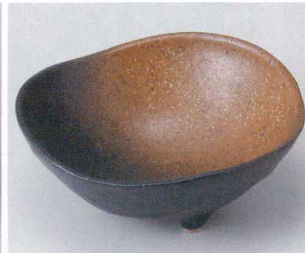
47-204-15 450円 黒備前三ツ足中鉢 (13.5×5.6) 505340115