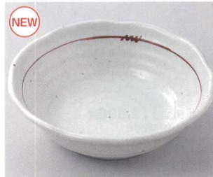
NEW 47-301-52 460円 赤結び4.5鉢 (13.6×4) 604730152