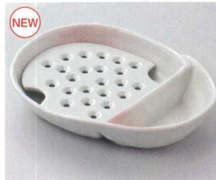
NEW 47-501-16 900円 やっこ鉢ピンク吹 (17×13×3.2) 604750116