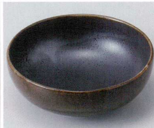
47-202-54 480円 明世黒4.5ボール (14×5) 505330254