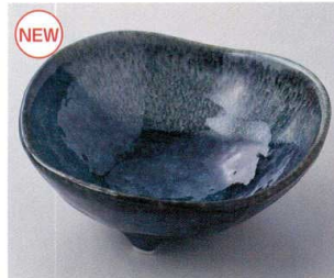
NEW 47-401-62 400円 深海三ツ足中鉢 (13.8×13.8×5.5) 604740162