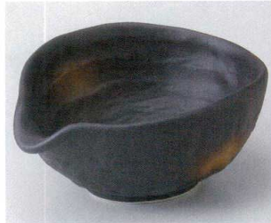
47-101-51 630円 美濃備前新片口4.0鉢 (14.2×11.5×6) 505310251