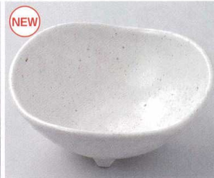
NEW 47-402-62 400円 白粉引三ツ足中鉢 (13.8×13.8×5.5) 604740262