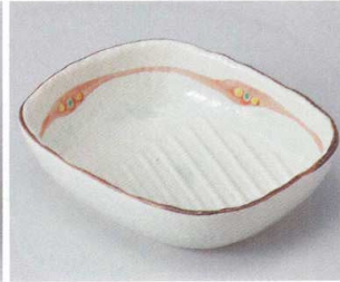
47-504-79 420円 ロマン小判奴鉢 (15.1×12.2×3.8) 505350271