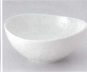
NEW 47-404-24 330円 雪粉引楕円4.0鉢 (13×13.3×6) 522750424