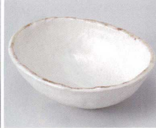
47-104-40 550円 吉野盛鉢(中) (15.2×12.8×5) 505320340