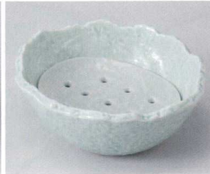
47-503-82 850円 青地奴鉢 (15.5×13.5×5.5) 505350482