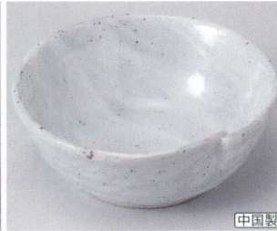
47-303-63 430円 粉引合わせ小鉢 (13.5×5) 505340263