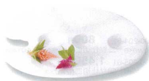
中国製 489-201-63 1,600円 28cm三穴フラット(27.7×22.5×1.6) 547210163