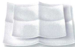
中国製 489-103-61 1,650円 四品浅口プレート(小)(19×19×2) 547020261 489-104-61 2,600円 四品浅口プレート(大)(24.5×24.5×2.2) 547020161