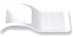
489-302-35 2,450円 N B ウェーブ2ピース皿(29.8×15.2×4.4) 548540735