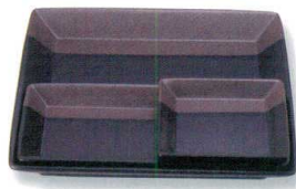
489-403-51 1,000円 和黒シンプル長角皿(24.4×11.7×2.1) 547610251 489-404-51 680円 和黒シンプル正角皿(小)(12×12×2.1) 547610351 489-405-51 2,350円 和黒シンプル正角皿(大)(26.4×26.4×3) 547610451