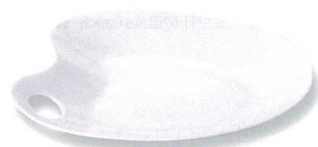
中国製 489-301-63 2,200円 32cm深口バレット(32×25×4.5) 547210263