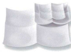
強化 中国製 489-303-63 600円 12cmフオーティ(12×12×2.8) 549030363 489-304-63 1,000円 16cmフオーティ(16.4×16.4×3.8) 549030263 489-305-63 2,600円 フオーティS(29.5×29.5×3) 549030163