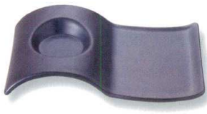
489-202-35 1,400円 黒マット2ピースウェーブ23cm皿(23.7×15×3) 546710135