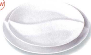
489-401-61 1,550円 YK イルカ ランチプレートS(23.3×22.9×3) 648940161 489-402-61 1,950円 YK イルカ ランチプレートL(26.8×26.4×3) 648940261