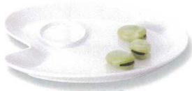
中国製 489-101-63 950円 21cmバレット取皿(21×15.5×2リング径4.9) 549110163