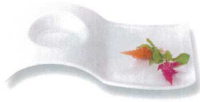
489-102-35 1,400円 N B 2ピースウェーブ23cm皿(23.7×15×3) 546610635