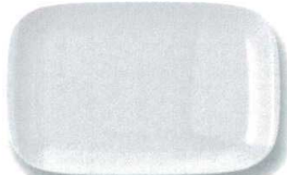
494-502-8 12,000円 18吋角プラター(46.5×28.8×4.6) 560450208