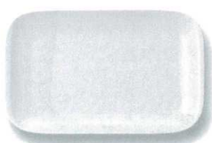
494-501-8 5,400円 16吋角プラター(42.5×26.5×4.2) 560450108