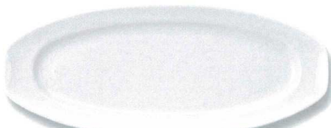
494-202-8 5,900円 白55cmサーモンプレート(54.5×22×3.8) 560420208