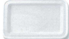
494-503-3 6,500円 白16吋用角フードパン(43.5×28.5×5.5) 560450303