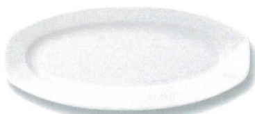
494-201-8 4,000円 白42cmサーモンプレート(42.3×18.3×3.3) 560420108