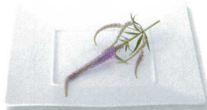
494-102-63 7,000円 アバント32cmスクエアプレート(32×32×3内寸16.5×16.5) 547710263