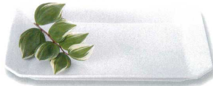
495-103-8 3,700円 15吋八角皿(34×24.5×4) 547910308