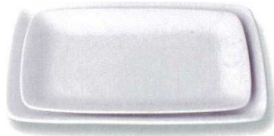
495-101-8 1,950円 12吋角プラター(32×21×2.4) 547910108 495-102-8 3,500円 14吋角プラター(36×24×3.5) 547910208