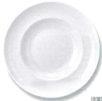
495-401-3 6,500円 白16吋用丸フードパン(33.5×6.0) 560440103