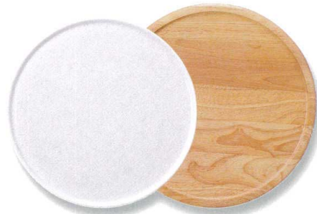
495-201-63 2,200円 テクノス30cmピザ皿(30.5×1.3) 549220163 495-202-63 3,700円 丸盆(L)(33.5×1.9・内径30.3) 549220263 495-203-63 1,600円 26.5cmピザ皿(26.6×1.5) 649520363 495-204-63 1,200円 21.5cmピザ皿(21.4×1.4) 649520463