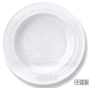
495-303-61 4,300円 KY46cm楕円皿(46×20.3×3.8) 649530361 495-304-61 5,000円 KY51.5cm楕円皿(51.5×23×4.2) 649530461 495-305-61 6,400円 KY58cm楕円皿(58.2×26.2×5.4) 649530561