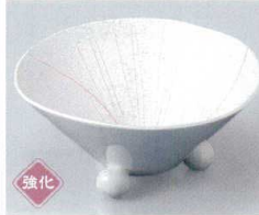
52-103-5 1,800円 ピンク珍三ツ足小鉢 (11.5×5.5) 505730305