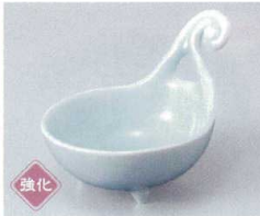
52-602-78 1,550円 青白磁ヒワ型手付小鉢 (9×11×8.1) 505810378