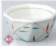
52-604-73 1,550円 金彩あし八角小鉢(中) (10.2×5) 505740473