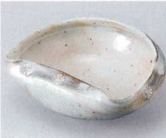
52-301-10 1,700円 手造り粉引貝型小鉢 (12.1×10.7×5.8) 505750210