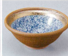
52-404-25 1,600円 信楽内吹金線小鉢 (13×5.3) 505760425