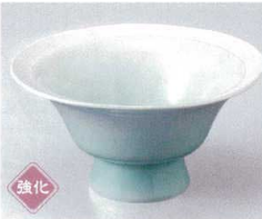
52-601-34 1,550円 ラスターヒワ吹高台4.0小鉢 (12.5×6.5) 505820234