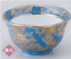
52-101-70 1,820円 金彩輪花丸小鉢(大) (11×6.3) 507410371