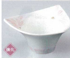
52-203-5 1,700円 ピンクラスター三方高台小鉢 (11×11×5.5) 505750305