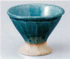
52-201-5 1,750円 緑袖デザート小鉢 (9.7×7.3) 505740305