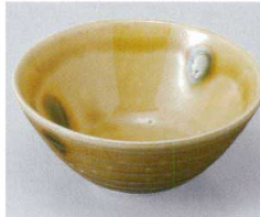
52-503-78 1,600円 黄瀬戸小鉢 (12×5) 505810478