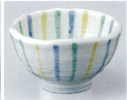
52-505-30 1,580円 黄磁三色十草3.6小鉢 (11×6.3) 505830230