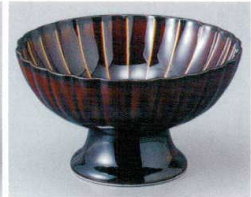
52-205-58 1,700円 きやまん陶菊割高台デザート (11.5×6.7) 505750458