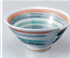
52-204-25 1,700円 黒呉須巻合わせ小鉢 (11.5×5.7) 505750125