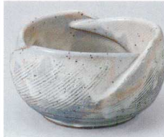
52-303-58 1,650円 粉引節目切合せ丸小鉢 (10×6.5) 505760158