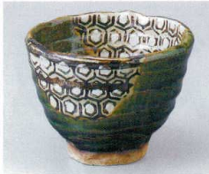
52-302-61 1,700円 織部亀甲小鉢 (11×8.5) 505750561