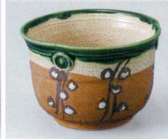
52-104-2 1,800円 平安織部深小鉢 (11×7.3) 505730402