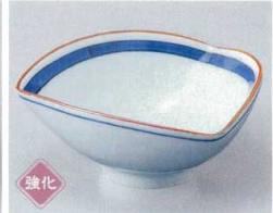
52-405-34 1,600円 染付線三方小鉢 (11.5×11×5) 505760534