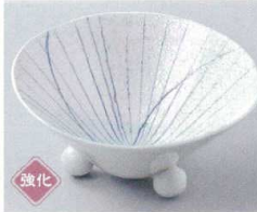
52-102-17 1,800円 ブルー珍ラスター三ツ足小鉢 (11.5×5.3) 605210217