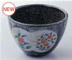
52-501-2 1,600円 兼志野草花紋小鉢 (10×7) 605250102