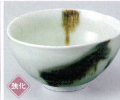
52-504-34 1,580円 飛び青磁楕円4.0小鉢 (11.7×10.5×5.8) 505810534