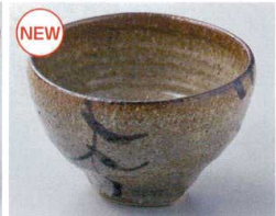
52-305-34 1,600円 (手造り)唐津草紋丸鉢 (11×7) 605230534