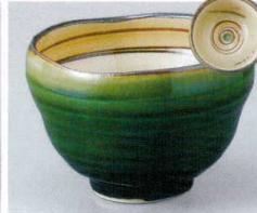
52-304-34 1,650円 外織部内弥七田3.5小鉢 (10.5×7.5) 505760234