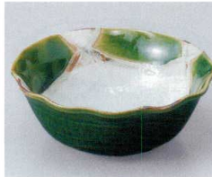
52-603-78 1,550円 織部格子波型小鉢 (12.8×5) 505820378