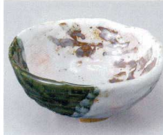
52-403-30 1,620円 織部古木小鉢 (12.8×5.5) 505830430