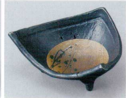
52-105-25 1,800円 黒釉満月三角小鉢 (14×12×6.5) 505730525