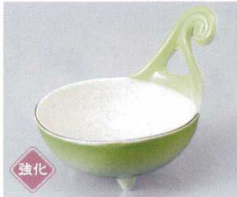
52-502-70 1,600円 淵金ヒワ吹ヒワ型手付小鉢 (9×11×8.1) 505820577