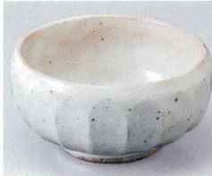
52-202-46 1,700円 粉引面取4.0小鉢 (12×6) 505740546