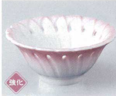
52-402-70 1,660円 ピンク吹かごめ3.6小鉢 (11×4.9) 505810271