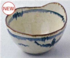
52-401-30 1,600円 御深井草紋変形小鉢 (11.2×7.3) 605240130