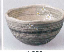
53-504-74 1,350円 花散し小鉢(紺) (12×6.2) 505910574