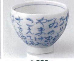
53-405-33 1,380円 呉須いろは高台3.5鉢 (10.5×7.8) 505910233