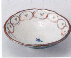
53-103-34 1,500円 丸紋なぶり小鉢 (13×4) 505840134