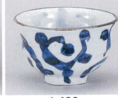
53-503-25 1,400円 タコ唐草3.3小井軽量土 (10×6.3) 537810425