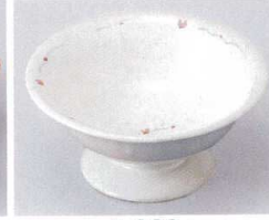
53-605-78 1,330円 粉引小花高台小鉢 (12.3×5.7) 505930478