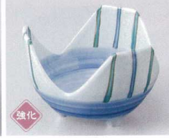
53-204-73 1,400円 コス巻グリーントクサミツ山3.3小鉢 (10×7) 505860573