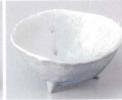
53-603-74 1,350円 白油滴三ツ足小鉢 (13×5.7) 505920274