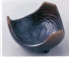
53-203-47 1,430円 やしめ流水中鉢 (10.8×5.8) 605320347