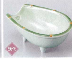
53-502-78 1,330円 緑彩箕型小鉢 (12×8.5×4.9) 505930278