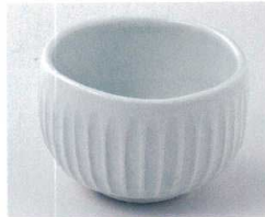
53-101-25 1,500円 青磁ソギ目小抹茶 (9.5×6.5) 605310125