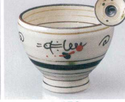
53-205-34 1,450円 弥七田高台小鉢 (10.4×8.2) 505850334