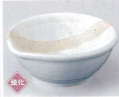
53-102-78 1,550円 粉引塗分け片口4.0鉢 (12.2×11.8×4.8) 505820478