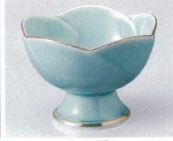
53-105-17 1,450円 淵金高台天竜寺3.0小鉢 (9.8×7) 505860217