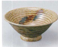
53-201-7 1,450円 黄瀬戸朝顔小鉢 (12×5.5) 505850207