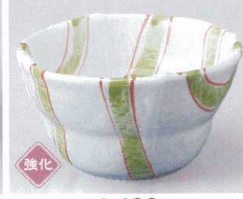
53-305-74 1,400円 ライン小鉢(大) (10.3×5.5) 505860174