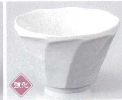
53-603-74 1,350円 NB面取3.6小鉢 (11×7) 505940134