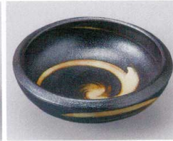
53-302-2 1,450円 鳴門平小鉢 (12×4.5) 505840202