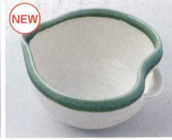
53-104-75 1,500円 織部エッグセバライト&お玉立 大 (12.2×11.5×6) 605310475