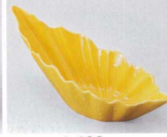
53-403-5 1,400円 黄釉一方上り小鉢 (20×7.8×7.8) 505850505