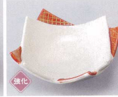
53-604-78 1,330円 赤絵重ね型皿(小) (11×11×3.6) 505930177