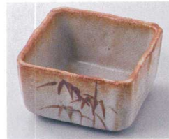
53-301-30 1,400円 赤志野竹 4.0角小鉢 (9.3×9.3×5.4) 605330130