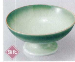
53-401-70 1,440円 緑彩高台小鉢 (11.7×5.7) 505850171