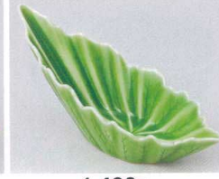
53-404-5 1,400円 若草一方上り小鉢 (20×7.8×7.8) 500820405