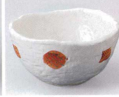
53-402-74 1,400円 夢のカケラ深小鉢 (12.5×6.2) 505910174