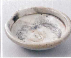
53-303-25 1,450円 粉引揃目片押し小鉢 (11.5×11×3.5) 605330325