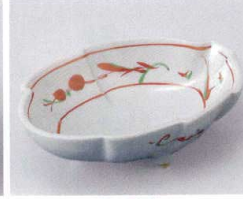
53-304-34 1,400円 赤玉葉型小鉢 (13.5×9.5×3.5) 505860434