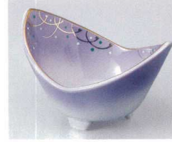
53-501-73 1,350円 紫むさしの二ツ割小鉢(小) (12×8.5×7.2) 505920473