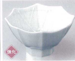
53-202-34 1,450円 青白一珍八角小鉢 (10.3×11.5×6.3) 505860334