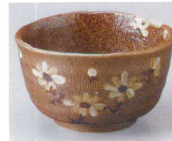
53-601-74 1,350円 南蛮秋桜花小鉢 (10×5.8) 505920374