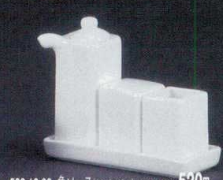
589-13-63 角ソース(41×9×110cc) 556901363 520円 589-14-63 三穴塩こしょう(4×4×5) 556901463 270円 589-15-63 角糖子入れ(4×4×5.5) 556901563 270円 589-16-63 トレー(13.7×5.5×1.7) 556901663 350円