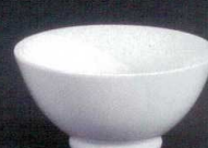
589-31-63 730円 14cmめし丼(14×7.5) 556903163