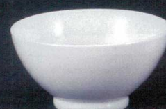
589-27-63 1,200円 18cm丼(17.8×8.9) 556902763