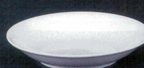
589-21-63 1,050円 23cmフカヒレスープ(23×4.1) 556902163