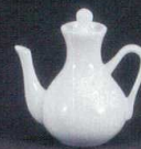
589-17-63 570円 カスター(10×110cc) 556901763