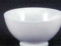
589-28-63 1,050円 16cm丼(16×8.5) 556902863