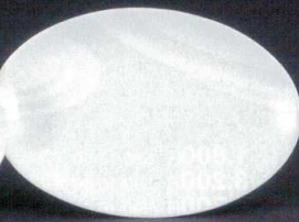
589-6-63 750円 23cmメタプラター(22.5×15×2.2) 556900663