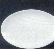
589-5-63 600円 20cmメタプラター(19.3×13×2) 556900563