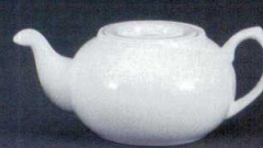
589-11-63 1,600円 ポット(S)(12.5×7.5×500cc) 556901163