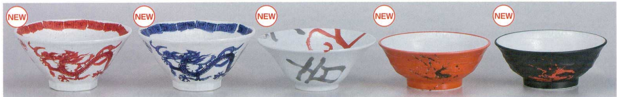
602-301-61 3,100円 龍虎赤八角7.0井(22×11.4) 660230161 602-302-61 2,400円 龍虎赤八角6.3井(19×9.7) 660230261