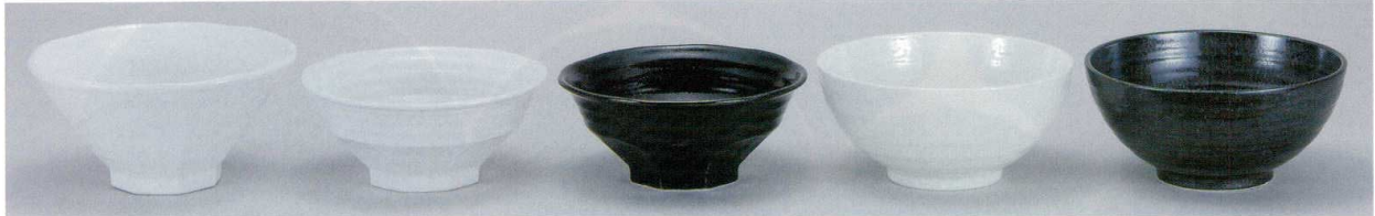
602-101-46 2,100円 白玉粉引八角7.0井(22×11.4) 560020146 602-102-46 1,500円 白玉粉引八角6.3井(19×9.7) 560020246