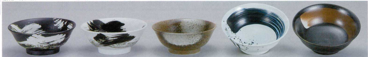
602-401-31 1,300円 黒檀(こくたん)7.0反井 (21.7×9) 560040131