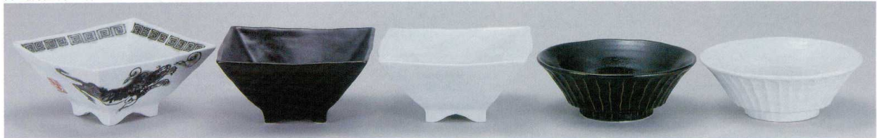
602-201-62 3,800円 龍虎7.0四角井 (21×20.5×10) 560030162