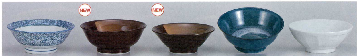
602-501-60 1,980円 たご唐草 7.0反り高台井(21.6×8.4) 560050160 602-502-60 1,760円 たご唐草 6.5反り高台井(20.2×8) 560050260