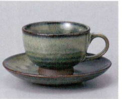
632-109-57 1,200円 灰うのふコーヒ- C/S 562511157 632-110-57 670円 灰うのふコーヒ-碗丈 (8.5×6-180cc) 562511257