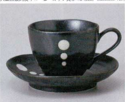
632-605-40 650円 粉引ポイントコーヒ-碗皿 (皿13.5×2.8) 562540540 632-606-40 410円 粉引ポイントコーヒ-碗 (8.5×6.5-180cc) 562540640