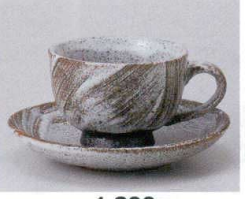
632-207-57 1,300円 さぎ波 C/S 562460557 632-208-57 720円 さぎ波碗丈 (8.7×6.5-180cc) 562460657