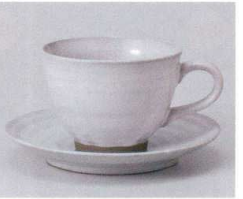
632-309-52 950円 土物都白コーヒ- C/S (皿14×2) 562520952 632-310-52 570円 土物都白コーヒ-碗丈 (9×6.5-210cc) 562521052