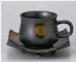
632-403-52 1,000円 焼しめコーヒ- C/S (皿11.5×11.5) 562520552 632-404-52 500円 焼しめコーヒ-碗丈 (6.8×5.5-130cc) 562520652