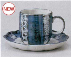
NEW 632-103-15 1,380円 菊型祥瑞コーヒ-碗皿 (6.7×7.5) 663210315 632-104-15 830円 菊型祥瑞コーヒ-碗のみ (6.7×6.7-180cc) 663210415