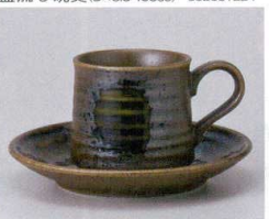
632-607-40 650円 天目コーヒ-碗皿 (皿14×2) 562540340 632-609-40 410円 天目コーヒ-碗丈 (6.7×6.5-150cc) 562540440