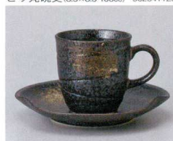
632-601-24 1,300円 黒油滴小コーヒ- C/S (7×7.3) 562460724 632-602-24 800円 黒油滴小コーヒ-碗丈 (7×7.3 皿14.5-170cc) 562460824