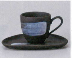
632-407-1 930円 黒ハケメコーヒ- C/S (皿15.5×12.5) 562530301 632-408-1 480円 黒ハケメコーヒ-碗丈 (7×6.7-160cc) 562530401