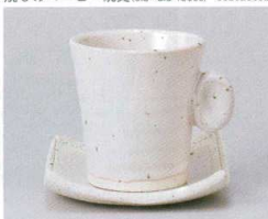
632-503-26 1,700円 乳白つまみデミタスコーヒ- C/S (皿8.5×8.5) 562540226 632-504-26 1,000円 乳白つまみ碗丈 (6×6-100cc) 562540926