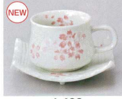
NEW 632-201-52 1,400円 しだれ桜コーヒ-碗皿 (6.8×5.5-皿11.5×11.5) 663220152 632-202-52 700円 しだれ桜コーヒ-碗 (13.0cc) 663220252