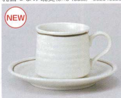
NEW 632-603-40 680円 白マット コーヒ-碗皿 (皿14×2) 663260340 632-604-40 430円 白マット コーヒ-碗 (6.7×6.5-150cc) 663260440