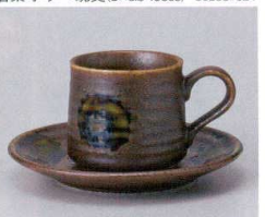
632-610-40 650円 茶水晶コーヒ-碗皿 (皿14×2) 562540140 632-611-40 410円 茶水晶コーヒ-碗 (6.7×6.5-150cc) 562540240