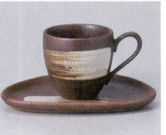
632-409-1 930円 茶ハケメコーヒ- C/S (皿15.5×12.5) 562530501 632-410-1 480円 茶ハケメコーヒ-碗丈 (7×6.7-160cc) 562530601