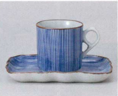
632-405-52 980円 土物細十草角コーヒ- C/S (皿15×11×1.7) 562520752 632-406-52 590円 土物細十草角コーヒ-碗丈 (6.7×6.7-180cc) 562520852