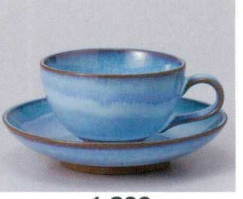
632-209-15 1,300円 グリーン均窯コーヒ-碗皿 (9×6) 562510515 632-210-15 620円 グリーン均窯コーヒ-碗 (9×5-180cc) 562510615