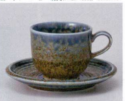
632-507-24 770円 藍流し C/S (皿14×2) 562531124 632-508-24 480円 藍流し碗丈 (8×6.5-190cc) 562531224