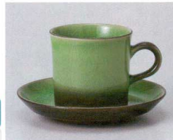
632-401-16 1,300円 もえぎコーヒ- C/S (皿13) 562461116 632-402-16 800円 もえぎコーヒ-碗丈 (7.2×6.8-160cc) 562461216