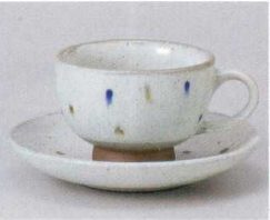
632-105-57 1,350円 荒粉引水玉コーヒ- C/S 562460357 632-106-57 750円 荒粉引水玉コーヒ-碗丈 (8.5×6-180cc) 562460457