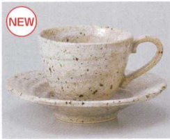
NEW 632-303-60 650円 砂丘 コーヒ-マグ (9.2×7-240cc) 663230360 10人 632-304-60 600円 砂丘 受皿 (15.3×3.4) 663230460