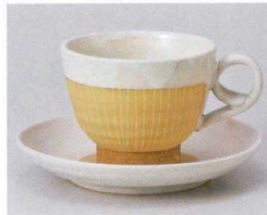
632-101-17 1,500円 かき落し黄コーヒ- C/S(皿14.3) 562440417 632-102-17 800円 かき落し黄コーヒ-碗 (8.8×7.2-210cc) 562440517