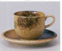
632-509-24 770円 信楽織部 C/S 562530924 632-510-24 480円 信楽オリハ碗丈 (8×6.5-190cc) 562531024