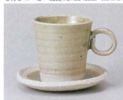
632-501-26 1,700円 ヒワ丸デミタスコーヒ- C/S (皿10.2) 562541026 632-502-26 1,000円 ヒワ丸碗丈 (8.5×8.5-100cc) 562541126