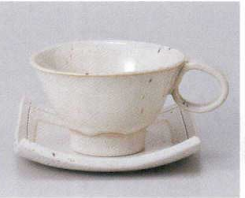
632-107-26 2,300円 乳白コーヒ-碗皿 (皿11.5×11.5) 562330326 632-108-26 1,300円 乳白コーヒ-碗 (9.2×5.7) 562330426