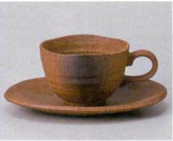
632-305-51 1,000円 赤信楽コーヒ- C/S (皿16×13) 562520151 632-306-51 600円 赤信楽コーヒ-碗丈 (8.3×5.8-170cc) 562520251