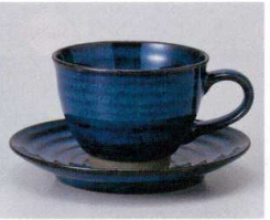
632-307-52 950円 土物都ナマコーヒ- C/S (皿14×2) 562521152 632-308-52 570円 土物都ナマコーヒ-碗丈 (9×6.5-210cc) 562521252