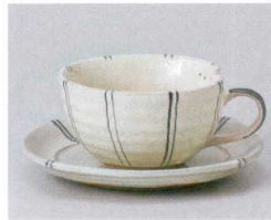
632-301-16 730円 二本十草スプカップ (10×5.5-240cc) 562360116 632-302-16 530円 二本十草スプカップ受皿 (15×15×2) 562360916