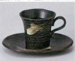
632-505-60 940円 天正黒波測反リコーヒ- C/S (皿16×12×1.6) 562530160 6人 632-506-60 440円 天正黒波測反リコーヒ-カップ丈 (8.7×5-150cc) 562530260 10人