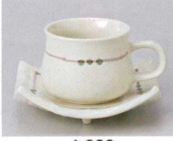
632-203-52 1,000円 粉引ヒスイ C/S (皿11.5×11.5) 562520352 632-204-52 500円 粉引ヒスイコーヒ-碗丈 (6.8×5.5-130cc) 562520452