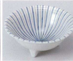
64-603-33 520円 京十草三ツ足3.8小鉢 (11.5×5) 506950533