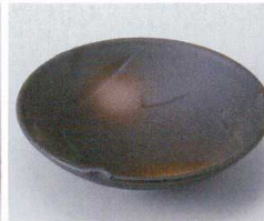
64-303-2 550円 備前風平小鉢 (12×3.5) 506910302