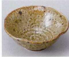
64-502-47 530円 田園オリベ花型小鉢 (12×12×5) 506930447