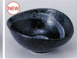
64-505-35 520円 黒水晶 楕円小鉢 (13×11.2×5.5) 606450535