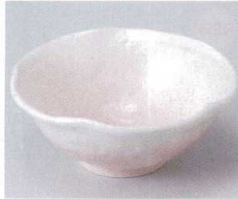
64-601-73 530円 桜志野花型小鉢 (12×5) 506840173