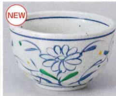
64-402-35 540円 粉引釉手描花ゆらぎ削り型3.5深口小鉢 (10.6×6.5) 606440235