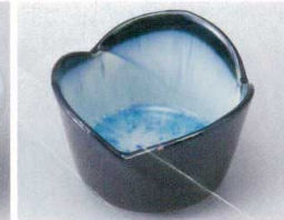
64-105-47 560円 清流水天目三ツ山小鉢 (9×9×6.3) 506850547