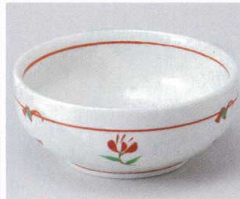
64-302-47 560円 粉引釉赤絵なごみ3.5ボール (10.7×4.5) 506860147