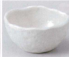
64-103-47 560円 白萩タラ小鉢 (10×5) 506850347