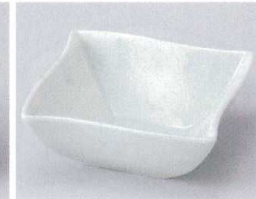
64-305-78 550円 ウェーブ角小鉢 (10.3×10.3×4) 506910478