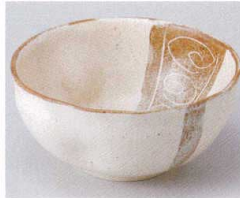
64-102-17 550円 三ツ押し鏝絵3.3小鉢 (10×4.8) 506910517