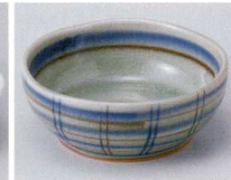
64-405-74 530円 御深井波湖3.5小鉢 (9.8×3.8) 506920574