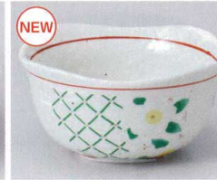
64-204-35 560円 粉引釉緑格子山茶花四角3.8小鉢 (11×11×6) 606420435