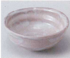
64-101-74 560円 桜釉浅小鉢(小) (10.5×4) 506850474

蓋物 刺身 向付 中鉢 小鉢 小付 珍味 前菜皿 付出皿 焼物皿 天皿 香水玉割 蓋碗 小皿 和皿 多用皿 和風パスタ 多用鉢 盛込鉢 盛込皿 酒器 フリーカップ そば用品 めん皿 井 多用井 茶漬碗 飯碗 土瓶 ポット 急須 湯呑 干茶 卓上小物 カスター 箸置 レンゲ スプーン 灰皿