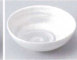
64-605-31 520円 グレー刷毛目楕円平鉢 (13×12×4.5) 506950131