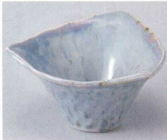
64-201-16 560円 白ナマコ三角デザート鉢 (12.2×12.2×6.8) 506850216