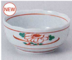
64-301-47 560円 青磁手描風赤絵花型小鉢 (11×5) 606430147