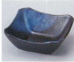
64-501-73 540円 青雲角小鉢 (9.8×9.8×4) 507160473