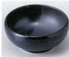
64-202-34 550円 夜宙4.2ボール (13×5.5) 506910134