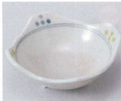
64-401-73 540円 萩風早春角3.5浅鉢 (9.8×9.5×3.8) 506920473