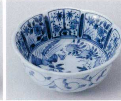
64-504-34 530円 花鳥雪輪型3.6小鉢 (12×4.5) 506930234