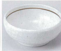
64-203-25 550円 粉引ライン4.2ボール (13×5.6) 506910225