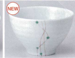
64-205-33 550円 芽吹き3.2小鉢 (10.2×6.5) 606420533