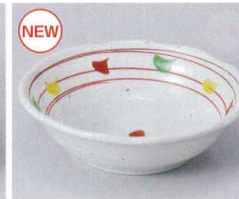
64-404-47 520円 粉引赤絵千鳥4.0鉢 (13.6×4) 606440447