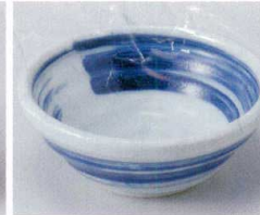
64-104-25 560円 ゴス刷毛玉濁小鉢 (11.8×4.8) 506860225