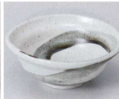
64-403-51 480円 マツト滴なぶり小鉢 (11.5×4.5) 606440351