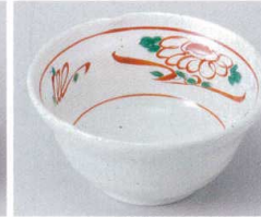
64-604-47 520円 粉引手描風赤絵3.3小鉢 (11×5.5) 506940247