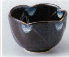
64-503-31 530円 天目流し梅型小鉢 (9.5×6.2) 506930131