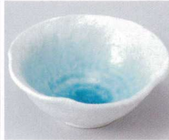
64-602-79 500円 白流水花型小鉢 (12×12×4.8) 506940577