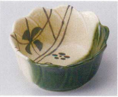
65-502-5 500円 オリベ風車小鉢 (10×4.5) 506960305