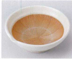
65-104-47 520円 白マット3.6スリ平小鉢 (11.8×11.5×4.3) 506950447