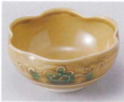
65-205-5 500円 黄瀬戸花型小鉢 (10×4.5) 507010405