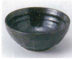
65-201-34 520円 黄河4.5浅鉢 (12.8×5.3) 507040134