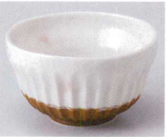
65-603-35 480円 御本手紅吹角4.0小鉢 (10.7×10.7×6.3) 507050235