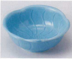
65-303-73 500円 ブルー梅小鉢 (11.5×11.2×4.5) 507020473