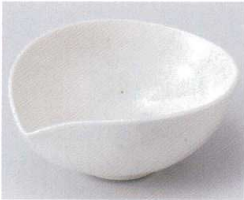
65-404-11 500円 白砂花びら小鉢 (12×10×4.7) 507020111