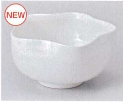
65-203-2 500円 白釉花型小鉢 (9.5×5.5) 606520302