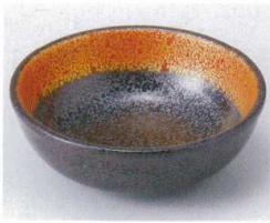
65-304-35 500円 金彩茶結晶3.5ボール (11.5×4) 507020235