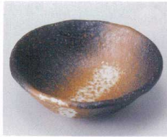
65-105-73 500円 黒備前3.8小鉢 (11.5×4) 506920273