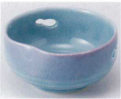
65-504-1 500円 ヒスイ貫入スカシ小鉢 (11.5×6) 507010101