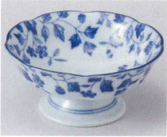
65-402-40 500円 あつみ野高台デザート (12×5.8) 507050440