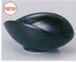
65-301-2 500円 ゆず黒まゆ型小付 (13×8×5.3) 606530102