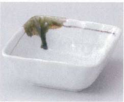
65-505-79 500円 志野茶ライン3.6角小鉢 (10.3×10.3×4.2) 507020379