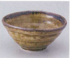
65-605-57 490円 古瀬戸変形4.0鉢 (12×12×5.6) 507110957