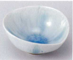
65-604-35 480円 岩清水楕円小鉢 (13×11.2×5.3) 507040535