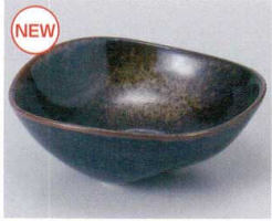
65-401-35 500円 油滴結晶4.0鉢 (13×5) 606540135