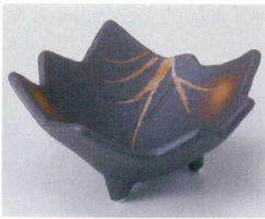
65-305-40 500円 楓水晶三ツ足小鉢 (11.5×12×5.8) 507010540