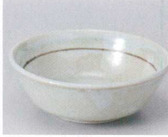
65-102-73 520円 白タタキ玉割 (11.4×4.1) 606510273