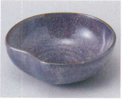
65-601-35 500円 青うのふなぶり小鉢 (11.5×11.3×4) 507010335