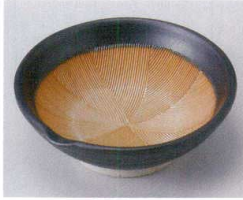
65-103-47 520円 黒マット3.6スリ平小鉢 (11.8×11.5×4.3) 506950347