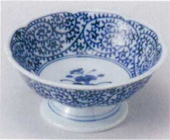
65-403-40 500円 四季高台デザート (12×5.8) 507050340