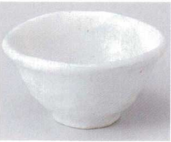
65-503-62 500円 白釉手作り風3.5小鉢 (11×10.5×5.8) 507010262