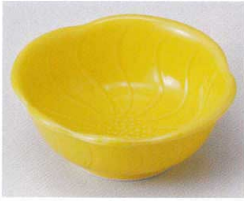
65-302-73 500円 イエロー梅小鉢 (11.5×11.2×4.5) 507020573