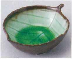
65-501-15 500円 南蛮木ノ葉型小鉢 (12×9.5×4) 507030115