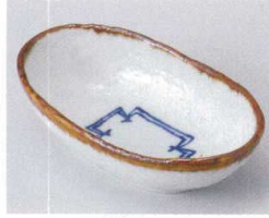
65-101-30 520円 灰釉染付舟型鉢(小) (14.6×8.8×4.1) 506950230