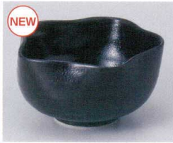
65-204-2 500円 ゆず黒花型小鉢 (9.5×5.5) 606520402