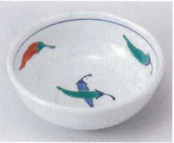
65-602-78 480円 赤絵とうがらし3.5ボール (11.5×4) 506920378