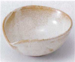
65-405-11 500円 ゴマ風味花びら小鉢 (12×10×4.7) 507030211