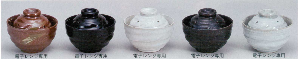
656-101-60 1,400円 鉄赤 炊飯茶碗(0.5合)レシピ付 (13.2×10.7) 564910360 1入 656-102-60 1,400円 天目 炊飯茶碗(0.5合)レシピ付 (13.2×10.7) 564910460 1入 656-103-60 1,400円 粉引 炊飯茶碗(0.5合)レシピ付 (13.2×10.7) 564910560 1入 656-104-51 1,350円 天正黒 レンジ0.5合炊き (13.2×10) 564910151 1入 656-105-51 1,350円 青磁刷毛 レンジ0.5合炊き (13.2×10) 564910251