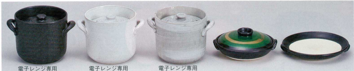
656-201-60 2,150円 天正黒 炊飯鍋(1合)レシピ付 (17.5×13.2×11.8) 564920460 1入 656-202-60 2,150円 粉引 炊飯鍋(1合)レシピ付 (17.5×13.2×11.8) 564920560 1入 656-203-51 2,150円 青磁ハケ 炊飯鍋(1合) (17.5×13.2×11.8) 665620351 1入 656-204-34 3,750円 緑金刷毛目浅鍋 (15×16.5×6.5) 564810334 656-205-34 1,660円 耳付陶板 (17.2×3) 564730534