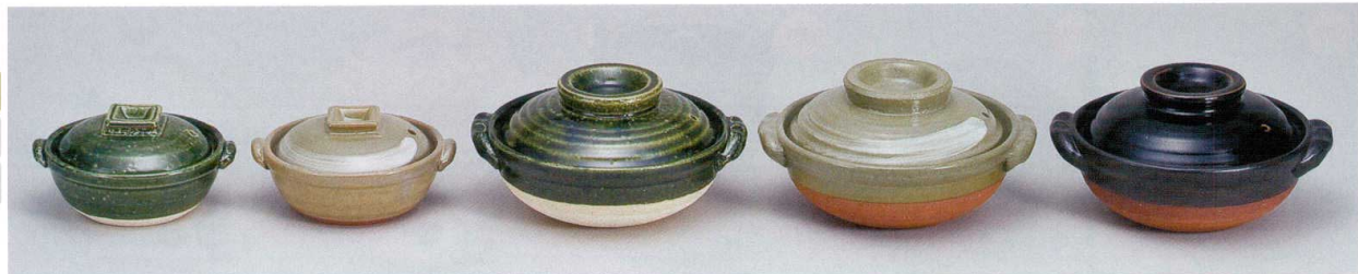
656-401-81 2,200円 織部4.0鍋(13.5×12×7.5) 564830181 656-402-81 2,200円 京風刷毛目4.0鍋(14×12.5×7.5) 564830281 656-403-81 2,600円 織部5.5鍋(19×17×9) 564850781 656-404-81 2,100円 織部5.0鍋(17×15×8.5) 564850881 656-405-81 2,600円 京風刷毛目5.5鍋(19×17×9) 564850581 656-406-81 2,100円 京風刷毛目5.0鍋(17×15×8.5) 564850681 656-407-81 2,600円 ゆず天目5.5鍋(19×17×9) 564850381 656-408-81 2,100円 ゆず天目5.0鍋(17×15×8.5) 564850481