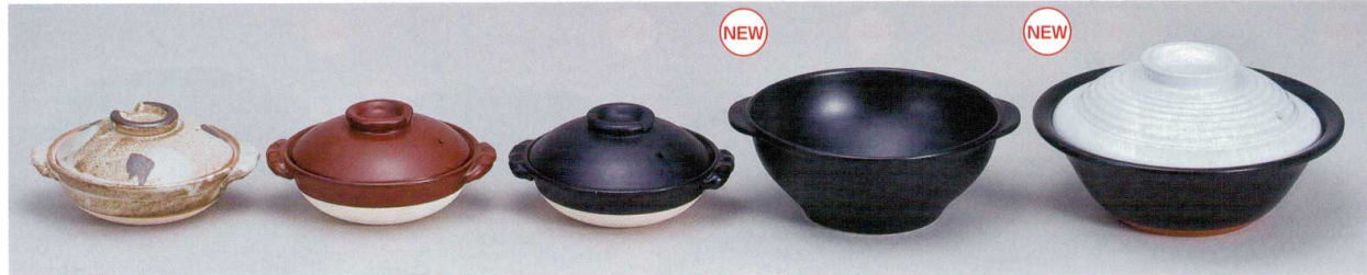
656-501-84 2,800円 ムサシノ5.0鍋 (18×15.5×8) 564820184 656-502-84 2,600円 鉄赤5.0鍋 (18×15.5×8) 564820284 656-503-84 2,600円 クロ5.0鍋 (18×15.5×8) 564820384 656-504-84 2,300円 耐熱(BK)アジアンボール (23×20×8) 665650484 656-505-84 3,300円 耐熱煮込ラーメン丼 (24.5×12.5) 665650584