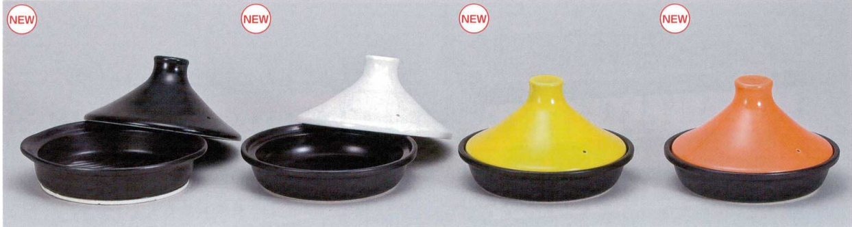
662-101-82 25,000円 IHマジカル7号タジン鍋 (21.5×14) 666210182