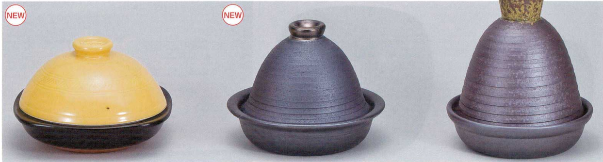
662-401-84 3,800円 銀峯2人用無水鍋(25×22×14cm) 666240184 662-402-84 2,600円 銀峯1人用無水鍋(22×18.5×12.5cm) 666240284