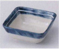
67-204-74 430円 測ライン角小鉢 (10.5×10.5×4.4) 507150274