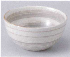
67-302-78 420円 粉引ハケメボール小 (10.3×5) 507210578