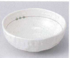
67-305-52 420円 粉引ヒスイたわみ4.0鉢 (12×4.8) 507220252