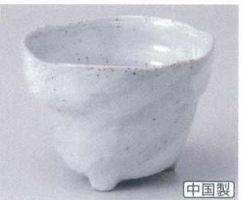
67-405-63 400円 粉引三ツ足小鉢 (10×7.2) 507160563