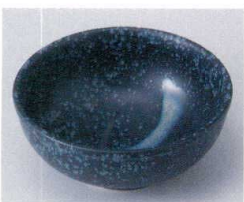
67-601-62 400円 銀彩黒玉測4.0ボール (13×5) 507230562