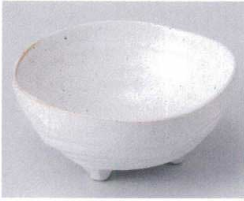
67-203-58 430円 白マット足付小鉢 (12.7×6) 507210258