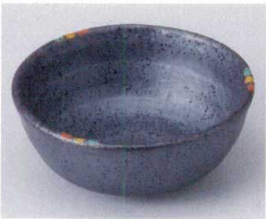
67-303-58 420円 点あそび丸小鉢 (11.4×4.5) 507220158