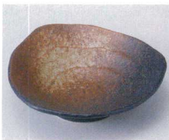
67-501-15 400円 黒備前三角4.0浅鉢 (13.3×4) 507230315