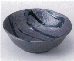
67-104-47 440円 黒織部流し4.0小鉢 (12×4) 507060447