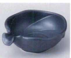
67-603-52 400円 黒マット片口小鉢 (12.3×11×4.5) 507240152