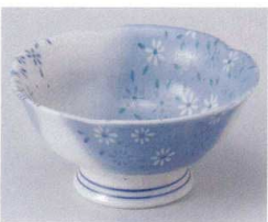
67-502-40 400円 金彩桜高台デザート(BL) (12×6) 507230240