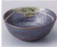
67-101-58 450円 鉄釉一珍ライン玉割小鉢 (10.5×4.5) 507140458