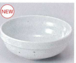
67-505-15 400円 スタック小鉢 さざ波白 (11.7×4.4) 606750515