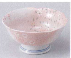
67-503-40 400円 金彩桜高台デザート(PK) (12×6) 507230140