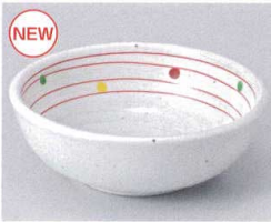
67-402-47 420円 刷毛目水玉3.5ボール (11.6×4) 606740247