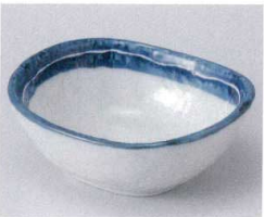
67-105-58 430円 測ライン3.6小判小鉢 (11.6×10×4.5) 507160158