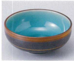
67-301-40 430円 エメラルド4.0多用鉢 (12×5) 507150440