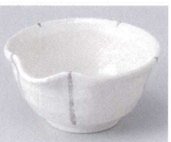
67-504-35 400円 粉引片口3.5鉢 (10×10.6×5.2) 507220535