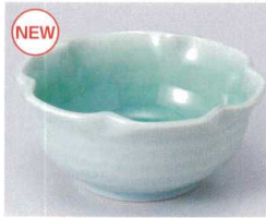
67-401-35 420円 青磁内グリーンうず小鉢 (10.8×4.8) 606740135