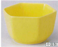
67-102-57 450円 黄釉六角小鉢 (9.5×8.5×5.4) 507120157