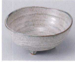
67-201-58 430円 結晶マット足付小鉢 (12.7×6) 507210358