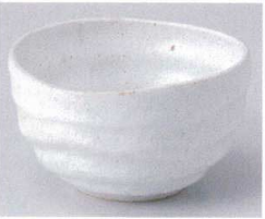
67-205-58 430円 六兵衛玉割小鉢クリーム (10.7×6.5) 507140258