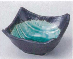
67-403-47 400円 深海グリーン四角小鉢(中) (10.3×10.3×5.5) 507150147