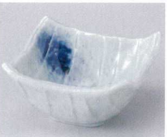
67-404-58 400円 墨吹角小鉢(大) (10×10×5.3) 507220458