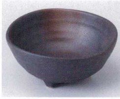
67-202-28 430円 黒備前4.0三ツ足小鉢 (13×6) 507210128