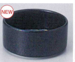
67-605-25 390円 黒耀10cm浅型スタック鉢 (10.1×4.7) 606760525