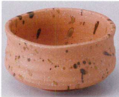
67-103-24 440円 美濃伊賀抹茶型小鉢 (10×5.5) 507140324