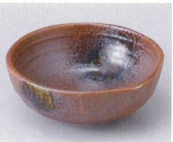
67-304-52 420円 ふる里たわみ4.0鉢 (12×4.8) 507220352