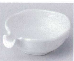
67-602-52 400円 白マット片口小鉢 (12.3×11×4.5) 507240252