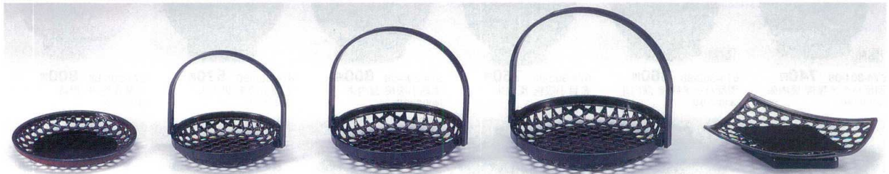
659-301-98 730円 丸かご目籠 溜塗 (φ16.5×2.0)