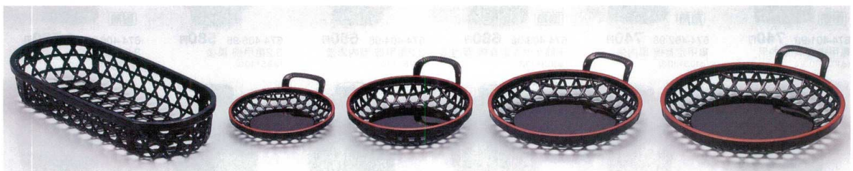
659-401-98 1,100円 8.5アミ目籠 溜塗 (24.7×11.0×4.6)