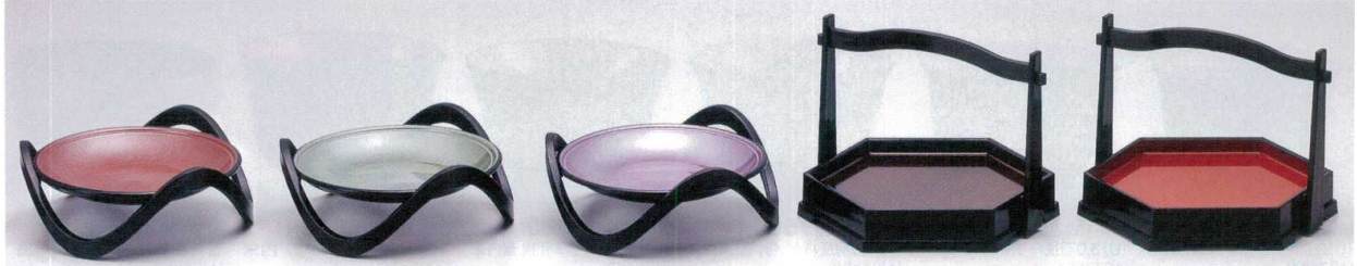
659-101-98 2,550円 元禄深皿 雲流塗(レッド) (足:黒乾漆塗) (17.5×7.0)足