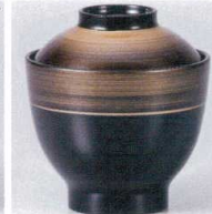
675-105-98 2,100円 福型小吸椀 黒/金かすり 内黒 (8.3×9.0)