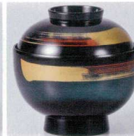
675-204-98 2,700円 小丸椀 黒 色一筆 (10.2×9.7)