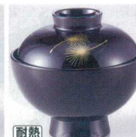
675-406-98 2,450円 3.7仙才丸椀 溜内黒 飛花 (φ11.3×10.2)