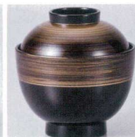
675-304-98 1,950円 3.2 福寿小吸椀 黒/金かすり 内黒 (9.7×10.0)