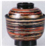
675-202-98 2,350円 3.5 乱筋羽反小吸椀 朱/金カスリ 内黒 (9.9×9.8)