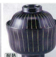
675-504-98 3,150円 3.5 布袋吸物椀 黒十草 (φ10.4×10.2)