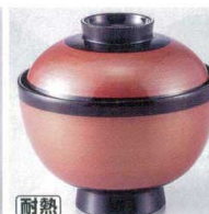
675-303-98 2,300円 隅丸椀 金カスリ(朱)フチ黒 内黒 (φ10.2×9.8)