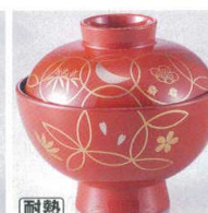
675-505-98 2,800円 3.7仙才椀 朱内黒 七宝 (φ11.3×10.2)