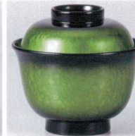
675-104-98 1,700円 3.3羽反吸椀 水産塗(グリーン)/黒ホカシ 内黒 (10.0×9.1)