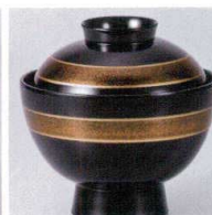
675-302-98 2,100円 3.5 小吸椀 梨子地帯 内黒 (10.5×10.5)