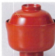
675-301-98 1,600円 3.5 布袋吸物椀 朱内黒 松葉 (10.4×10.2)