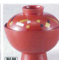
675-603-98 2,100円 3.8仙才椀 朱内黒 契り色紙 (φ11.3×10.2)