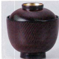
675-101-98 1,850円 3.0 捻り小吸椀 溜内黒 珴内金 (8.9×9.2)

耐熱 洗浄機にご使用いただけます。[H.S.P加工] 傷復元、汚れ防止予防加工。