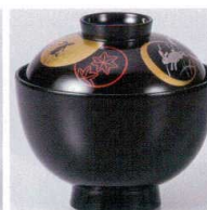
675-403-98 3,600円 隅丸椀 黒 月にうさぎ (10.3×9.8)