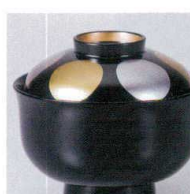
675-601-98 3,350円 天平椀 黒 日月 ツマミ内金 (11.3×9.3)