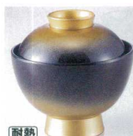
675-401-98 1,650円 3.5小吸椀 金ぼかし 内黒 (φ10.5×10.5)