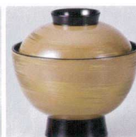
675-402-98 1,900円 3.5小吸椀 ベージュ/金かすり 内黒 (10.5×10.5)