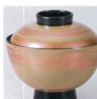
675-501-98 2,100円 3.8 京型椀 ベージュ/茜カスリ 内黒 (11.2×9.9)