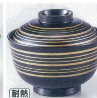
675-306-98 1,800円 3.5千鳥椀 金口クロ塗 内黒 (φ10.5×8.7)