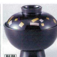
675-602-98 2,100円 3.8仙才椀 黒 契り色紙 (φ11.3×10.2)