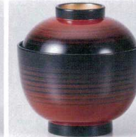
675-106-98 2,100円 3.1 兎小吸椀 朱カスリ ツマミ内金 内黒 (9.3×9.3)