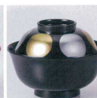
675-606-98 3,300円 羽反吸物椀 黒 日月 (12.0×8.7)