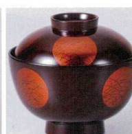
675-502-98 3,000円 新越前椀 日月露草 (白埴) 内黒 (11.0×9.8)