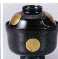
675-503-98 2,900円 3.5 布袋吸物椀 黒 つぼぽ(金) (10.4×10.2)