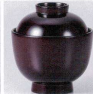
675-103-98 1,500円 3.0卵椀 溜内黒 (9.2×9.8)