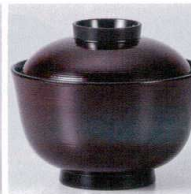
675-203-98 1,650円 3.5千鳥椀 タケハメ 内黒 (φ10.5×8.7)