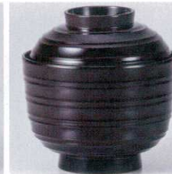
675-205-98 1,050円 3.0 胸筋小吸椀 溜内朱 (9.3×9.8)