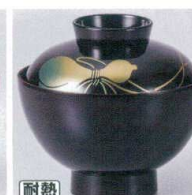
675-506-98 2,200円 3.8仙才椀 溜内黒 ひょうたん (11.3×10.2)