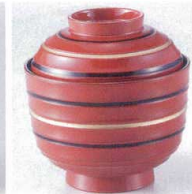
675-206-98 1,150円 胸筋小吸椀 朱内黒 黒ひも (φ9.3×9.8)