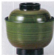
675-201-98 2,500円 3.5 乱筋羽反小吸椀 グリーン研出しホカシ (9.9×9.8)