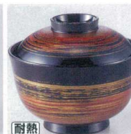
675-305-98 2,700円 3.5千鳥椀 セタ子塗り 内黒 (φ10.5×8.7)