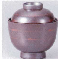
675-102-98 2,400円 3.0卵椀 パールカスリ根来 内黒 (9.2×9.8)