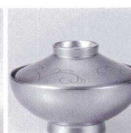
675-604-98 4,850円 平富士吸物椀 華秀塗(シルバー) 唐草 (12.0×8.0)