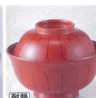
675-605-98 3,950円 羽反吸物椀 洗朱 割菊 (φ11.9×8.6)