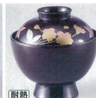
675-405-98 2,500円 3.5小吸椀 溜内黒 春秋 (φ10.3×10.2)