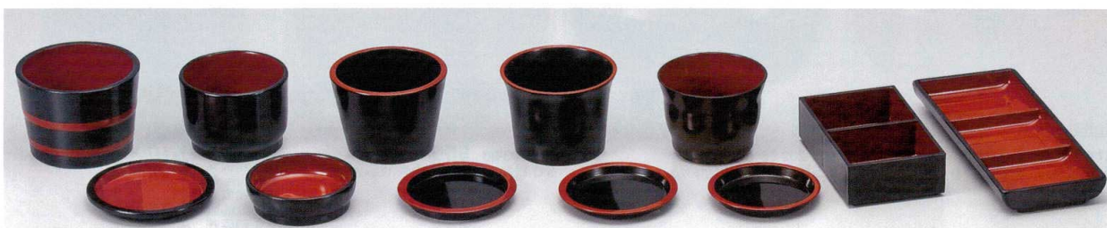
678-201-98 880円 桶型つゆ入れ黒朱帯び内朱(セット) (φ9.5×7.2) 678-202-98 1,000円 竹筒つゆ入れ黒天朱(セット) (φ8.2×7.4) 678-203-98 900円 丸ツユ入れ 黒内朱(セット) (φ8.8×6.5) 678-204-98 830円 羽反つゆ入れ黒天朱(セット) (φ8.7×6.5) 678-205-98 750円 まゆ型つゆ入れ金パール内朱(セット) (φ8.2×6.4) 678-206-98 700円 薬味入黒内朱 (12.1×7.7×3.5) 678-207-98 1,050円 ヤクミ皿(角) 黒内朱 (20.5×8.0×2.0)