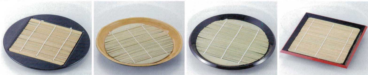
678-501-98 1,850円 8.0宴そば皿 黒石目塗(φ24.0×2.0) 678-502-98 460円 角竹ス(中)(15.5×15.5) 678-503-98 850円 白山そば皿 クリームハケメ塗(φ24.4×3.2) 678-504-98 460円 丸竹ス(φ19.5) 678-505-98 650円 布目丸そば皿 溜(φ23.2×2.9) 678-506-98 460円 丸竹ス(φ19.5) 678-507-98 650円 布目丸そば皿黒天朱(21.0×21.0×3.0) 678-508-98 460円 角竹ス(17.2×17.2)