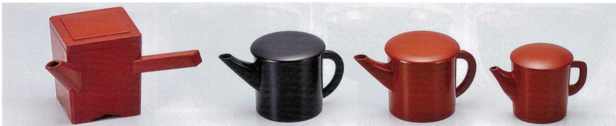
678-101-98 7,000円 角湯筒朱塗(10.0×10.0×12.5) 678-102-98 2,800円 丸湯筒(中) 黒塗(φ10.6×10.5) 678-103-98 2,800円 丸湯筒(中) 朱(φ10.6×10.5) 678-104-98 1,900円 丸湯筒(小) 朱(φ8.5×10.0)