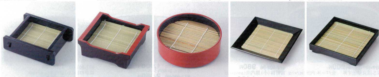
678-401-98 2,150円 一口セイロ溜塗(16.7×15.0×5.3) 678-402-98 390円 角竹ス(小)(11.5×11.5) 678-403-98 1,500円 4.8貴舟セイロタメパール天朱(14.5×13.0×5.3) 678-404-98 390円 角竹ス(小)(11.5×11.5) 678-405-98 780円 ミニ丸ザル朱(φ14.0×4.5) 678-406-98 420円 丸竹ス(小)(φ13.5) 678-407-98 1,550円 千筋四方皿 溜(三里塗)(23.8×13.8×3.0) 678-408-98 460円 角竹ス(17.2×17.2)(17.2×17.2) 678-409-98 1,450円 6.0 宝祥皿(正角) 黒(19×19×3.8) 678-410-98 460円 角竹ス(17.2×17.2)(17.2×17.2)