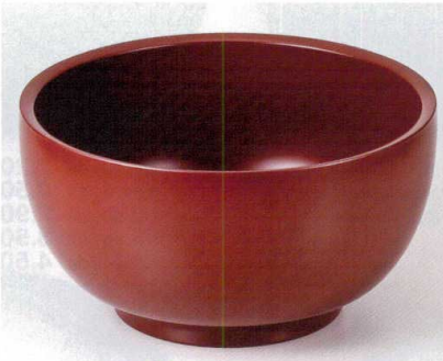
685-403-98 6,900円 8.0ワインクーラーボール 銀朱塗(24.7×13.3)