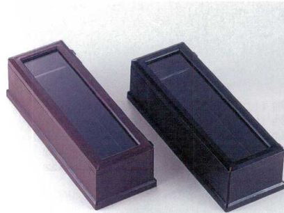
685-401-98 3,300円 ヘギ目箸箱 ウルミ(10.5×28.4×7.5) 685-402-98 3,300円 ヘギ目箸箱 黒(10.5×28.4×7.5)