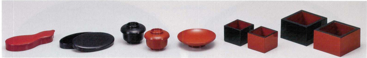
685-101-98 850円 ひさご楊枝入れ 朱塗 (13.5×5.5×2.2) 685-102-98 850円 新小判楊枝入れ 溜塗 (11.0×6.4×1.6) 685-103-98 800円 ミニ椀(大) 黒内朱(6.0×4.5) 685-104-98 800円 ミニ椀(大) 総朱(6.0×4.5) 685-105-98 650円 盃 朱 (φ9.2×2.3) 685-106-98 550円 ミニマス 黒内朱(5.2×5.2×4.0) 685-107-98 550円 ミニマス 朱天黒(5.2×5.2×4.0) 685-108-98 600円 一合マス 黒内朱(空洞)(8.0×8.0×5.0) 685-109-98 600円 一合マス 朱天黒(空洞)(8.0×8.0×5.0)