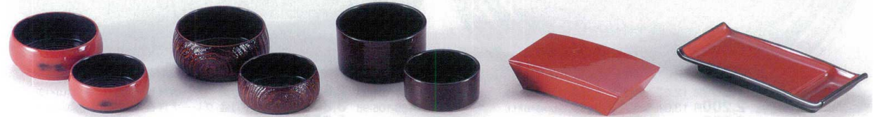
685-201-98 950円 福型ビール椀 根来(φ9.4×3.6) 685-202-98 750円 福型銚子椀 根来(φ8.0×3.1) 685-203-98 900円 3.2桐壺ビール椀 栃塗(φ9.5×4.0) 685-204-98 850円 2.6桐壺銚子椀 栃塗(φ7.8×3.0) 685-205-98 800円 3.0千筋櫛ビール椀 溜塗(φ9.0×4.9) 685-206-98 750円 2.5千筋櫛銚子椀 溜塗(φ7.6×3.2) 685-207-98 1,000円 舟型のり入れ 朱塗(13.2×7.3×3.2) 685-208-98 840円 貴舟のり入れ 朱天黒塗(17.9×8.3×2.2)