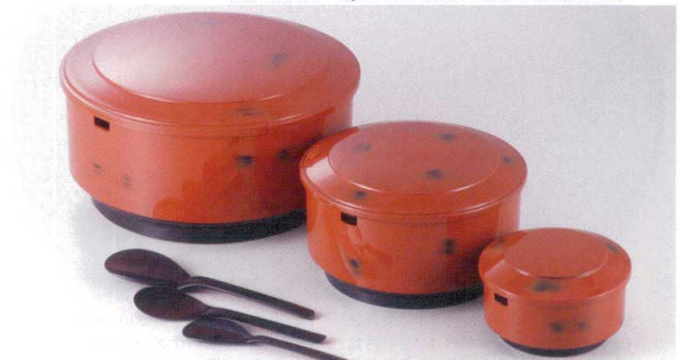
685-504-98 3,400円 2人飯器 根来 (杓子付)(φ17.2×10.4) 685-505-98 5,000円 3人飯器 根来 (杓子付)(φ21.6×12.2) 685-506-98 6,700円 5人飯器 根来 (杓子付)(φ25.8×13.7)