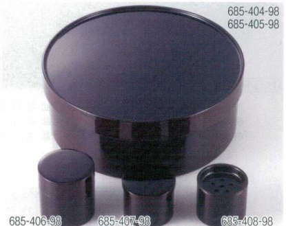
685-404-98 5,500円 10.5雅茶櫃 溜塗(内塗無)(φ32.6×12.7) 685-405-98 5,000円 9.0雅茶櫃 溜塗(内塗無)(φ27.0×11.7) 685-406-98 1,250円 雅茶筒 溜塗(小)(φ8.8×9.3) 685-407-98 1,000円 雅茶こし受け 溜塗(φ8.4×6.8) 685-408-98 1,000円 雅茶こぼし 溜塗(φ8.0×6.7)