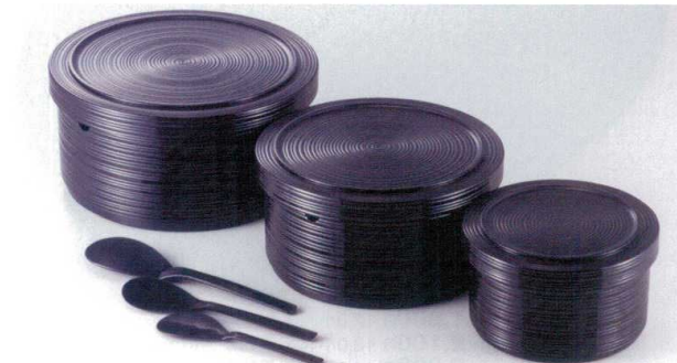
685-501-98 3,600円 乱筋飯器 (2人用) 溜 (杓子付)(φ17.4×9.8) 685-502-98 5,400円 乱筋飯器 (3人用) 溜 (杓子付)(φ23.2×11.3) 685-503-98 6,700円 乱筋飯器 (5人用) 溜 (杓子付)(φ26.3×12.7)