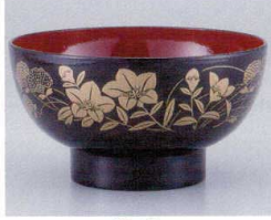
690-204-95 270円 溜 東型汁椀 新秋草 (11.5×6.3) 567620195