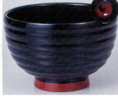
690-403-95 630円 食彩名人 なんと汁椀 (φ10.8×7.1) 669040395