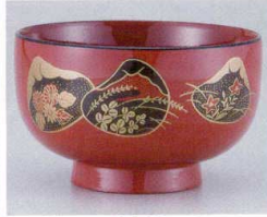
690-302-95 400円 朱宝寿椀貝合せ (10.6×6.6) 567620595