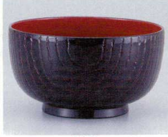
690-303-95 400円 溜 木彫ホテイ汁椀 (10.8×6.1) 567630295