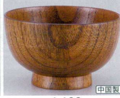
690-605-95 1,100円 [漆][木] ケヤキ 腰高汁椀 (11.5×6.8) 567660395