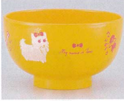
690-103-95 580円 子供汁椀テリアイエロー (10×5.8) 567610395