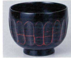
690-601-95 1,000円 [木][漆] ナタメ彫汁椀 曙 (φ10.2×8.3cm) 669060195