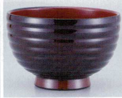
690-402-95 510円 溜 千駒筋汁椀 (10.8×7.1) 567640195