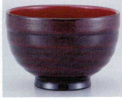
690-405-95 620円 赤 帯布目汁椀 (10.7×7) 567650195