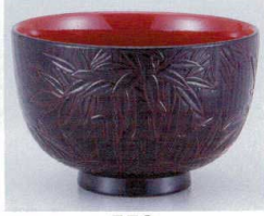
690-305-95 550円 溜 木彫竹林汁椀 (10.3×7) 567630495