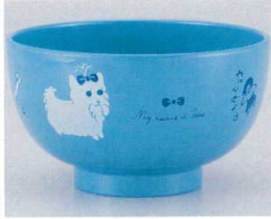
690-102-95 580円 子供汁椀テリアブルー (10×5.8) 567610295