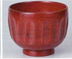
690-602-95 1,000円 [木][漆] ナタメ彫汁椀 根来 (φ10.2×8.3cm) 669060295