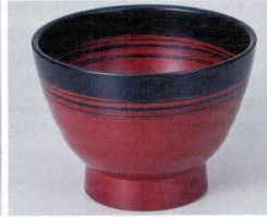
690-502-95 830円 朱潤黒 ひびき汁椀 (φ10.5×7.8) 669050295