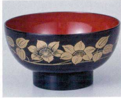
690-202-95 270円 黒 東型汁椀 鉄線 (φ11.5×6.3) 669020295