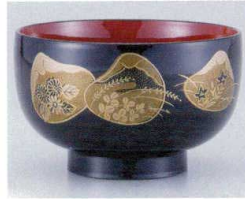
690-301-95 400円 黒宝寿椀貝合せ (10.6×6.6) 567620495