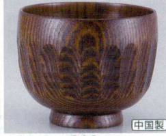
690-505-95 800円 [漆][木] ナタメ彫汁椀 スリ (10.2×8.3) 567660195