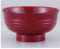
690-205-95 350円 チーク 羽反宝生汁椀 (11.7×6.3) 567620395