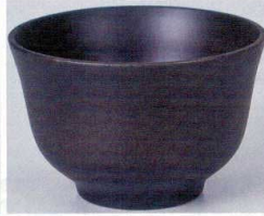
690-503-95 750円 [木] 黒 艶消羽反汁椀 (φ11×7) 669050395