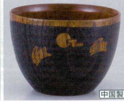
690-603-95 800円 [漆][木] はねうさぎ 汁椀 黒 (10×7) 567650495