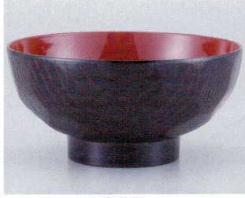
690-104-95 230円 溜 木彫亀甲汁椀 (11.8×6) 567610595