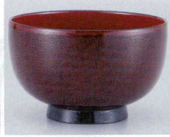
690-404-95 590円 栃 絹目汁椀 (10.8×6.7) 567640495