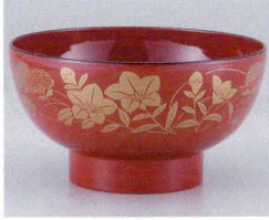
690-203-95 270円 朱 東型汁椀 新秋草 (11.5×6.3) 567620295