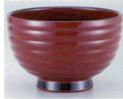
690-401-95 510円 朱 千駒筋汁椀 (10.8×7.1) 567640295