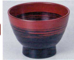
690-501-95 830円 黒潤朱 ひびき汁椀 (φ10.5×7.8) 669050195