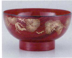
690-201-95 260円 チーク東型汁椀老松 (11.5×6.3) 567610495