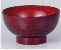
690-105-95 240円 チーク東型汁椀 (φ11.5×6.3) 669010595