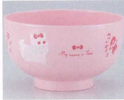
690-101-95 580円 子供汁椀テリアピンク (10×5.8) 567610195