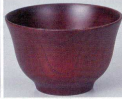
690-504-95 750円 [木] 茜 艶消羽反汁椀 (φ11×7) 669050495