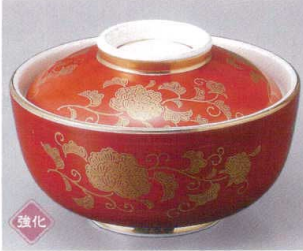
7-103-70 4,150円 赤巻唐草円菓子碗(11.5×7.8) 501520177