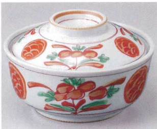
7-302-34 2,550円 乾山赤画煮物碗(13×8) 501530434