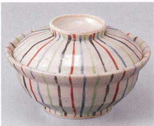
7-202-34 3,850円 土焼色十草小蓋物(11.5×7) 501510434