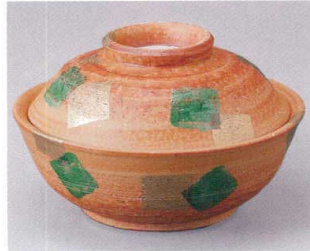
7-101-25 4,500円 金緑彩蓋向(13.3×8.3) 501510125