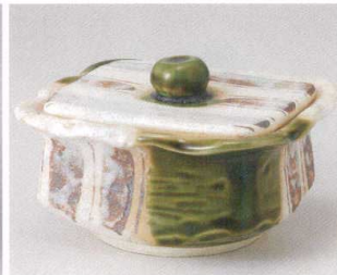
7-204-35 3,650円 織部筋長蓋向(12.6×11×7.5) 501220135