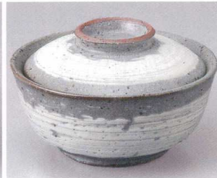
7-404-25 2,300円 粉引刷毛煮物碗(13.3×6.2) 501540325