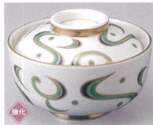
7-301-70 3,370円 金唐草円菓子碗(11.5×7.8) 501520471