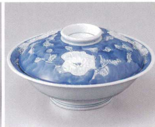
7-505-34 7,280円 一珍牡丹8.0骨むし(24.5×12) 501550534 7-506-34 4,980円 一珍牡丹7.0骨むし(21.5×10) 501550634