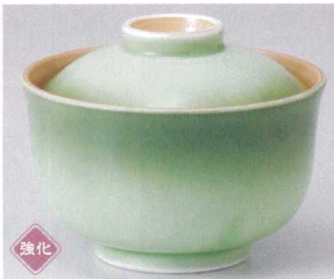
7-303-74 2,600円 緑彩円菓子碗(12.2×9.4) 501640374