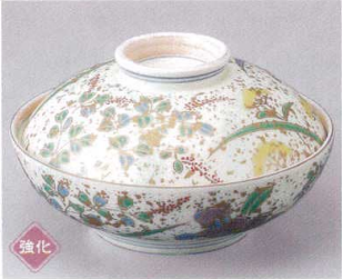
7-102-34 4,480円 金箔小花蓋向(13.7×8) 501510334