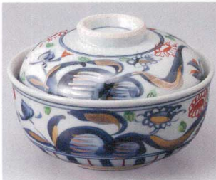
7-403-25 2,400円 古染万暦円菓子碗(13×9) 501540225