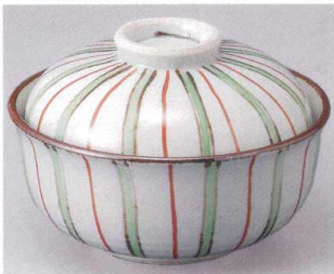
7-402-51 2,450円 色入十草円菓子碗(13×8.5) 501540151