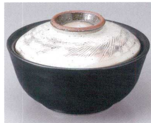
7-401-58 2,500円 粉引蓋向(14×8) 501530358