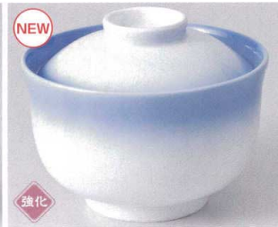
7-304-73 2,500円 コバルト円菓子碗(12.2×9.4) 600730473