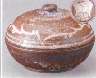
7-104-5 4,100円 紫志野蓋向(13.1×9) 501510205