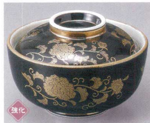
7-201-78 3,870円 黒金唐草円菓子碗(11.5×7.8) 501520278