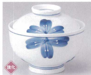
7-501-70 2,280円 一珍青花円菓子碗(12.3×10) 501650371