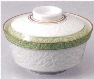
7-203-34 3,650円 高麗花彫煮物碗(12.5×9) 501520334