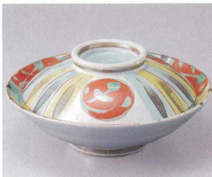
7-503-30 5,350円 十草赤丸紋骨むし(21.3×9) 501550330 7-504-30 3,350円 十草赤丸紋平蓋向(16.2×8.5) 501550430