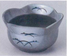
71-109-74 930円 銀彩つゆ草丸4.0小鉢 (11.2×6.3) 54091574 71-110-74 830円 銀彩つゆ草丸3.6小鉢 (9.3×6.2) 54091674