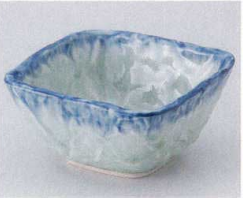
71-405-76 800円 御深井角小鉢大 (11.5×5.5) 507540076 71-406-76 650円 御深井角小鉢中 (10×5) 507540076 71-407-76 550円 御深井角小鉢小 (8.5×4.5) 507540076