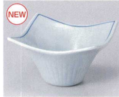
NEW 71-201-47 920円 測ライン花型小鉢(大) (10.8×10.8×6.5) 607120147 71-202-47 600円 測ライン花型小鉢(小) (8×8×5.5) 607120247