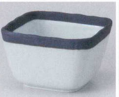
71-607-47 750円 桃山石目四角小鉢(大) (9×9×5.8) 607160747 71-608-47 600円 桃山石目四角小鉢(小) (8×8×5.8) 607160847