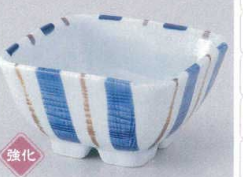
強化 71-310-78 810円 青地十草角小鉢(大) (9.8×9.8×5.5) 507530978 71-311-78 630円 青地十草角小鉢(小) (8.2×8.2×5.1) 507531078