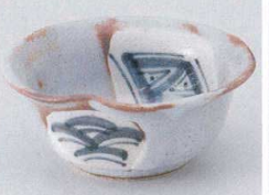
71-507-26 750円 染付志野中鉢 (13×5.5) 507540626 71-508-26 700円 染付志野小鉢 (11×4.6) 507540726