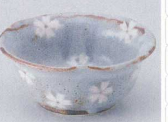
71-509-24 710円 胤志野桜4.2小鉢 (13×5.5) 507550924 71-510-24 660円 胤志野桜3.5小鉢 (11×4.8) 507551024