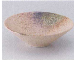
71-101-47 980円 伊賀織部石目丸小鉢(大) (11.3×3.4) 507510547 71-102-47 650円 伊賀織部石目丸小鉢(小) (8.5×2.9) 507510647