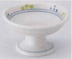
71-205-73 900円 萩風早春高台小鉢(大) (11.4×6.4) 507520173 71-206-73 680円 萩風早春高台小鉢(小) (9.8×5.7) 507520273