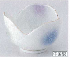
中国製 71-408-61 880円 三色吹測金割山椒小鉢(大) (9×6) 507530161 71-409-61 620円 三色吹測金割山椒小鉢(小) (7×5.3) 507530261