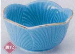
強化 71-303-78 860円 測金トルコ葉型小鉢(大) (10×5) 507530577 71-304-78 800円 測金トルコ葉型小鉢(小) (8.6×5.2) 507530677