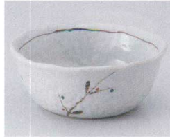
71-401-74 800円 志野芽生小鉢(大) (11×4.2) 507530774 71-402-74 670円 志野芽生小鉢(小) (9.7×4.5) 507530874