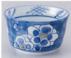
71-601-73 750円 夕ミ檜梅4.0小鉢 (11.2×6.3) 507550173 71-602-73 670円 夕ミ檜梅3.5小鉢 (10×5.6) 507550273