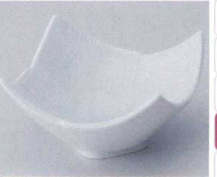
71-209-5 880円 青磁筋入り4.5鉢 (13.8×13.8×5.3) 507520305 71-210-5 750円 青磁筋入り4.0鉢 (11×11×6) 507520405