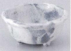
71-305-51 850円 化粧刷毛三つ足4寸鉢 (12.8×5) 507530591 71-306-51 750円 化粧刷毛三つ足3.8寸鉢 (11.2×5) 507530651 71-307-51 670円 化粧刷毛三つ足珍味鉢 (10×4.7) 507530751