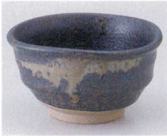
71-103-24 970円 燻三角小鉢中 (10.5×5.5) 507510724 71-104-24 630円 燻三角小鉢小 (9×4.8) 507510824