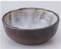
71-603-73 740円 備前志野4.0小鉢 (12.2×4.3) 507550373 71-604-73 700円 備前志野3.5小鉢 (11×4.2) 507550473