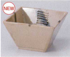
NEW 71-203-2 900円 オリベ渡しスリ付角小鉢(大) (11×11×6.5) 607120302 71-204-2 750円 オリベ渡しスリ付角小鉢(小) (9.5×9.5×5) 607120402