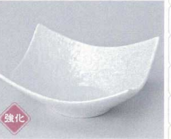
強化 71-410-70 800円 白磁石目型角小鉢(大) (9.8×9.8×4) 607141070 71-411-70 530円 白磁石目型角小鉢(小) (8.2×8.2×3.5) 607141170