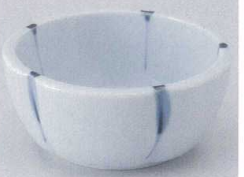
71-308-5 820円 古染3.0鉢 (10.2×4.5) 507530305 71-309-5 560円 古染2.5鉢 (8×3.5) 507530405