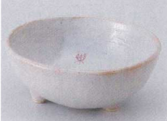
71-503-70 790円 刷毛目薬三つ足4.0小鉢 (12.2×11.3×4.8) 507540171 71-504-70 680円 刷毛目薬三つ足3.3小鉢 (10.2×9.5×4.1) 507540271