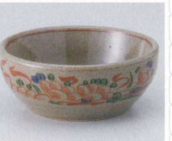
71-609-2 700円 菊絵3.5ボール (10.5×3.8) 507610502 71-610-2 550円 菊絵珍珠 (8.8×3.5) 507610602