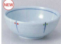
NEW 71-501-47 800円 色水玉4.0鉢 (12.3×5) 607150147 71-502-47 700円 色水玉3.5鉢 (10.8×4.2) 607150247