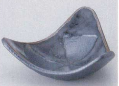
71-505-74 790円 黒志野三角小鉢(大) (11.5×11.5×4.5) 507540874 71-506-74 580円 黒志野三角小鉢(小) (9.8×9.8×4.5) 507540974