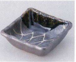
71-107-70 930円 掛アミ南蛮角小鉢(中) (10.5×10.5×4) 507520571 71-108-70 800円 掛アミ南蛮角小鉢(小) (9.4×9.4×4.5) 507520671