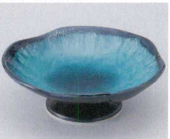
71-605-15 720円 ぎやまん高台皿(中) (13×4) 507550515 71-606-15 600円 ぎやまん高台皿(小) (11×4) 507550615