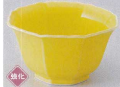
強化 71-301-70 870円 黄春八角小鉢(大) (10.2×5.6) 507520771 71-302-70 560円 黄春八角小鉢(小) (8.7×4.7) 507520871