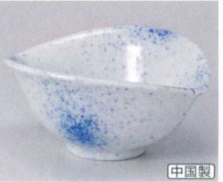
71-207-61 900円 吹墨笹形小鉢 中 (11.8×10.5×5.5) 607120761 71-208-61 720円 吹墨笹形小鉢 小 (10.3×9.3×5) 607120861