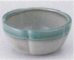
71-105-5 950円 青均窯3.0鉢 (10.2×4.5) 507510905 71-106-5 700円 青均窯2.5鉢 (8×3.5) 507511005