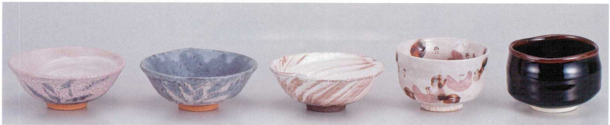
721-201-74 4,700円 桜志野平抹茶盆(木箱) (15.5×6) 570520174