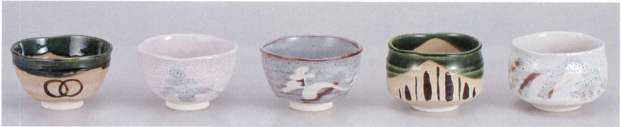
721-301-17 3,000円 オリベ井戸抹茶盆(トムソン箱) (13×8) 570530117