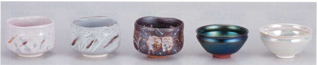
721-401-47 3,000円 桜志野抹茶盆(トムソン箱) (12×8) 570540447