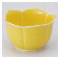
77-503-7 600円 黄桔梗型小付 (8.5×4.7) 508110607