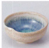
77-401-47 620円 オフケ3.0平鉢 (9.2×9.2×3.8) 607740147