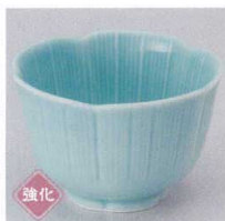
強化 77-602-7 580円 ヒスイ梅型小付(大) (8.5×5.5) 508130907 77-603-7 450円 ヒスイ梅型小付(小) (7.8×4.7) 508130907