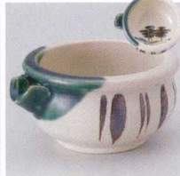
77-103-24 680円 織部流し片口珍珠鉢 (9.5×8.2×4.6) 508040224