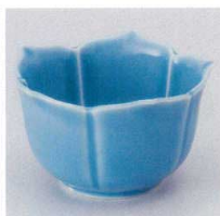
77-502-7 600円 トルコ桔梗型小付 (8.5×4.7) 508110507