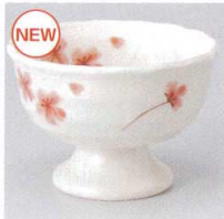
NEW 77-106-47 690円 花高台小鉢(ピンク) (9.4×6.5) 607710647