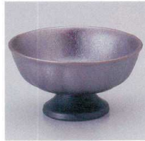
77-301-31 670円 赤金彩高台鉢(小) (9×4.8) 508050331