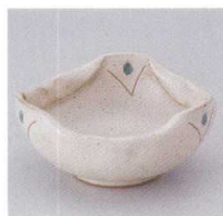
77-501-47 600円 白茶三ツ折小鉢 (10×10.2×4.8) 508120447