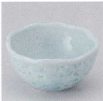
77-405-47 600円 青磁タタラ小鉢 (9.5×9.7×4.8) 508120347