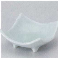
77-206-30 680円 ヒワ青磁ちぎり角小付 (9.5×9×3.5) 508110130