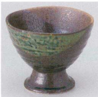
77-205-51 680円 織部スリ分高台小鉢 (9×7.2) 508050451