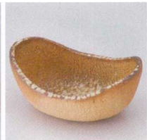
77-404-2 600円 土・炎槽円小鉢 (10.8×8×4.3) 508120202