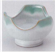
77-304-20 630円 ヒワ三ツ山珍珠入 (9×6) 508060420