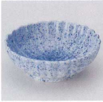
77-305-5 630円 吹墨菊型平鉢(小) (9.6×3.4) 508060605