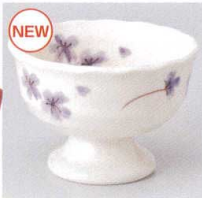
NEW 77-105-47 690円 花高台小鉢(紫) (9.4×6.5) 607710547