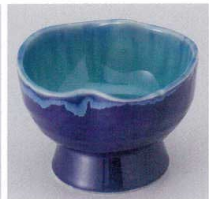
77-204-30 680円 ヒスイ紫新高台小鉢 (9×6.5) 508050630