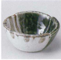
77-306-78 630円 織部ストライプ3.0丸小鉢 (9×3.8) 506730277