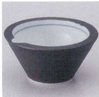
77-102-30 700円 黒伊賀片口小付 (9.3×4.7) 508030430