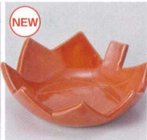
NEW 77-104-47 700円 ハツ手型小付(赤) (10.2×9.8×3) 607710447