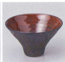
77-504-15 600円 高台反小付窯変朱赤 (10×5.8) 500710215