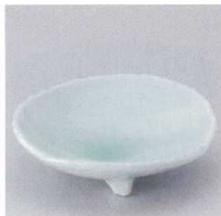
77-202-30 680円 ヒワ青磁ちぎり丸小付 (10×3) 508060530