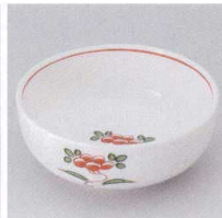
77-403-2 600円 NB赤絵丸小鉢 (10.1×4) 508120502