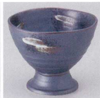
77-203-51 680円 鉄砂刷毛目高台小鉢 (9×7.2) 508050551