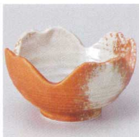
77-506-61 600円 あけぼの六衛小鉢(小) (9.2×5.1) 607750661