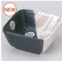
NEW 77-406-47 600円 黒結晶十草角小付 (8×8×4) 607740647