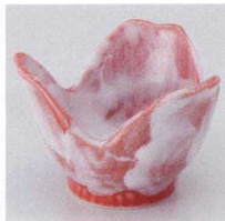
77-402-16 620円 赤彩花型珍珠 (8.5×6.4) 508110216