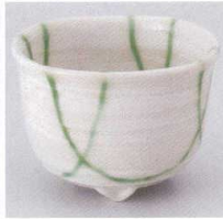
77-302-74 670円 志野格子三ツ足小付 (8.2×5.7) 508050274