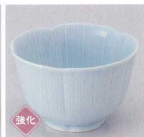
強化 77-606-7 580円 青磁梅型小付(大) (8.7×5.5) 508130407 77-607-7 450円 青磁梅型小付(小) (7.8×4.8) 508130507