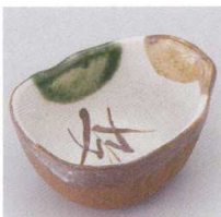
77-608-15 580円 織部志野石目小鉢 (10×7.3×5) 508130215