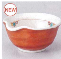
NEW 77-201-5 690円 赤巻色絵片口小付 (10.5×10.3×5) 607720105