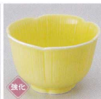
強化 77-604-7 580円 黄梅型小付(大) (8.7×5.5) 508130607 77-605-7 450円 黄梅型小付(小) (7.8×4.8) 508130707