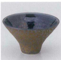
77-505-15 600円 高台反小付窯変ブルー (10×5.8) 508110415