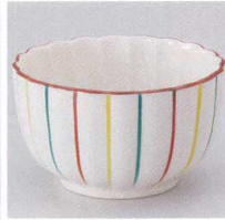
77-303-2 650円 色十草小付 (8.3×4.9) 508060102