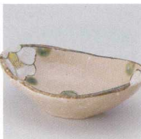
77-609-52 580円 織部椿舟型小付 (12×8×3.6) 508130152