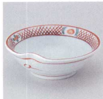
77-101-2 700円 赤絵小鉢 (10.5×3.5) 508030602