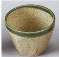
84-305-16 230円 七角唐津風小付 (7.2×5.5) 508750216