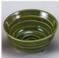
84-204-16 240円 オリベ三ツ足小付 (8.2×4) 508720316