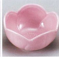
84-605-79 220円 ピンク梅小鉢 (7.7×4) 508630477