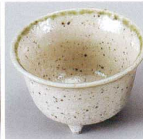
84-303-16 230円 グリーン梨地小付 (7.8×4.8) 508740116