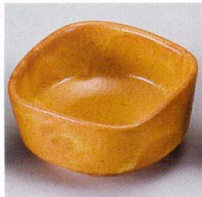
84-205-40 230円 赤志野角小鉢 (8×8×4) 508660240