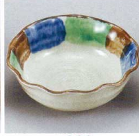
84-505-76 220円 菊形3色十草小鉢 (9.3×3.5) 508660576