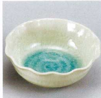
84-102-79 240円 花形小鉢 (9.5×3.2) 508630679