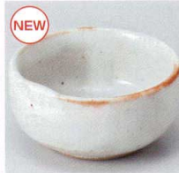
84-103-52 240円 白志野一押珍珠 (7.4×3.7) 608410352