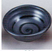
84-405-20 220円 黒うず豆鉢 (8.5×3.5) 508710220