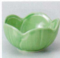
84-202-79 240円 ヒワ梅小鉢 (7.7×4) 608420279