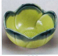
84-506-79 220円 ヒワ梅型小付 (7.7×4.2) 508630577