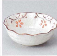
84-501-79 220円 ピンクはな花形小鉢 (9.3×3.5) 608450179