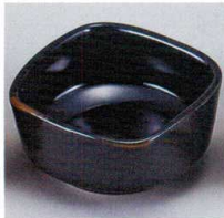
84-206-40 230円 天目角小鉢 (8×8×4) 508660340