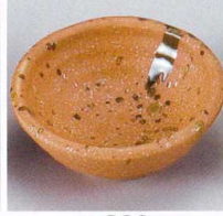
84-404-20 220円 織部吹豆鉢 (8.5×3.5) 508710320