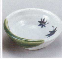
84-403-24 230円 紅葉豆鉢 (8.6×3.5) 508660624