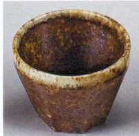
84-306-16 230円 七角茶マダラ小付 (7.2×5.5) 508750316