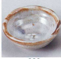
84-406-20 220円 鼠志野豆鉢 (8.5×3.5) 508710120