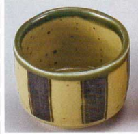
84-401-24 230円 太十草珍珠小鉢 (6.6×5) 508660124