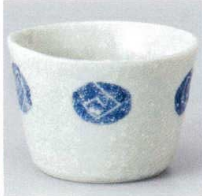
84-106-16 240円 藍水玉小付 (7.5×5) 608410616