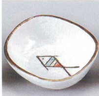
84-105-79 240円 野菜小判珍珠(金魚) (9×7.9×2.8) 508650279