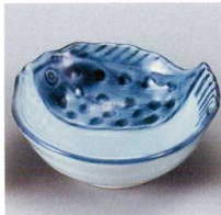
84-101-74 240円 古染ふぐ小付 (9×8.8×3.5) 508640374