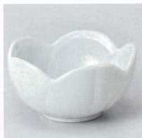
84-201-79 240円 白梅小鉢 (7.7×4) 608420179