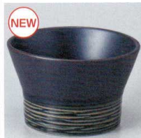
84-301-5 230円 黒釉グリーン小付 (8×5) 608430105