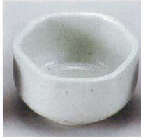
84-104-20 240円 梨地六角小鉢 (8×5) 508640520