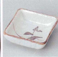
84-603-79 220円 ヨシ角千代口 (8×8×3) 608460379