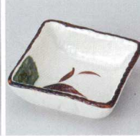
84-604-79 220円 オリベ笹角千代口 (8×8×3) 608460479