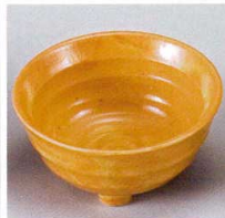
84-203-16 240円 赤志野三ツ足小付 (8.2×4) 508720216