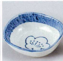
84-302-58 230円 梅小判小付 (7.8×9×3) 508650158