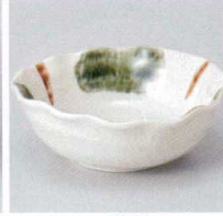
84-503-79 220円 オリベトクサ花形小鉢 (9.3×3.5) 608450379