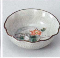
84-502-79 220円 桔梗花形小鉢 (9.3×3.5) 608450279