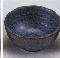
84-602-16 220円 黒イブシ3.0小鉢 (9.5×4.7) 508650516