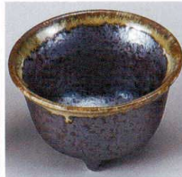
84-304-16 230円 茶イブシ小付 (7.8×4.8) 508740216