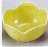
84-606-79 220円 黄小付 (7.7×4) 508630377