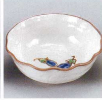
84-504-76 220円 菊形なすび小鉢 (9.3×3.5) 508660476