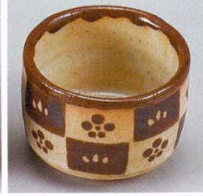
84-402-24 230円 格子梅珍珠小鉢 (6.6×5) 508650624