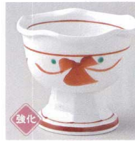
89-601-73 950円 赤絵小花高台珍味 (6.3×5.7) 508930373