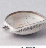
89-205-10 1,350円 粉引くし目片口珍味 (8.4×6.4×2.5) 509410610