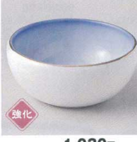
89-405-78 1,030円 淵金ブルー丸珍味 (7.2×3.3) 508940178