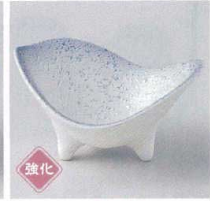
89-506-73 950円 ブルー吹ラスターニツ切珍味 (8×7×3.7) 508960173