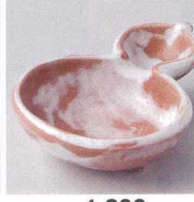
89-202-2 1,200円 赤染ひさご型珍味 (9.2×7.2×2.7) 508920102