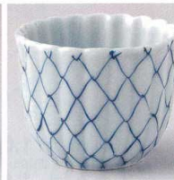
89-502-10 1,000円 アミ小付 (6×4.8) 608950210