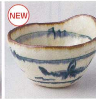
89-504-30 980円 御深井草紋変形珍味 (7×4.5) 608950430