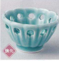
89-305-30 1,150円 深海青磁透し珍味 (7.2×4.5) 508930530