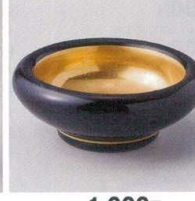
89-404-2 1,000円 瀬戸黒金平珍味 (6.8×2.5) 508940202