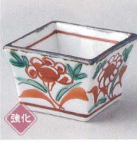
89-105-78 1,440円 赤絵角珍味 (4.8×3.3) 508910577