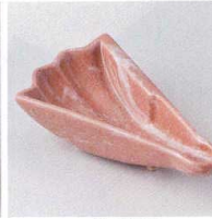
89-302-2 1,200円 赤染扇珍味 (6.5×11×2.5) 508920502