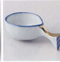
89-604-74 810円 ルリ金彩珍味 (10×5.5×3) 508940374