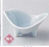
89-606-73 860円 青白磁ニツ切珍味 (8×7×3.7) 508950573