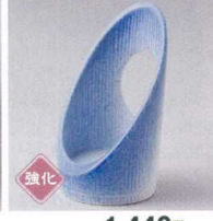
89-204-78 1,440円 吹墨竹筒珍味 (4.9×9.5) 508920478