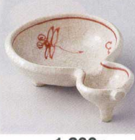
89-203-2 1,200円 とんぼひさご型珍味 (9.2×7.2×2.7) 508920202