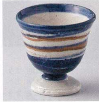
89-102-74 1,930円 赤染ワインカップ (5.5×5.3) 508910277