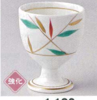
89-403-73 1,180円 金彩芦ワインカップ (4.8×6.1) 508930273