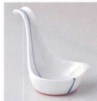
89-501-35 1,050円 呉須ラインレンゲ珍味 (10×6.3) 509430535