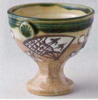
89-103-2 1,800円 平安織部高台珍味 (6.9×6.5) 508910302