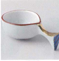
89-605-74 810円 朱金彩珍味 (10×5.5×3) 508940474