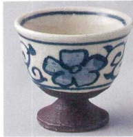
89-101-74 2,150円 安南花唐草ワインカップ (5×4.8) 508910177