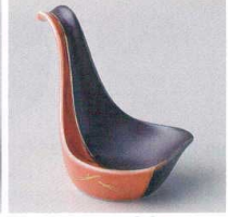
89-106-5 1,500円 塗分金松葉レンゲ珍味 (10.5×6.2×7) 508920305