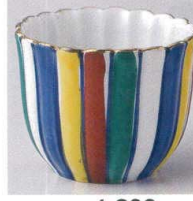
89-401-10 1,200円 色十草小付 (6×4.8) 508950110