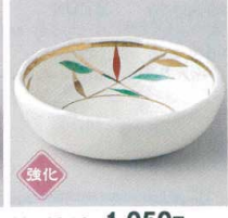
89-406-73 1,050円 金彩芦丸千代口 (7.7×2.1) 508940573