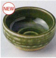
89-603-5 850円 織部小付 (7.3×3.2) 608960305