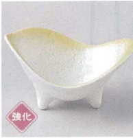
89-505-73 950円 黄吹ラスターニツ切珍味 (8×7×3.7) 508960273