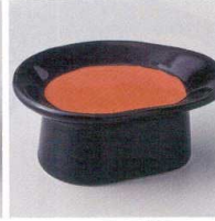
89-304-70 1,160円 塗分赤黒高台珍味 (9.2×7.3×3.9) 509420671