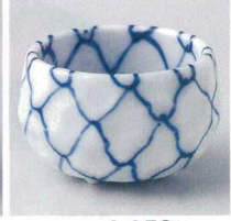
89-306-10 1,150円 アミニツ足珍味 (4.2×3) 508960310