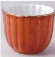
89-503-10 800円 朱ハケ小付 (6×4.8) 508950310