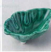
89-104-34 1,460円 緑交趾葉型珍味 (10.2×6.3×3) 508910434