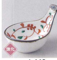
89-201-78 1,440円 赤絵びわ型珍味 (10×6.1×5) 509410378