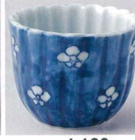
89-402-10 1,100円 梅濃小付 (6×4.8) 508950210