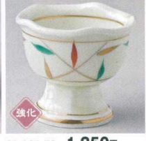
89-206-73 1,250円 金彩芦高台珍味 (6.3×5.7) 509410573