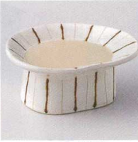
89-303-74 1,180円 錆十草高台珍味 (9.1×7.3×3.9) 508930474