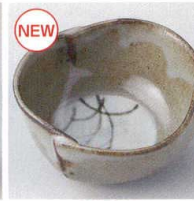
89-602-2 950円 三ツ切芦珍味 (7×3.5) 608960202