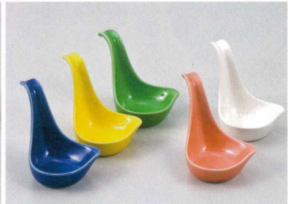
91-311-47 420円 小付レンゲ(ルリ)(6×6×7.3) 509030147 91-312-47 420円 小付レンゲ(黄)(6×6×7.3) 609131247 91-313-47 420円 小付レンゲ(ヒワ)(6×6×7.3) 609131347 91-314-47 420円 小付レンゲ(赤)(6×6×7.3) 509030247 91-315-47 420円 小付レンゲ(白)(6×6×7.3) 509030347