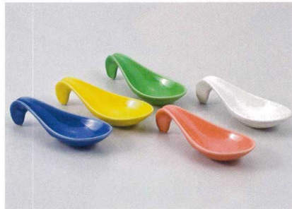
91-301-47 390円 スプーン小付(ルリ)(12×4.7×3) 609130147 91-302-47 390円 スプーン小付(黄)(12×4.7×3) 609130247 91-303-47 390円 スプーン小付(ヒワ)(12×4.7×3) 609130347 91-304-47 390円 スプーン小付(赤)(12×4.7×3) 609130447 91-305-47 390円 スプーン小付(白)(12×4.7×3) 609130547