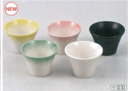
NEW 91-209-56 180円 反り型珍味入 黄吹(5.7×4) 609120956 91-210-56 180円 反り型珍味入 ヒワ吹(5.7×4) 609121056 91-211-56 180円 反り型珍味入 ピンク吹(5.7×4) 609121156 91-212-56 160円 反り型珍味入 白(5.7×4) 609121256 91-213-56 180円 反り型珍味入 黒(5.7×4) 609121356