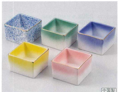
91-401-56 210円 角型珍味入吹墨(5.7×5.7×3.7) 509050856 91-402-56 210円 角型珍味入黄吹(5.7×5.7×3.7) 509050756 91-403-56 210円 角型珍味入ヒワ吹(5.7×5.7×3.7) 509050456 91-404-56 210円 角型珍味入ピンク吹(5.7×5.7×3.7) 509050656 91-405-56 210円 角型珍味入コバルト吹(5.7×5.7×3.7) 509050556