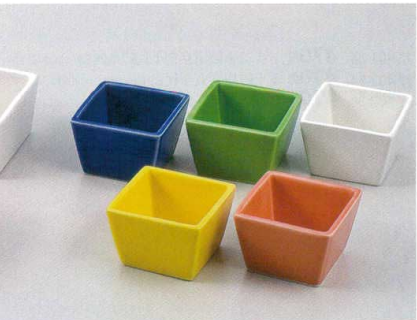
91-411-47 360円 マス型珍味(ルリ)(5.6×3.8) 609141147 91-412-47 360円 マス型珍味(黄)(5.6×3.8) 609141247 91-413-47 360円 マス型珍味(ヒワ)(5.6×3.8) 609141347 91-414-47 360円 マス型珍味(赤)(5.6×3.8) 609141447 91-415-47 360円 マス型珍味(白)(5.6×3.8) 609141547