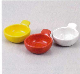
91-101-47 400円 黄片手珍味(8.5×6.8) 609110147 91-104-35 470円 丸チョコ麻葉 ムラサキ(7×3.4) 609110435 91-102-47 400円 赤片手珍味(8.5×6.8) 609110247 91-105-35 470円 丸チョコ麻葉 グリーン(7×3.4) 609110535 91-103-47 380円 白片手珍味(8.5×6.8) 609110347 91-106-35 470円 丸チョコ麻葉 ピンク(7×3.4) 609110635