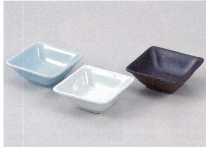
91-201-73 320円 青白磁角珍味(7×7×2.5) 509750673 91-202-73 320円 白スワン珍味(7×7×2.5) 609120273 91-203-73 320円 黒スワン珍味(7×7×2.5) 609120373