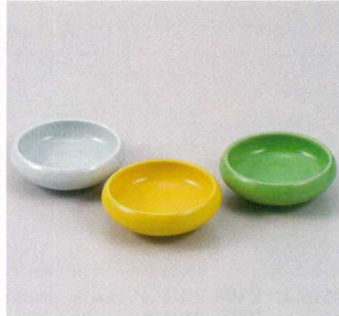
91-107-10 400円 青白浅口鉄鉢千代口(7×2.4) 609110710 91-110-57 350円 青磁菊型豆鉢(7.7×3.3) 509040957 91-108-10 400円 黄浅口鉄鉢千代口(7×2.4) 609110810 91-111-57 350円 黄菊型豆鉢(7.7×3.3) 509040757 91-109-10 400円 ヒワ浅口鉄鉢千代口(7×2.4) 609110910 91-112-57 350円 グリン菊型豆鉢(7.7×3.3) 509040857