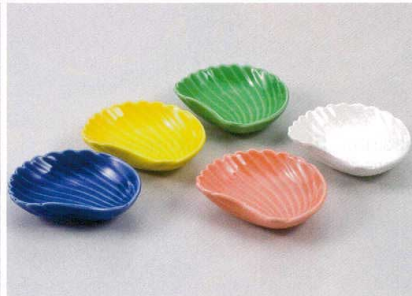
91-306-47 240円 シェル皿ルリ(小)(8.8×7.3×2.2) 609130647 91-307-47 240円 シェル皿黄(小)(8.8×7.3×2.2) 609130747 91-308-47 240円 シェル皿ヒワ(小)(8.8×7.3×2.2) 609130847 91-309-47 240円 シェル皿赤(小)(8.8×7.3×2.2) 609130947 91-310-47 240円 シェル皿白(小)(8.8×7.3×2.2) 609131047