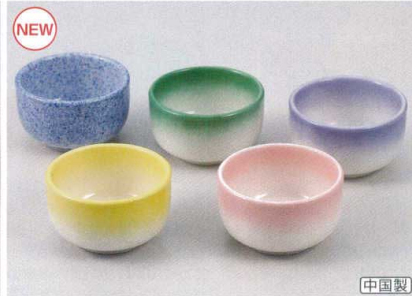
NEW 91-204-56 210円 丸型珍味入 吹墨(6.2×3.5) 609120456 91-205-56 210円 丸型珍味入 黄吹(6.2×3.5) 609120556 91-206-56 210円 丸型珍味入 ヒワ吹(6.2×3.5) 609120656 91-207-56 210円 丸型珍味入 ピンク吹(6.2×3.5) 609120756 91-208-56 210円 丸型珍味入 コバルト吹(6.2×3.5) 609120856