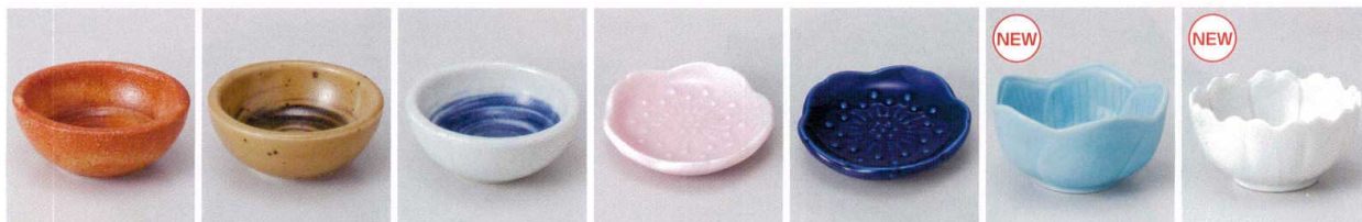
99-601-52 200円 赤志野ハケこつぶ珍味 (6.1×2.3) 509960652 99-602-52 200円 黄瀬戸ハケこつぶ珍味 (6.1×2.3) 509960752 99-603-52 200円 ゴスハケこつぶ珍味 (6.1×2.3) 609960352 99-604-10 190円 桜ピンク豆皿 (5.3×1) 509960810 99-605-10 190円 桜ルリ豆皿 (5.3×1) 609960510 99-606-79 170円 ブルーミニ小鉢 (6.4×3.3) 609960679 99-607-79 170円 白ミニ小鉢 (6.4×3.3) 609960779