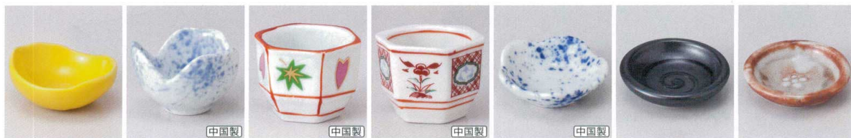
99-501-10 250円 黄楕円珍味 (5.7×5.1×2.3) 609950110 99-502-61 240円 吹墨割山椒珍味(小) (5.2×3.4) 509960261 99-503-56 210円 ぼんぼり春秋 (4.5×3.3) 509960456 99-504-56 210円 ぼんぼり万暦 (4.5×3.3) 509960356 99-505-51 210円 吹墨梅形小皿(小) (6×2) 509960551 99-506-24 210円 天目渦豆皿 (7.5×1.8) 509860724 99-507-24 210円 嵐志野梅紋豆皿 (7.5×1.8) 509860624