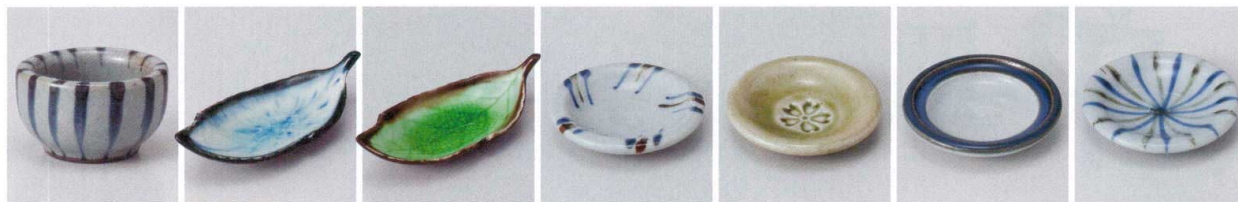
99-201-10 380円 十草のぞき (4.2×2.4) 509930910 99-202-47 370円 清流水天目珍味箸置 (9×4.2×2.3) 509940547 99-203-15 350円 木の葉型珍味箸置 (9×4×2.3) 509940615 99-204-10 380円 点小皿 (6.2×1.3) 509950310 99-205-10 370円 桜小皿 (6.2×1) 509940710 99-206-10 360円 コス小皿 (6.2×1.3) 509950410 99-207-10 360円 車小皿 (6.2×1.3) 509950510