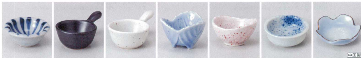
99-401-2 330円 十草傘型珍味 (5×1.9) 509950602 99-402-52 290円 黒マット手付珍味 (6.3×9.7×3) 509850752 99-403-52 290円 白マット手付珍味 (6.3×9.7×3) 509850652 99-404-74 290円 紺三葉珍味 (5.8×4) 509850574 99-405-74 290円 ピンク木目珍味 (6×5.5×3) 509860274 99-406-10 260円 吹墨のぞき (4.4×1.2) 509950810 99-407-51 250円 コバルト吹墨金梅形小皿(小) (6×2) 509960151