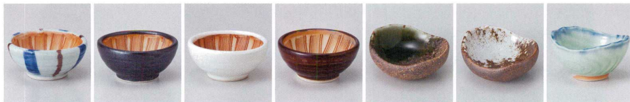
99-301-70 360円 二色十草ミニ摺り鉢珍味 (6.2×2.8) 509750371 99-302-73 340円 黒ミニスリ鉢 (6×2.8) 609930273 99-303-73 340円 白ミニスリ鉢 (6×2.8) 609930373 99-304-79 310円 ミニ摺り鉢珍味 (6.2×2.6) 509950771 99-305-10 320円 織部流し楕円豆皿 (5.7×5.1×2.3) 509950210 99-306-10 320円 白流し楕円豆皿 (5.7×5.1×2.3) 509950110 99-307-74 290円 御深井木目珍味 (6×5.5×3) 509860174