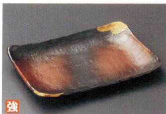
219-17-081 3,000円 0108219017 焼綿雲錦9.0焼物皿 (23.5×17×3cm) 219-18-081 2,600円 0108219018 焼綿雲錦8.0焼物皿 (23.5×14.5×3cm) 219-19-081 1,950円 0108219019 焼綿雲錦7.0焼物皿 (19.5×12.5×2.8cm)