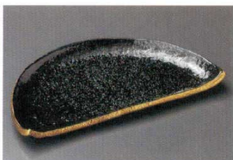
219-20-081 2,600円 0108219020 南蛮金彩8.0半月皿 (24.5×14.5×2cm) 219-21-081 2,000円 0108219021 南蛮金彩7.0半月皿 (21×12.5×2cm)