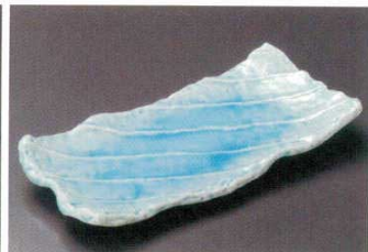
219-04-521 2,400円 0152219004 マリンプルーガタ彫焼物皿 (26×14×4.2cm)