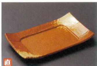
219-24-201 1,850円 0120219024 イラボ白吹7.5長角四方皿 (23.4×11.2×3.2cm) 219-25-201 1,050円 0120219025 イラボ白吹5.5長角四方皿 (17.5×10.8×2.2cm)