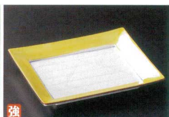
219-08-471 2,500円 0147219008 測サビ黄交趾角皿 (18×15×2.5cm)