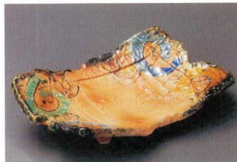
219-01-471 2,550円 0147219001 三彩赤絵焼物皿 (20×13.3×4.4cm)