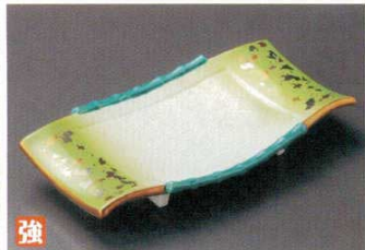
219-02-031 2,430円 0103219002 ヒワ吹金銀彩8.0焼物皿 (22×13.2×3.8cm)