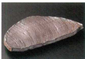
219-11-341 2,250円 0134219011 銀彩半月7.0天皿 (24.3×14×2.8cm)