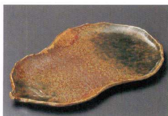
219-13-071 2,000円 0107219013 金彩吹織部ヒサコ型9.0焼物皿 (24.5×13.2×1.4cm)