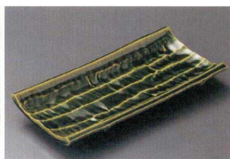
219-06-661 2,300円 0166219006 織部竹節焼物皿 (25.5×13×3.5cm)