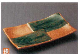
219-15-031 1,930円 0103219015 南蛮市松8.0焼物皿 (21.6×12.6×3cm)