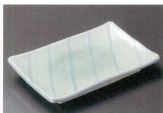
219-07-471 2,300円 0147219007 青白磁さざ波焼物皿 (22×15×3cm)