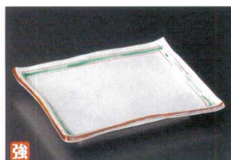
219-05-471 2,700円 0147219005 測サビ緑線長角皿 (17.5×14.5×2.5cm)