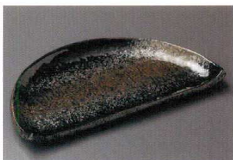
219-22-061 1,840円 0106219022 黒彩半月8.0皿 (24.5×14.5×2.2cm) 219-23-061 1,360円 0106219023 黒彩半月7.0皿 (21.2×12.2×2cm)