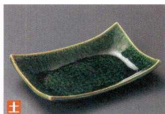
219-09-021 2,200円 0102219009 総織部(測上)7.0長角皿 (19×13×4cm)