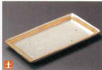
219-03-211 2,400円 0121219003 うのふ線彫長角皿 (24×13×1.9cm)