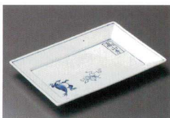
219-14-471 2,000円 0147219014 高山寺そぎ長角皿 (20×14×2cm)