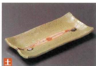
219-12-271 2,200円 0127219012 火色青磁長角皿 (11×22.5×2.8cm)