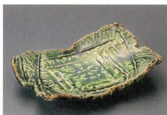
219-10-471 2,200円 0147219010 織部筋彫り長角皿 (20×13.5×4.5cm)