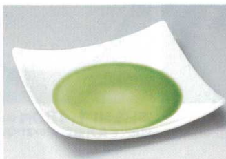
252-15-491 2,480円 0149252015 エメラルド和合皿 (24×24×4.8cm)