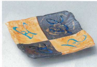
252-04-271 4,100円 0127252004 朱巻金彩雪月花盛皿 (23×23×4.5cm)