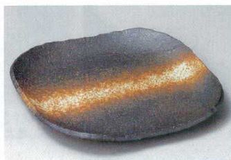
252-14-021 2,530円 0102252014 いびし備前撫正角盛皿 (24.5×24.5×3.5cm)