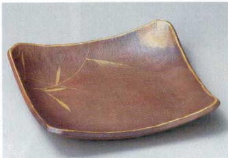
252-02-071 5,600円 0107252002 秋の詩10.0盛皿 (23.5×23.5×4.5cm)