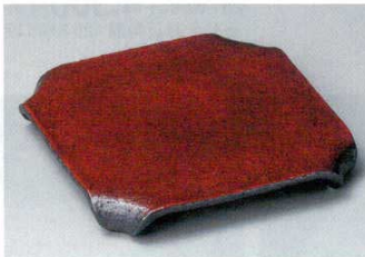
252-07-521 4,000円 0152252007 紅黒炭四っ曲げ高台皿 (23.5×23.5×3.7cm)