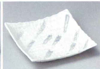
252-25-241 2,750円 0124252025 さざなみ大盛皿 (25×25×5.5cm) 252-26-241 1,150円 0124252026 さざなみ角多用鉢 (17.5×17.5×4.8cm)