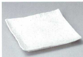
252-17-641 3,150円 0164252017 白粉引石目9.0正角皿 (27.5×27.5×4.5cm) 252-18-641 1,350円 0164252018 白粉引石目7.0正角皿 (22×22×3.7cm) 252-19-641 850円 0164252019 白粉引石目6.0正角皿 (17.5×17.5×3.7cm)