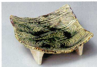
252-05-471 4,400円 0147252005 織部流水彫高浜盛皿 (25×24×8.5cm)