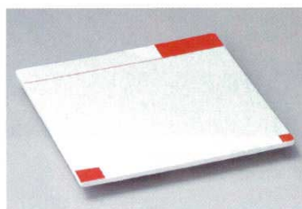
252-13-471 2,850円 0147252013 染め付レッドライン三つ足正角皿 (25×25×2.8cm)