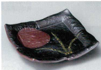
252-06-021 4,200円 0102252006 月に草文正角皿 (24×24×5cm)