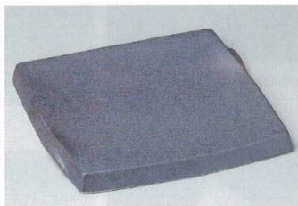
252-10-441 3,600円 0144252010 鉄ペーバースクエア皿(大) (22×22×2.3cm)