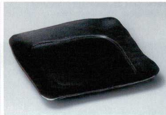
252-08-501 4,000円 0150252008 ダーク24cm四角皿 (24×24×3.5cm)