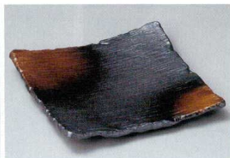
252-20-511 2,600円 0151252020 金茶吹角盛皿 (23.7×23.1×3cm) 252-21-511 1,310円 0151252021 金茶吹角口変り皿 (19.7×19.5×2.8cm)