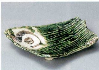
252-11-561 2,900円 0156252011 織部旬味8.0盛皿 (24×20×5cm)