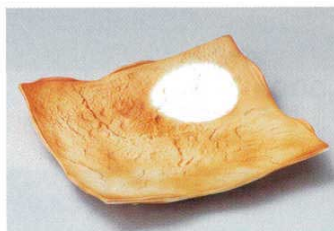
252-09-471 2,900円 0147252009 備前風満月四足皿 (24.5×24.5×4.5cm)