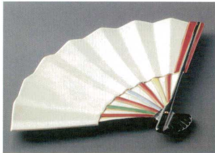
270-05-321 4,250円 0132270005 錦扇面口変り (34.2×22.7×2cm)