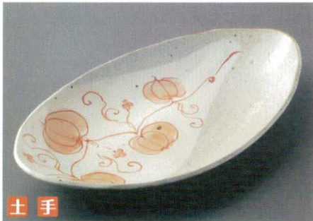
270-10-081 4,000円 0108270010 赤絵山帰来楕円バスタ皿(手造り) (30×20×5cm)