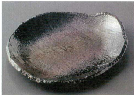
270-11-061 3,900円 0106270011 黒彩変形9.0皿 (28×24.5×3.7cm) 270-12-061 1,600円 0106270012 黒彩変形7.0皿 (20.7×18×2.6cm)