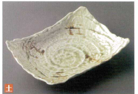
270-13-241 3,800円 0124270013 ビードロ四方上り皿(大) (31.5×23×7.5cm)