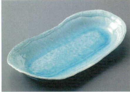
270-01-471 4,800円 0147270001 トルコかいらぎ変形大皿 (33×18×5cm)