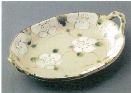
270-04-521 4,480円 0152270004 格子花楕円両手11.0皿 (36×25×6.3cm)