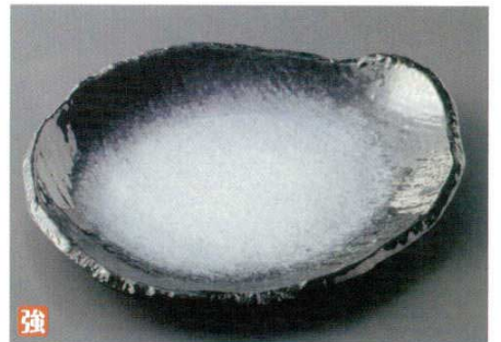
270-06-071 4,200円 0107270006 雲海9.0変形皿 (28×24.5×3.5cm)