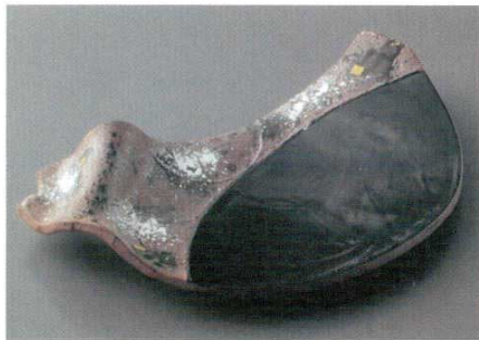
270-08-471 4,100円 0147270008 金箔ひさご皿 (29×16.5×5cm)