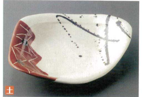
270-03-751 4,500円 0175270003 美濃焼朱巻鉄とび大皿 (29×25×5cm) 1入