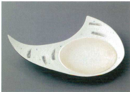
270-07-471 4,100円 0147270007 つばさ型オレンジ吹皿 (33×26×6.5cm)