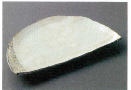
270-09-211 4,000円 0121270009 粉引印花半月皿 (27.5×15.8×1.7cm)