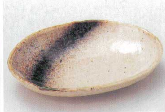
283-02-681 1,000円 0168283002 銀河石目多用皿 (22.2×16.6×4cm)