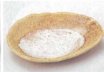
283-11-031 820円 0103283011 伊賀帯7.0変型皿 (20.5×16.3×3.3cm)