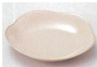
283-05-601 980円 0160283005 桜うのふ8.0皿 (24×4.3cm)