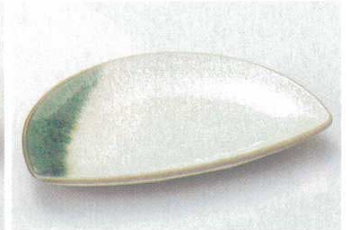
283-12-511 740円 0151283012 カイヤギ織部半月銘々皿 (18×11.4×2.2cm)