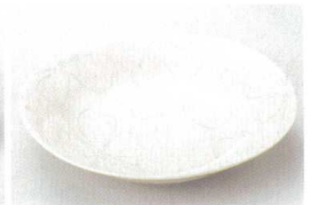
283-16-091 580円 0109283016 ハートフラワー楕円カレー皿 (21.9×20.4×4cm)