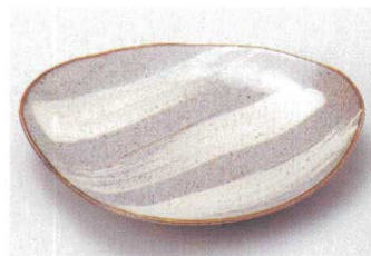
283-17-681 820円 0168283017 砂均窯刷毛8.0三角皿 (24.7×23.6×3.5cm) 283-18-681 520円 0168283018 砂均窯刷毛7.0三角皿 (20.2×19.5×3.6cm)