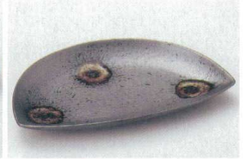
283-04-511 990円 0151283004 南蛮吹半月焼物皿 (24.8×15.6×2.6cm)