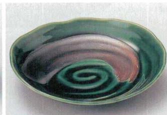
283-21-681 510円 0168283021 織部 刷毛目楕円7.0皿 (20.5×19.5×3.8cm) 283-22-681 350円 0168283022 織部 刷毛目楕円4.5皿 (13.2×12.5×3.5cm)