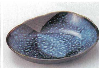
283-19-681 780円 0168283019 青流天目楕円6.0深皿 (18.3×15×3.3cm) 283-20-681 610円 0168283020 青流天目楕円4.5深皿 (14.3×11.7×1.5cm)