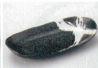
283-07-541 950円 0154283007 黒釉白刷毛長皿 (26.5×13.5×4.5cm)