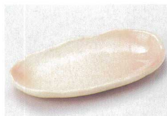
283-13-021 790円 0102283013 桜志野 手造風万能皿 (21×11.5×2.5cm)