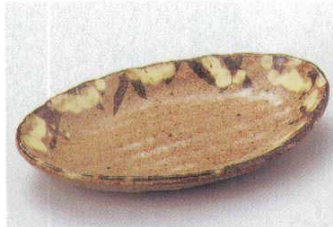
283-01-491 1,000円 0149283001 穂波楕円鉢 (23.5×14×4cm)