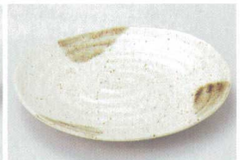
283-08-681 920円 0168283008 白唐津刷毛8.0楕円バスタ皿 (24.5×22×3.5cm)