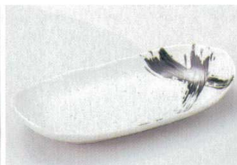
283-06-541 950円 0154283006 白釉黒刷毛長皿 (26.5×13.5×4.5cm)