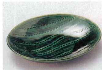
283-09-501 850円 0150283009 総織部縄目楕円皿 (24×19.6×3.8cm)