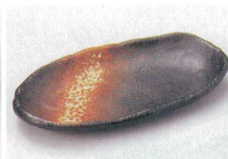
283-14-021 790円 0102283014 いぶし備前 手造風万能皿 (21×11.5×2.5cm)