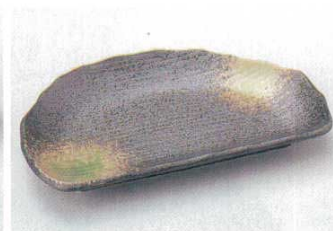
283-15-661 660円 0166283015 ヒワ吹半月皿 (21×13.3×2.6cm)