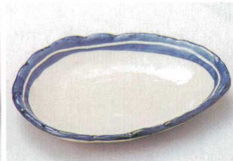
283-10-031 820円 0103283010 一珍測ライン7.0変型皿 (20.5×16.3×3.3cm)