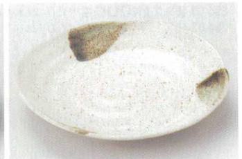
283-23-681 510円 0168283023 白唐津 刷毛楕円7.0皿 (20.5×19.5×3.8cm) 283-24-681 350円 0168283024 白唐津 刷毛楕円4.5皿 (13.2×12.5×3.5cm)