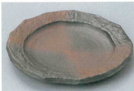
296-07-531 3,900円 0153296007 備前風8.5リム付皿 (26×3cm)