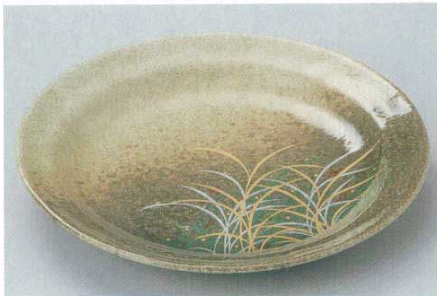
296-04-651 1,000円 0165296004 金彩武蔵野8.0皿 (23.8×3cm)