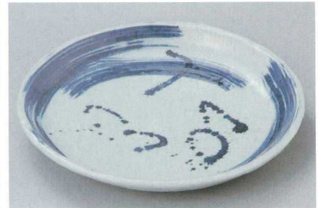
296-09-501 4,000円 0150296009 「軽量」呉須刷毛目玉淵丸9.0皿 (26×3.2cm)