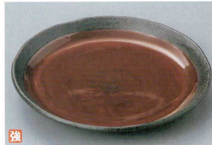
296-13-471 5,000円 0147296013 黒碧鉄砂9.0皿 (28×4.2cm) 296-14-471 4,500円 0147296014 黒碧鉄砂8.0皿 (24.5×3.8cm)