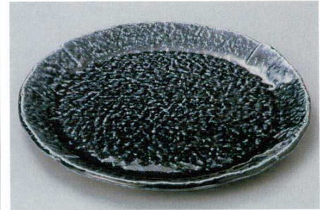
296-15-071 3,300円 0107296015 紺釉9.0丸皿 (28.5×2.4cm) 296-16-071 1,500円 0107296016 紺釉7.0丸皿 (21.5×2cm) 296-17-071 940円 0107296017 紺釉6.0丸皿 (18.3×2.3cm)