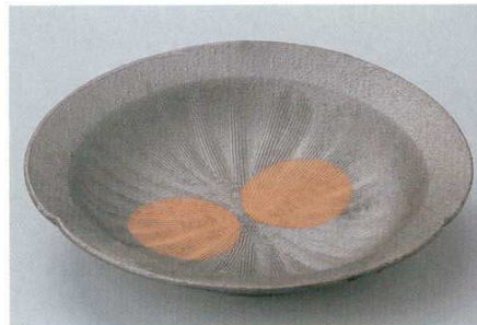
296-08-661 5,300円 0166296008 南蛮櫛目9.0輪花盛皿 (26.7×5.5cm)