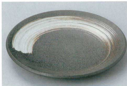
296-10-541 1,900円 0154296010 刷毛天目玉9.0皿 (27.5×2cm) 296-11-541 880円 0154296011 刷毛天目玉7.0皿 (23.8×1.8cm) 296-12-541 770円 0154296012 刷毛天目玉6.0皿 (21×1.8cm)