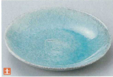
296-02-471 4,300円 0147296002 トルコ福の字8.0皿 (24.5×3.5cm)