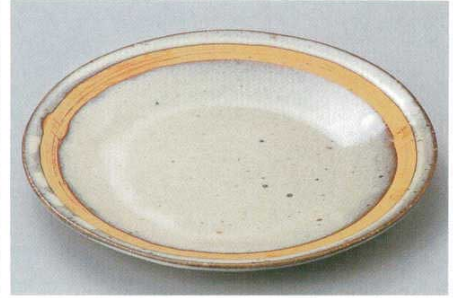
296-03-211 2,750円 0121296003 うのふ線彫9.0皿 (26×2.8cm)