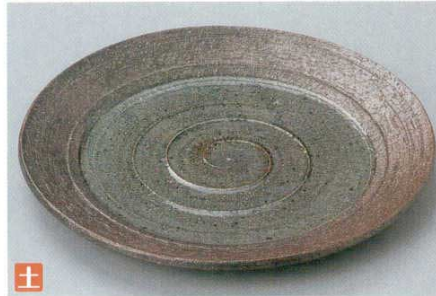
296-05-471 5,400円 0147296005 唐津呉須巻9.0皿 (26.5×2.5cm)