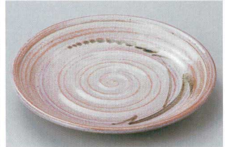
296-06-501 4,700円 0150296006 曙さび落し玉淵8.5皿 (26.2×3.7cm)