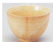
469-35-401 320円 0140469035 梨地離宮多用井 (11.8×9.8cm)