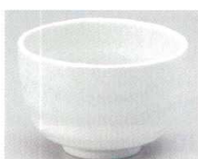
469-25-511 490円 0151469025 淡雪京小井 (10.8×7.2cm)