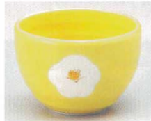
469-10-511 750円 0151469010 イエロー山茶花小井 (10.6×7.2cm)