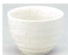
469-27-511 420円 0151469027 粉引いっぶく碗 (10.7×7.5cm)