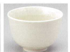
469-36-541 300円 0154469036 ページュ京小井 (11.6×7.6cm)