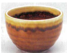
469-20-601 580円 0160469020 茶織部流し多用碗 (10.7×7cm)