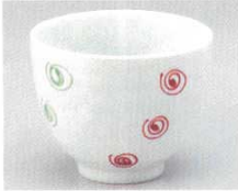
469-02-471 900円 0147469002 うずうず小井 (10.7×8.5cm)