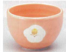
469-11-511 700円 0151469011 ピンク山茶花小井 (10.6×7.2cm)