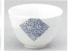
469-06-231 830円 0123469006 白マット桜丸碗 (11.2×7.5cm)