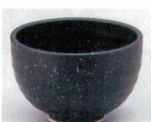
469-32-641 400円 0164469032 黒銀いっぶく碗 (10.5×6.6cm)