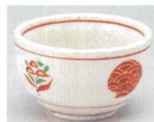
469-23-511 480円 0151469023 粉引赤絵丸紋3.5小井 (10.3×6.5cm)