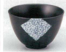
469-05-231 830円 0123469005 黒マット桜丸碗 (11.2×7.5cm)