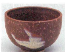
469-31-641 400円 0164469031 銀彩茶いっぶく碗 (10.8×6.8cm)