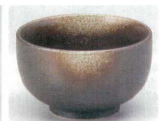
469-24-351 430円 0135469024 白吹天目姫井 (11×6.5cm)