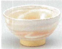
469-01-201 900円 0120469001 御本粉引ゆったり碗(小) (11.8×7.5cm)