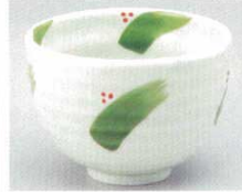
469-03-231 920円 0123469003 そよ風小井 (11.9×8.3cm)