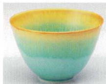
469-16-341 600円 0134469016 緑釉茶流小鉢 (11.3×7.6cm)