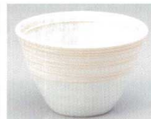
469-17-651 600円 0165469017 あかり多用碗小 (11×7.3cm)