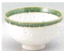
469-22-641 540円 0164469022 織部流入丸碗 (11.5×7cm)