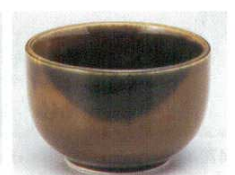
469-30-681 410円 0168469030 織部4.0多用碗 (10.8×6.7cm)