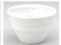
469-18-651 600円 0165469018 ほのか多用碗小 (11×7.3cm)