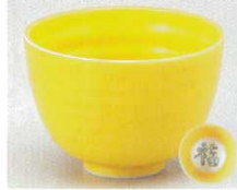
469-04-521 860円 0152469004 黄釉福小井 (11.8×8cm)