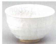
469-15-291 610円 0129469015 粉引六兵衛小井 (11×7cm)