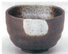
469-13-351 540円 0135469013 白吹天目京小井 (10.2×7.5cm)