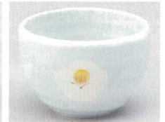
469-12-511 700円 0151469012 ブルー山茶花小井 (10.6×7.2cm)