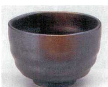
469-26-511 490円 0151469026 金茶吹京小井 (10.8×7.2cm)