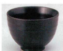
469-34-401 320円 0140469034 梨地天目多用井 (11.8×9.8cm)