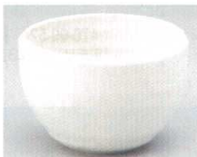
469-14-641 630円 0164469014 白釉コロコロ碗 (10.5×7.3cm)