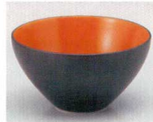
469-09-511 820円 0151469009 柿釉3.8井 (11.7×6.2cm)