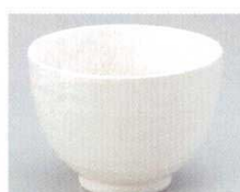
469-33-401 320円 0140469033 梨地白釉多用井 (11.8×9.8cm)