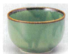
469-29-681 410円 0168469029 益子4.0多用碗 (10.8×7cm)