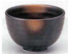
469-07-231 830円 0123469007 備前吹ミニ井 (11.5×7.5cm)