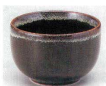
469-28-681 410円 0168469028 天目白流し4.0多用碗 (10.8×6.7cm)