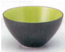
469-08-511 820円 0151469008 ヒワ釉3.8井 (11.7×6.2cm)