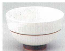
469-21-641 540円 0164469021 粉引錆線丸碗 (11.5×7cm)