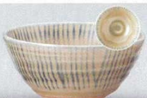
486-15-011 700円 0101486015 霜柱茶碗 (15.9×8.5cm)