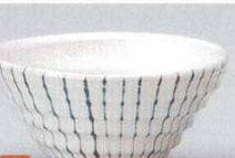
486-23-061 780円 0106486023 均窯十草反茶碗 (12.7×6.3cm)