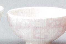
486-29-231 900円 0123486029 志野花づくし京茶碗 (11.3×6cm)