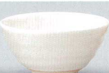
486-34-011 680円 0101486034 乳白茶碗 (9.9×1.4cm)