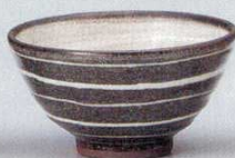
486-02-011 1,040円 0101486002 如意茶碗 (11.2×5.9cm)