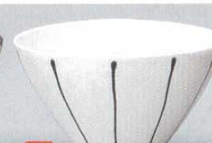
486-20-241 920円 0124486020 ストライプ(白)飯碗 (12.2×7.3cm)