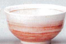
486-08-031 800円 0103486008 粉引赤巻腰丸茶碗 (11.2×6cm)