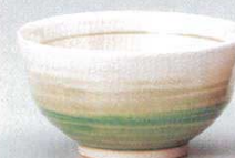
486-07-031 800円 0103486007 粉引ヒワボカン腰丸茶碗 (11.2×6cm)