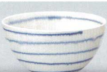
486-33-241 1,000円 0124486033 かすり流し飯碗 (11×6.2cm)