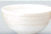
486-35-651 680円 0165486035 あかり茶碗 (11.3×6.2cm)