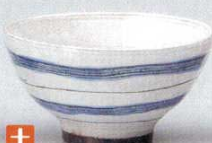
486-11-081 1,100円 0108486011 粉引ボーダー飯碗(ブルー) (11.2×6cm)