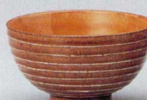
486-25-641 1,100円 0164486025 ボーダー飯碗(茶) (11.6×6.5cm)