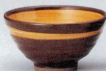
486-01-011 900円 0101486001 光明茶碗 (11.2×5.9cm)