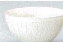
486-31-241 1,000円 0124486031 粉引ストライプ飯碗 (11×6.2cm)