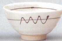
486-05-011 700円 0101486005 平和茶碗 (11.2×5.9cm)