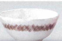
486-16-011 990円 0101486016 ぐるり茶碗 (11.2×5.9cm)