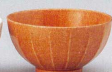
486-30-401 270円 0140486030 色釉茶型入中平 (11.8×5.2cm)