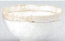
486-36-501 630円 0150486036 錆彩飯碗 (11×6.2cm)