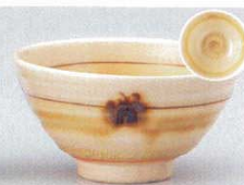
486-06-011 700円 0101486006 なごみ茶碗 (11.2×5.9cm)