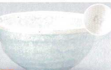
486-18-271 1,100円 0127486018 ブルーロクロ目茶漬 (12×6.5cm)