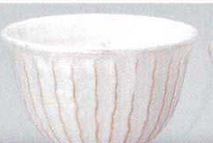
486-22-671 800円 0167486022 粉引しのぎ中平 (11.5×7.7cm)