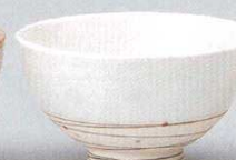
486-27-501 800円 0150486027 春風茶碗(大) (11.5×6.4cm)