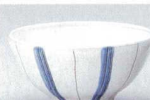
486-13-011 1,080円 0101486013 青十草茶碗 (11.2×5.9cm)