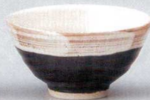
486-04-011 790円 0101486004 魁茶碗 (11.2×5.9cm)