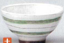
486-10-081 1,100円 0108486010 粉引ボーダー飯碗(グリーン) (11.2×6cm)