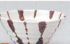
486-24-061 780円 0106486024 錆十草反茶碗 (12.7×6.3cm)