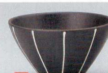
486-19-241 920円 0124486019 ストライプ(黒)飯碗 (12.2×7.3cm)