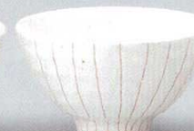
486-28-461 820円 0146486028 粉引十草茶碗 (11.7×7cm)