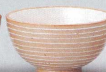
486-26-641 1,100円 0164486026 ボーダー飯碗(白) (11.6×6.5cm)