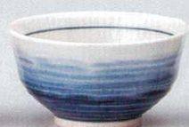
486-09-031 800円 0103486009 粉引紺巻腰丸茶碗 (11.2×6cm)