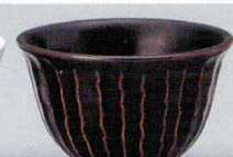
486-21-671 800円 0167486021 鉄黒しのぎ中平 (11.5×7.7cm)