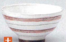
486-12-081 1,100円 0108486012 粉引ボーダー飯碗(ピンク) (11.2×6cm)