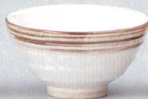
486-03-011 770円 0101486003 イ号飯碗 (11.2×5.9cm)