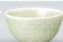
486-32-501 680円 0150486032 ヒワ釉けがき京碗 (10.2×6cm)