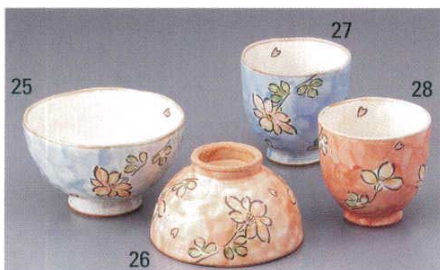
495-25-071 1,200円 染花もめん飯碗 (大) (12×5.8cm) 0107495025 495-26-071 1,100円 染花もめん飯碗 (小) (11.5×5.5cm) 0107495026 495-27-071 1,200円 染花もめん湯呑 (大) (8×7.6cm) 10入 0107495027 495-28-071 1,100円 染花もめん湯呑 (小) (7.6×7.3cm) 10入 0107495028