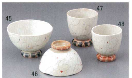
495-45-071 1,150円 春風飯碗 (大) (11×6.8cm) 0107495045 495-46-071 1,100円 春風飯碗 (小) (10×6.8cm) 0107495046 495-47-071 1,150円 春風湯呑 (大) (7.7×8cm) 10入 0107495047 495-48-071 1,100円 春風湯呑 (小) (7×7.5cm) 10入 0107495048

大形 徳利 刺身 陶器 小鉢 小皿 和皿 焼皿 大皿 湯呑 湯呑蓋 茶碗 土瓶 急須 湯呑 和陶 オートマン 耐熱 萬古焼 洋食器 碗皿 中華食器 茶道具 カメ 和洋 オートマン 本漆竹製品 和洋 和洋 和洋