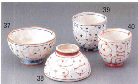
495-37-071 1,150円 粉引唐草飯碗 (大) (11.1×6.5cm) 0107495037 495-38-071 1,050円 粉引唐草飯碗 (小) (10.4×6cm) 0107495038 495-39-071 1,200円 粉引唐草湯呑 (大) (7.9×7.7cm) 10入 0107495039 495-40-071 1,100円 粉引唐草湯呑 (小) (7.6×7.3cm) 10入 0107495040