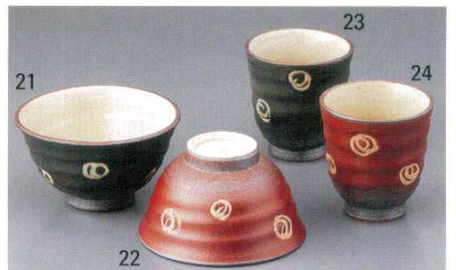
495-21-231 1,250円 吹丸茶碗 (緑) (11.8×6.7cm) 0123495021 495-22-231 1,250円 吹丸茶碗 (赤) (11.8×6.7cm) 0123495022 495-23-231 1,250円 吹丸長湯呑 (緑) (8×8.5cm) 10入 0123495023 495-24-231 1,250円 吹丸長湯呑 (赤) (8×8.5cm) 10入 0123495024