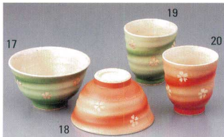
495-17-231 1,250円 春うらら茶碗 (グリーン) (12×6.7cm) 0123495017 495-18-231 1,250円 春うらら茶碗 (ピンク) (12×6.7cm) 0123495018 495-19-231 1,250円 春うらら長湯呑 (グリーン) (8×8.5cm) 10入 0123495019 495-20-231 1,250円 春うらら長湯呑 (ピンク) (8×8.5cm) 10入 0123495020