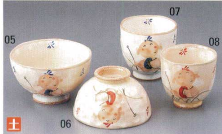
495-05-081 1,260円 お地藏さん大平 (11.2×6.5cm) 0108495005 495-06-081 1,160円 お地藏さん中平 (10.5×6cm) 0108495006 495-07-081 1,260円 お地藏さん湯呑 (大) (8×8cm・210cc) 0108495007 495-08-081 1,160円 お地藏さん湯呑 (小) (7.7×7.5cm・180cc) 0108495008