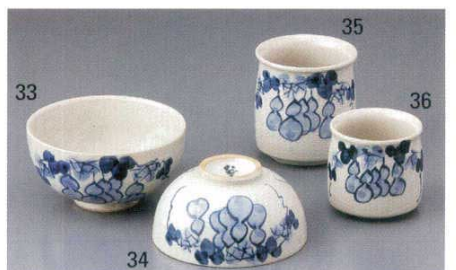
495-33-721 1,200円 六瓢 (無病) 茶碗 (手描き) (11×5.8cm) 1入 0172495033 495-34-721 1,100円 六瓢 (無病) 茶碗 (小) (手描き) (10.5×5.5cm) 1入 0172495034 495-35-721 1,300円 六瓢 (無病) 湯のみ (手描き) (7×7.5cm) 1入 0172495035 495-36-721 1,200円 六瓢 (無病) 湯のみ (小) (手描き) (5.5×6.5cm) 1入 0172495036