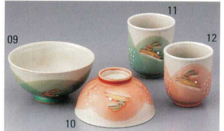
495-09-091 1,250円 野うさぎ飯碗 (大) (12.2×5.7cm) 120入 0109495009 495-10-091 1,250円 野うさぎ飯碗 (小) (11×5.3cm) 120入 0109495010 495-11-091 1,250円 野うさぎ湯呑 (大) (7×8.4cm) 10入 0109495011 495-12-091 1,250円 野うさぎ湯呑 (小) (7×7.9cm) 10入 0109495012