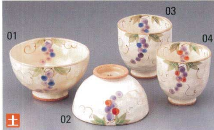
495-01-081 1,260円 二彩ぶどう大平 (11.2×6.5cm) 0108495001 495-02-081 1,160円 二彩ぶどう中平 (10.5×6cm) 0108495002 495-03-081 1,260円 二彩ぶどう湯呑 (大) (8×8cm・210cc) 10入 0108495003 495-04-081 1,160円 二彩ぶどう湯呑 (小) (7.7×7.5cm・180cc) 10入 0108495004