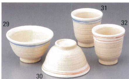
495-29-231 1,200円 雪化粧ライン茶碗 (青) (11.8×6.5cm) 0123495029 495-30-231 1,200円 雪化粧ライン茶碗 (赤) (11.8×6.5cm) 0123495030 495-31-231 1,200円 雪化粧ライン湯呑 (青) (8.2×8.5cm) 10入 0123495031 495-32-231 1,200円 雪化粧ライン湯呑 (赤) (8.2×8.5cm) 10入 0123495032