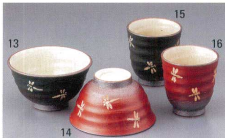
495-13-231 1,250円 トンボ茶碗 (緑) (12×7cm) 0123495013 495-14-231 1,250円 トンボ茶碗 (赤) (12×7cm) 0123495014 495-15-231 1,250円 トンボ長湯呑 (緑) (8×8.5cm) 10入 0123495015 495-16-231 1,250円 トンボ長湯呑 (赤) (8×8.5cm) 10入 0123495016