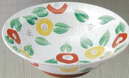
006-06-641 15,600円 0164006006 山茶花10.0高台鉢 (31.5×9cm) 1入