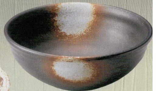
006-09-021 12,500円 0102006009 いぶし備前 惣菜鉢 (33×12cm)