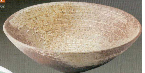
006-05-781 16,500円 0178006005 信楽焼古陶白窯変盛鉢 (35.5×11cm)