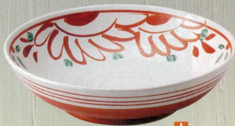
006-07-471 15,000円 0147006007 春花大鉢 (30.5×8.3cm)