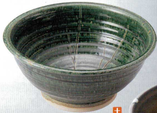
006-01-501 32,000円 0150006001 織部彫11.0腰張大鉢 (35×15.5cm)