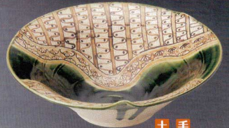
土手 006-03-081 27,000円 0108006003 織部古紋大鉢 (31×10cm) 1入