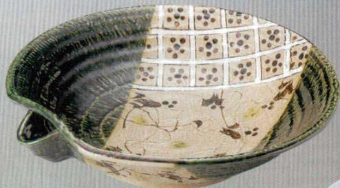
006-04-521 18,000円 0152006004 織部格子梅片口12.0盛鉢 (37×35.6×9.4cm)