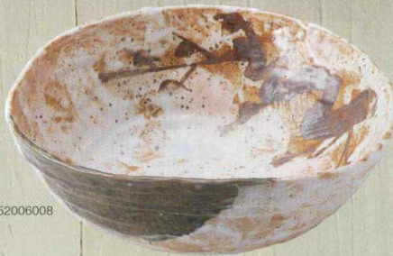
006-08-521 13,700円 0152006008 織部古木大鉢 (31.5×28×11cm)