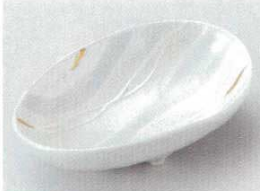
060-15-471 2,250円 0147060015 青磁流水ラスタ-三足小鉢 (17×11×4.5cm)