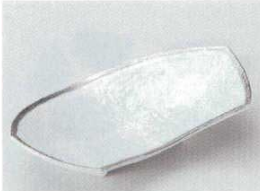
060-19-471 2,230円 0147060019 瀏プラチナ向付 (20×10.5×4.2cm)