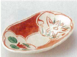
060-24-521 2,200円 0152060024 赤絵楕円向付 (18.2×12×3.8cm)