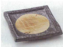
060-29-491 2,150円 0149060029 黒釉砂目正角5.5皿 (17.5×17.5×3.2cm)