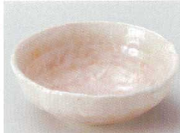
060-30-321 2,150円 0132060030 曙向附 (14×5cm)