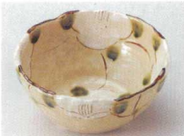
060-22-521 2,200円 0152060022 格子花三ツ足5.0鉢 (15.3×7cm)