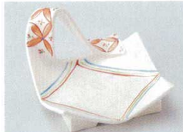
060-11-471 2,250円 0147060011 赤絵菱紋角抜き角皿 (14×13×7.3cm)