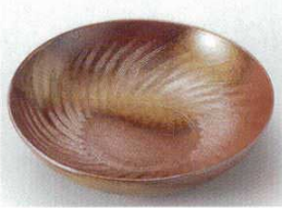
060-03-661 2,300円 0166060003 南蛮5.0平向付 (16.5×3.6cm)