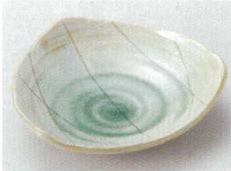
060-10-031 2,270円 0103060010 手彫りライン変型鉢 (20×18.4×5.2cm)