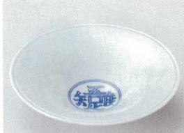
060-01-201 2,350円 0120060001 青磁吾足知反向付 (15.9×4.3cm)

大鉢 魚鉢 刺身 向付小鉢 小付珍味 煎餅 煎餅皿 大皿 酒器 茶器 茶碗 土瓶 急須 湯呑 和蘭 オーブン 耐熱 角占 洋食器 と神皿 中華 食器 茶道具 カメ 古 鉢 イ 器 木 漆 竹 製 品 因 子 神 社 公 司