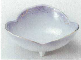
060-05-091 2,300円 0109060005 銀彩むさしの三ツ山刺身鉢 (15.7×5.8cm)