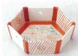
060-16-321 2,250円 0132060016 高麗魯山人写向附 (15×13×4cm)