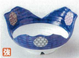
060-07-271 2,300円 0127060007 赤絵線紋5.0浅鉢 (15.5×4cm)