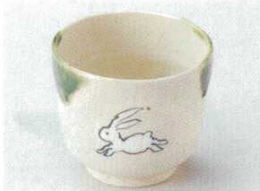
060-20-321 2,210円 0132060020 鳴海織部筒向附 (10.5×9cm)