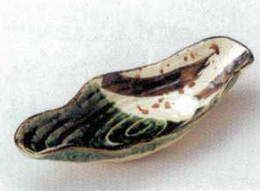
060-02-531 2,300円 0153060002 織部サビハケ舟型向付 (26.3×11.2×4.5cm)