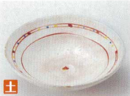
060-06-081 2,300円 0108060006 粉引鉄彩樹目楕円皿 (19×18×4.5cm)