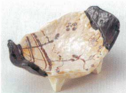
060-14-411 2,250円 0141060014 黒織部小鉢(大)足付 (16.5×11.5×5.5cm)