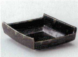
060-13-471 2,250円 0147060013 紺織部菱型鉢 (20.5×15×4.5cm)