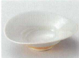
060-25-541 2,200円 0154060025 緑貫入ひねり段付5.5鉢 (18.3×17.5×5.5cm)