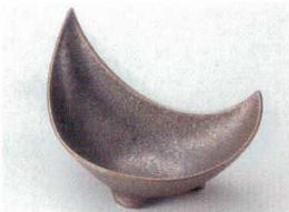
060-17-541 2,250円 0154060017 ゴールド結晶三日月向付 (23×11×12.3cm)