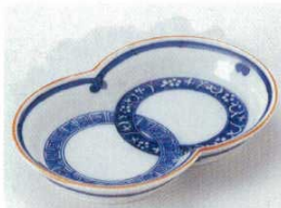
060-28-521 2,200円 0152060028 輪つなぎ向付 (16.5×11.2×2.2cm)