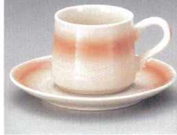
土物六兵衛ピンク

791-09-401 1,050円 0140791009 コーヒー碗皿 (碗6.5×6.2cm・皿13.8×1.6cm) 6入 791-10-401 630円 0140791010 コーヒー碗のみ (160cc) 10入