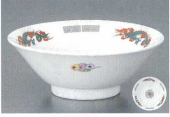
848-10-681 1,350円 0168848010 宝竜切立6.8井 (20.3×7.2cm) 848-11-681 910円 0168848011 宝竜切立6.3井 (19.5×6.7cm)