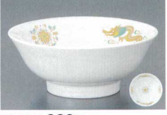
848-22-431 900円 0143848022 西安6.8高台井 (21×8.5cm)