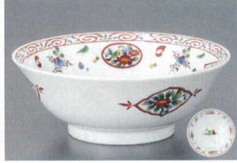
848-24-491 720円 0149848024 唐草赤絵花鳥6.3井 (19.3×7.2cm)