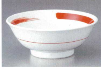
848-14-671 1,250円 0167848014 (手描)あかつき7.0高台井 (21.6×8.5cm)