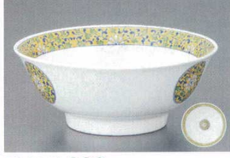
848-20-491 980円 0149848020 黄唐草6.8井 (21×8.5cm)