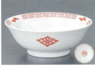
848-25-491 720円 0149848025 翔鳳(赤)6.3井 (19.3×7.2cm)