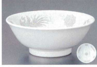
848-19-651 1,000円 0165848019 外白北京6.8高台井 (21×8.5cm)