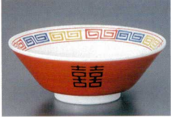
848-03-611 2,400円 0161848003 朱巻き雷門7.0切立井(イングレース) (21.5×7.7cm) 848-04-611 2,200円 0161848004 朱巻き雷門6.5切立井(イングレース) (19.5×7cm)