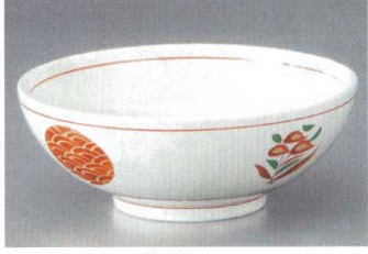
848-09-491 1,380円 0149848009 粉引釉丸紋7.0麵鉢 (21.3×8cm)