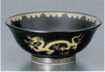
848-05-611 1,780円 0161848005 黒釉金龍6.8高台井 (21.2×8.3cm) 848-06-611 1,360円 0161848006 黒釉金龍6.3高台井 (18.7×7.8cm)