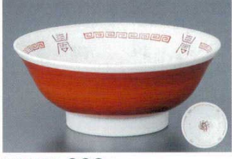
848-21-431 900円 0143848021 赤巻鳳凰6.8高台井 (21×8.5cm)