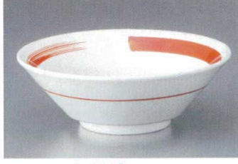
848-15-671 1,150円 0167848015 (手描)あかつき7.0切立井 (21.4×7.5cm) 848-16-671 900円 0167848016 (手描)あかつき6.5切立井 (19.4×7cm)