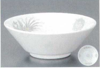
848-26-671 700円 0167848026 北京6.3切立井 (19.2×7cm)