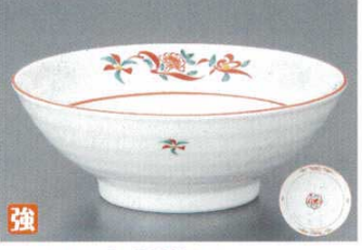
848-12-651 1,120円 0165848012 赤絵花7.0井 (21.2×7.6cm) 848-13-651 910円 0165848013 赤絵花6.5井 (20.2×7.5cm)