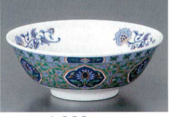
848-18-681 1,020円 0168848018 間取三景(緑)6.3井 (19.8×7.5cm)