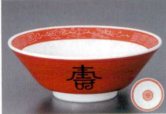
848-01-611 2,400円 0161848001 朱巻き竜門7.0切立井(イングレース) (21.5×7.7cm) 848-02-611 2,200円 0161848002 朱巻き竜門6.5切立井(イングレース) (19.5×7cm)

大鉢 磁鉢 側身 和印 磁印 大印 酒樽 茶器 茶鉢 土瓶 急須 湯呑 和陶 オーブン 耐熱 重古焼 洋食器 二部皿 中華食器 茶道具 カマ 木漆竹製品 カマ 御神保 漆器