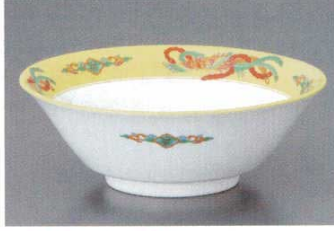
848-08-651 1,390円 0165848008 黄鳳凰6.8切立井 (20.3×7.2cm)