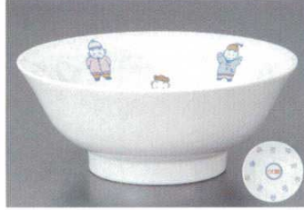
848-23-431 900円 0143848023 中華街6.8高台井 (21×8.5cm)