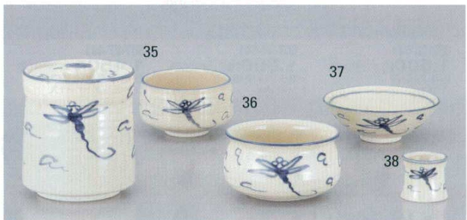
868-34-081 3,200円 0108868034 安南水指 (12.5×15cm) (化) 868-35-081 1,800円 安南茶碗 (11.7×7.3cm) (化) 0108868035 868-36-081 1,850円 安南建水 (13×7.5cm) (化) 0108868036 868-37-081 1,800円 安南平茶碗 (14.5×5.2cm) (化) 0108868037 868-38-081 500円 安南蓋置 (5.5×5cm) (非) 0108868038