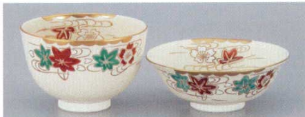
868-07-081 3,700円 0108868007 立田川茶碗 (12.5×7.8cm) (化) 868-08-081 3,700円 0108868008 立田川平茶碗 (14.3×5.3cm) (化)