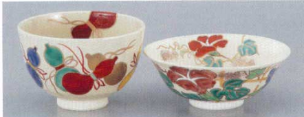
868-01-081 4,800円 0108868001 六瓢茶碗 (12.5×7.8cm) (化) 868-02-081 4,800円 0108868002 朝顔平茶碗 (14.3×5.3cm) (化)

大鉢 盛持刺身 四角鉢 小鉢 小鉢 和皿 椀 大皿 酒器 蓋 蓋子 丼 茶碗 土瓶 急須 湯呑 和陶 オープン 耐熱 高古焼 洋食器 碗面 中華食器 茶道具 カメ 小鉢 小鉢 木 漆 竹 製品 カメ 耐熱 高古焼