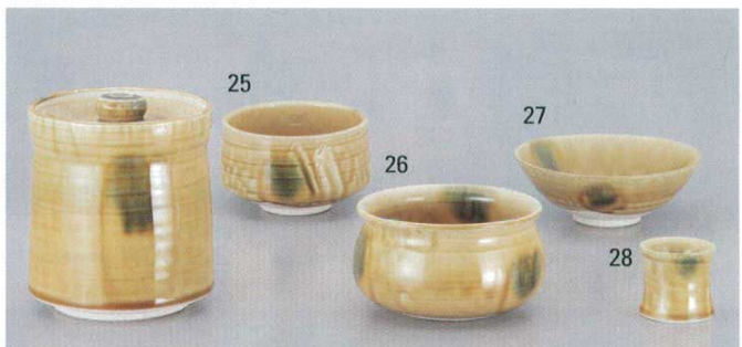
868-24-081 3,200円 0108868024 黄瀬戸水指 (12.5×15cm) (化) 868-25-081 1,800円 黄瀬戸茶碗 (11.7×7.3cm) (化) 0108868025 868-26-081 1,850円 黄瀬戸建水 (13×7.5cm) (化) 0108868026 868-27-081 1,800円 黄瀬戸平茶碗 (14.5×5.2cm) (化) 0108868027 868-28-081 500円 黄瀬戸蓋置 (5.5×5cm) (非) 0108868028