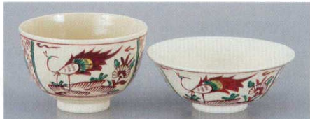
868-09-081 2,750円 0108868009 間取鳳凰茶碗 (12.5×7.8cm) (化) 868-10-081 2,750円 0108868010 間取鳳凰平茶碗 (14.3×5.3cm) (化)