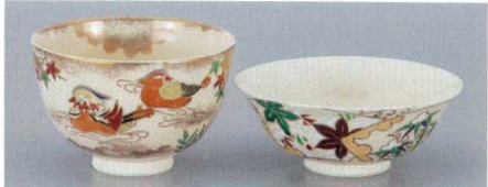
868-05-081 4,800円 0108868005 おしどり茶碗 (12.5×7.8cm) (化) 868-06-081 4,800円 0108868006 扇面春秋平茶碗 (14.3×5.3cm) (化)