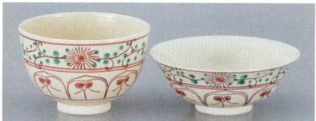
868-11-081 2,550円 0108868011 安南写茶碗 (12.5×7.8cm) (化) 868-12-081 2,550円 0108868012 安南写平茶碗 (14.3×5.3cm) (化)