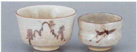
868-17-081 4,300円 0108868017 志野わん型茶碗 (12.5×7.7cm) (化) 868-18-081 2,250円 0108868018 志野野立茶碗 (9.5×6.5cm) (化)