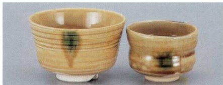
868-15-081 4,300円 0108868015 黄瀬戸わん型茶碗 (12.5×7.7cm) (化) 868-16-081 2,250円 0108868016 黄瀬戸野立茶碗 (9.5×6.5cm) (化)