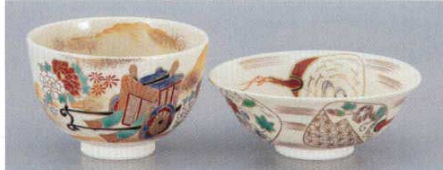
868-03-081 4,800円 0108868003 御所車茶碗 (12.5×7.8cm) (化) 868-04-081 4,800円 0108868004 団扇平茶碗 (14.3×5.3cm) (化)