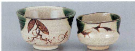
868-13-081 4,300円 0108868013 織部わん型茶碗 (12.5×7.7cm) (化) 868-14-081 2,250円 0108868014 織部野立茶碗 (9.5×6.5cm) (化)